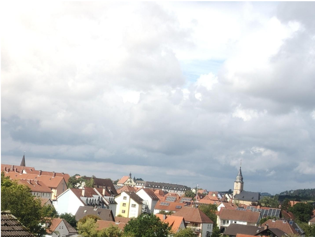
Ausblick auf Burgkunstadt