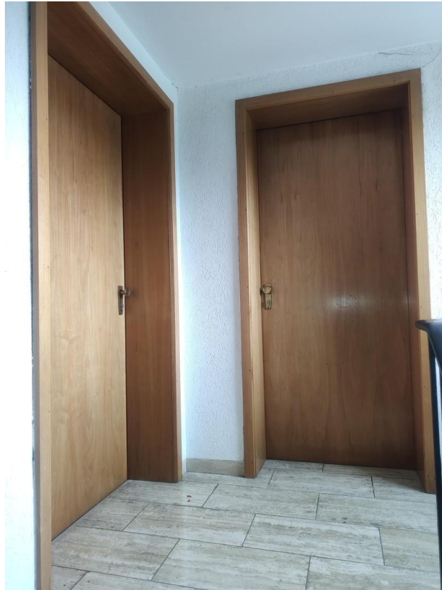
Eingang zum Dachgeschoss