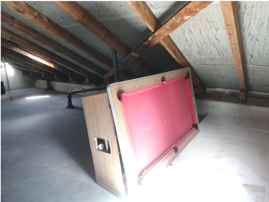
Billardtisch zu verschenken