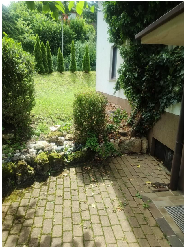
Eingangsbereich linke Seite