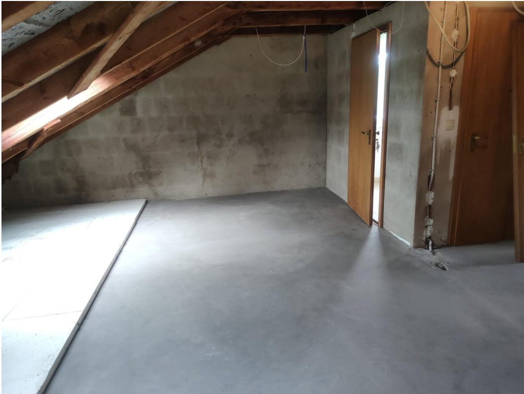
Dachboden Türen innen