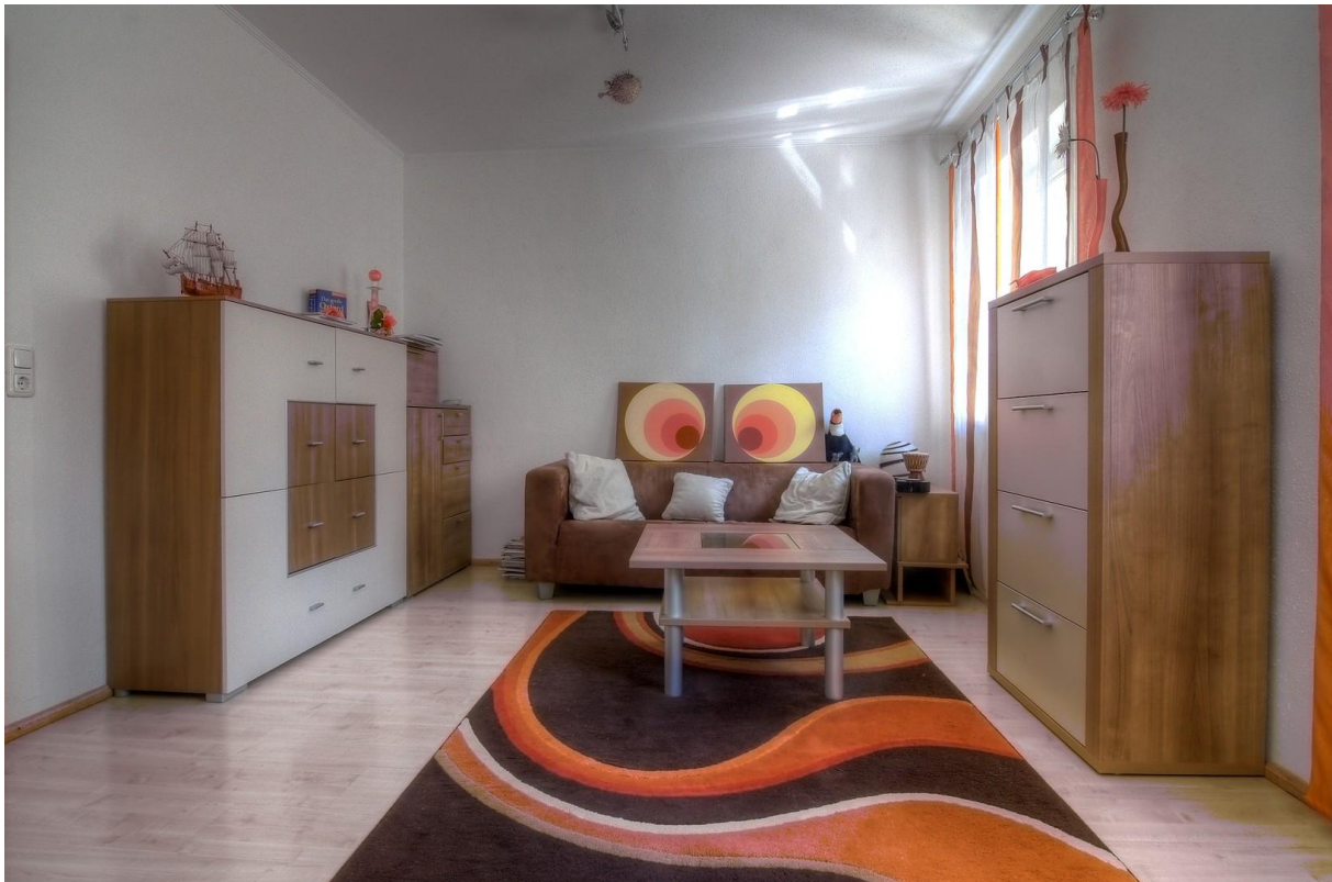
Kinderzimmer 2, EG