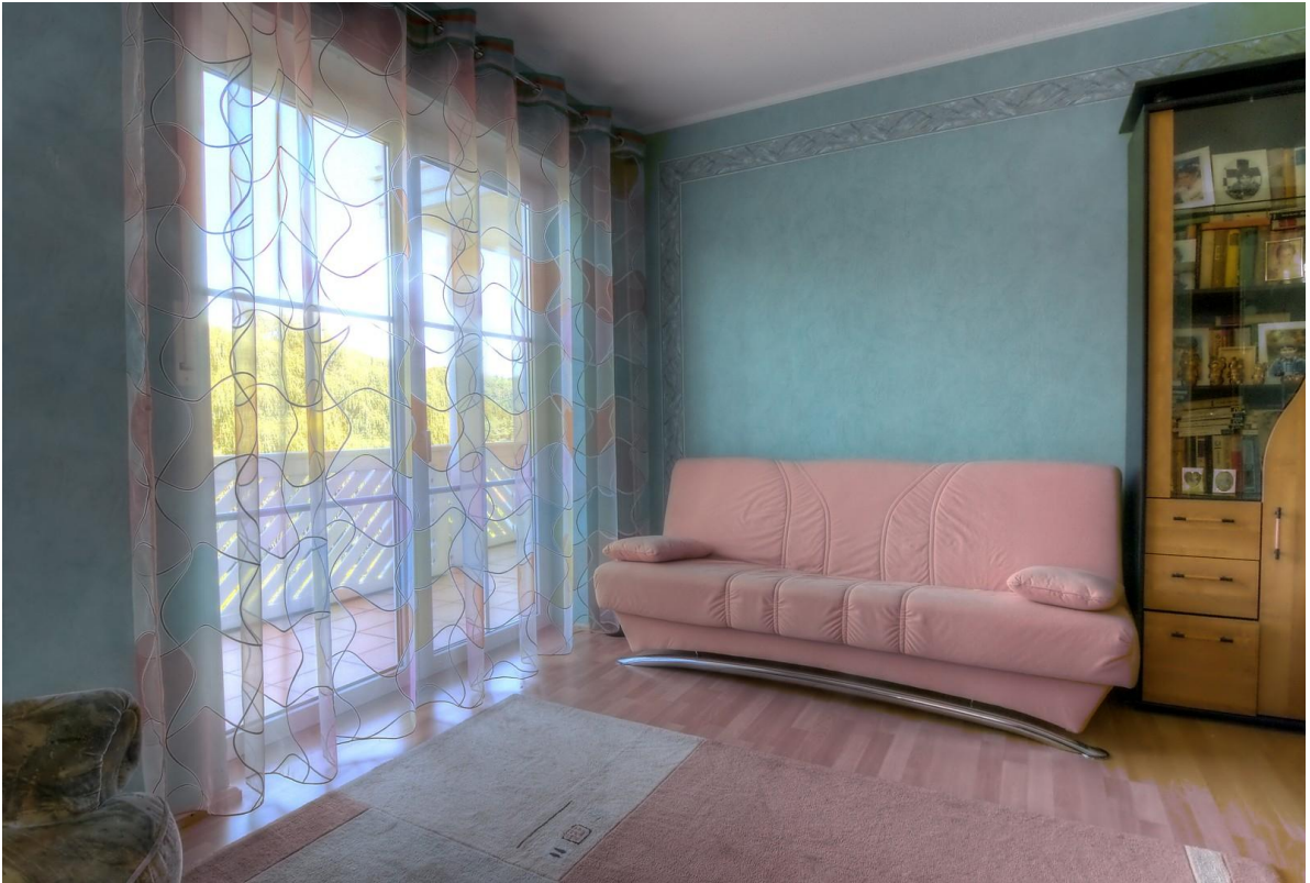
Kinderzimmer 1, EG