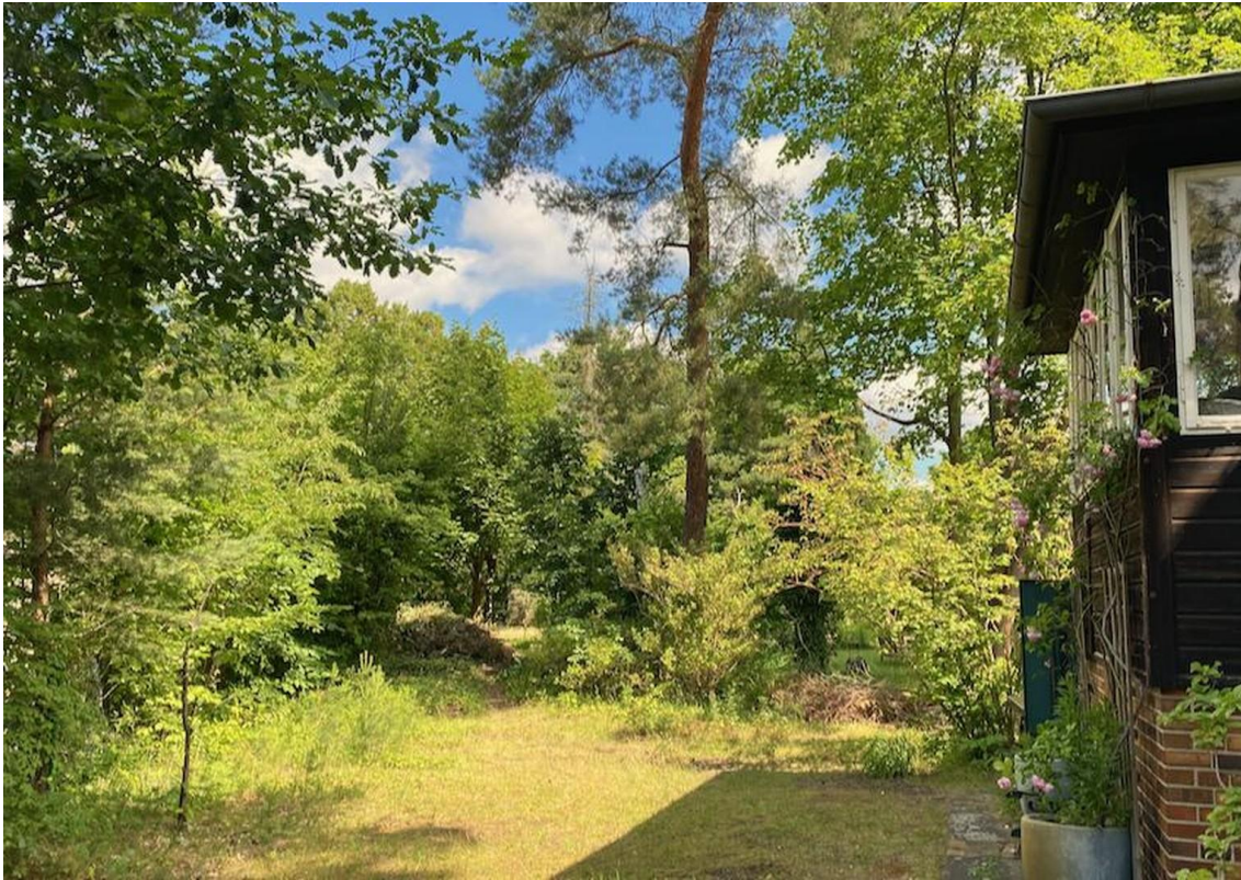
Zugang zum Grundstück