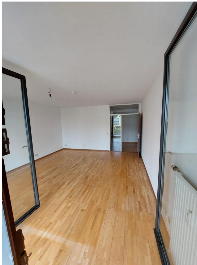
Wohnzimmer, in die Wohnung