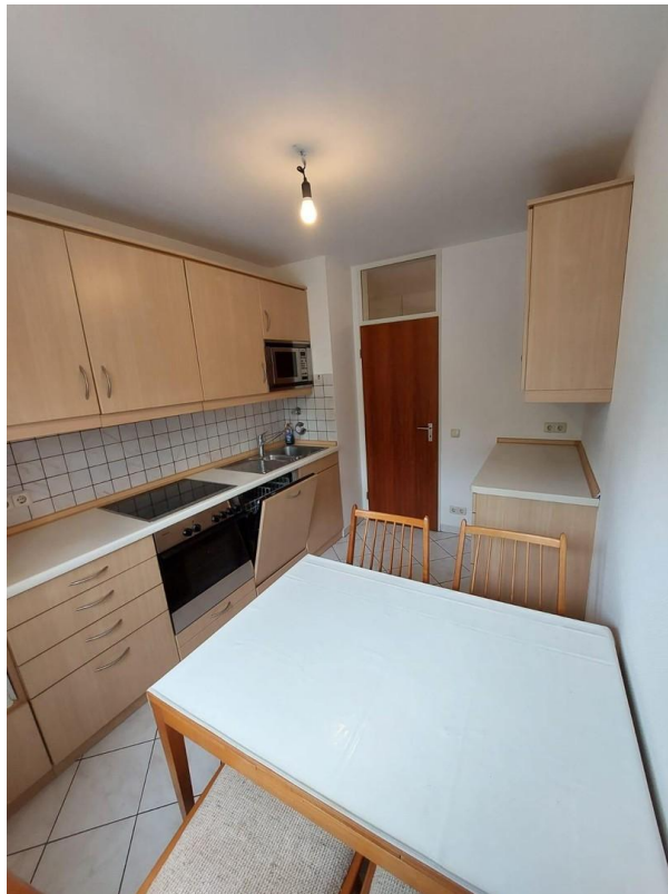
Küche, in die Wohnung