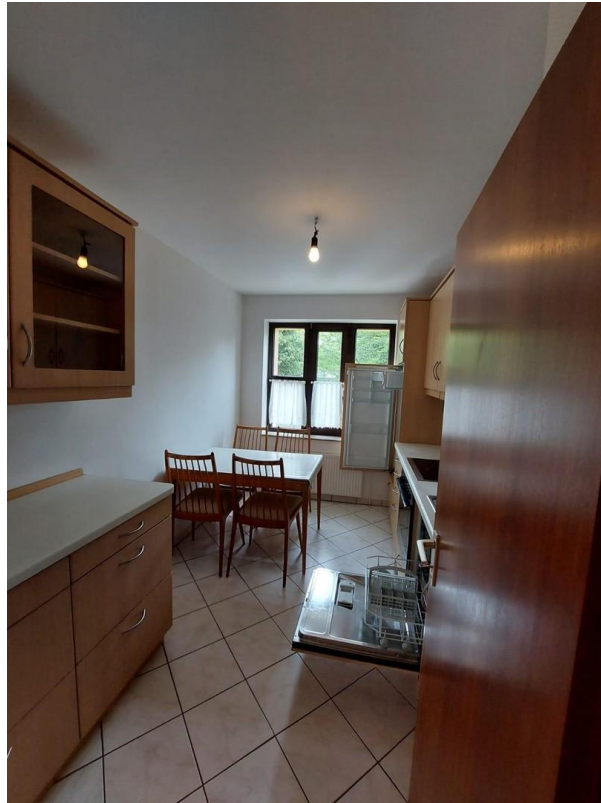
Küche, nach draußen