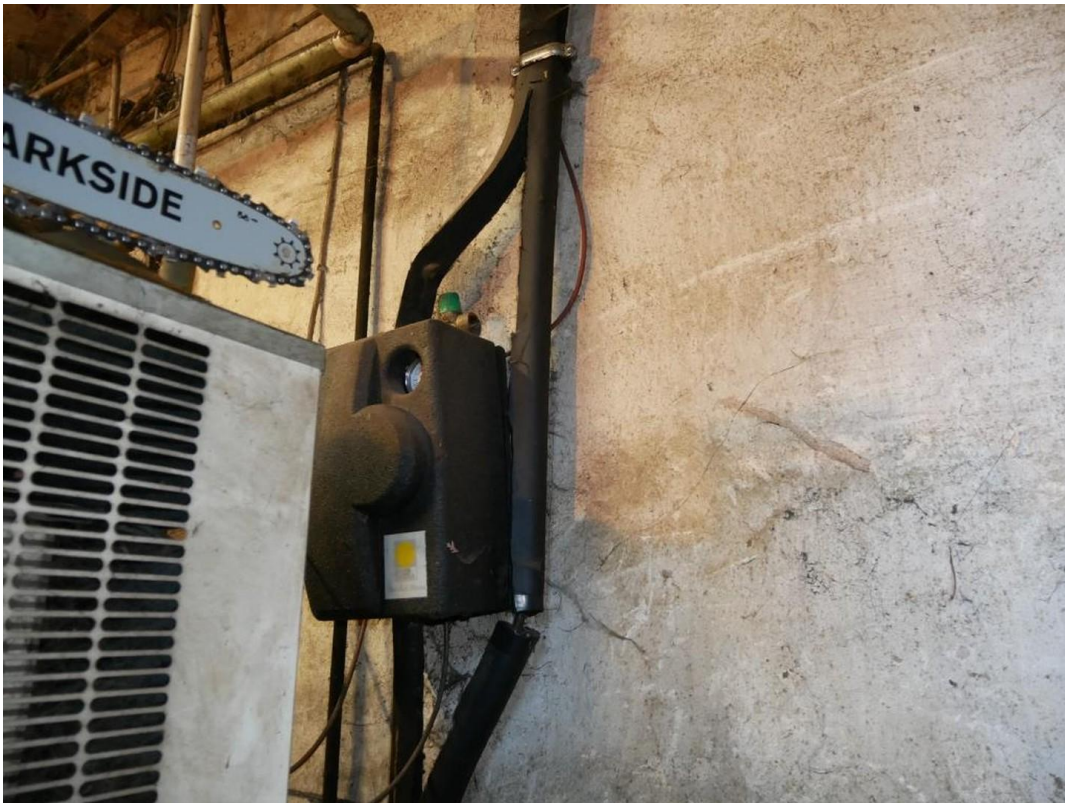
Pumpe/Steuerung Solar Thermie