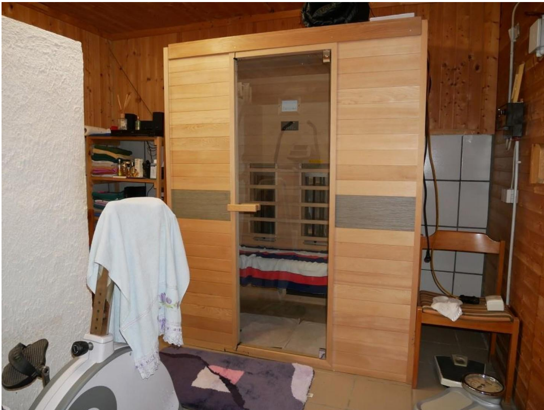
Saunaraum mit Dusche