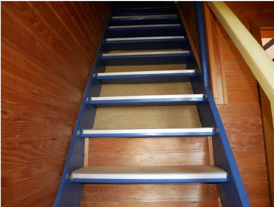
Treppe zur 2.Etage