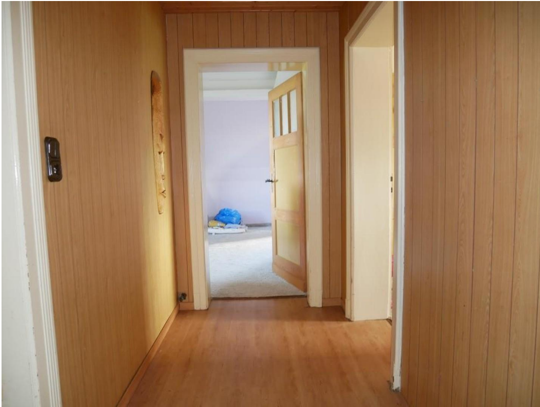
Wohnung 1.Etage rechts