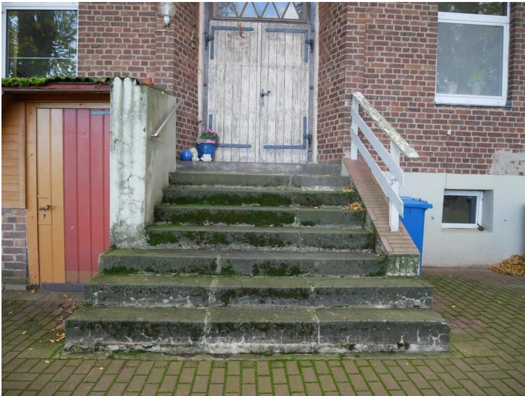
Schulwohnugseingang u. links