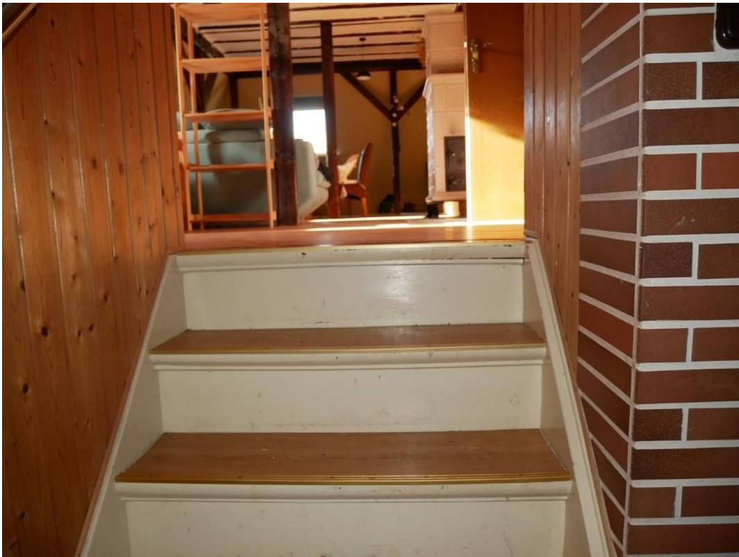
Wohnung oben linke 1.Etage