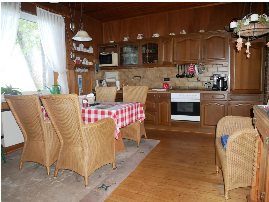
Wohnung unten rechts