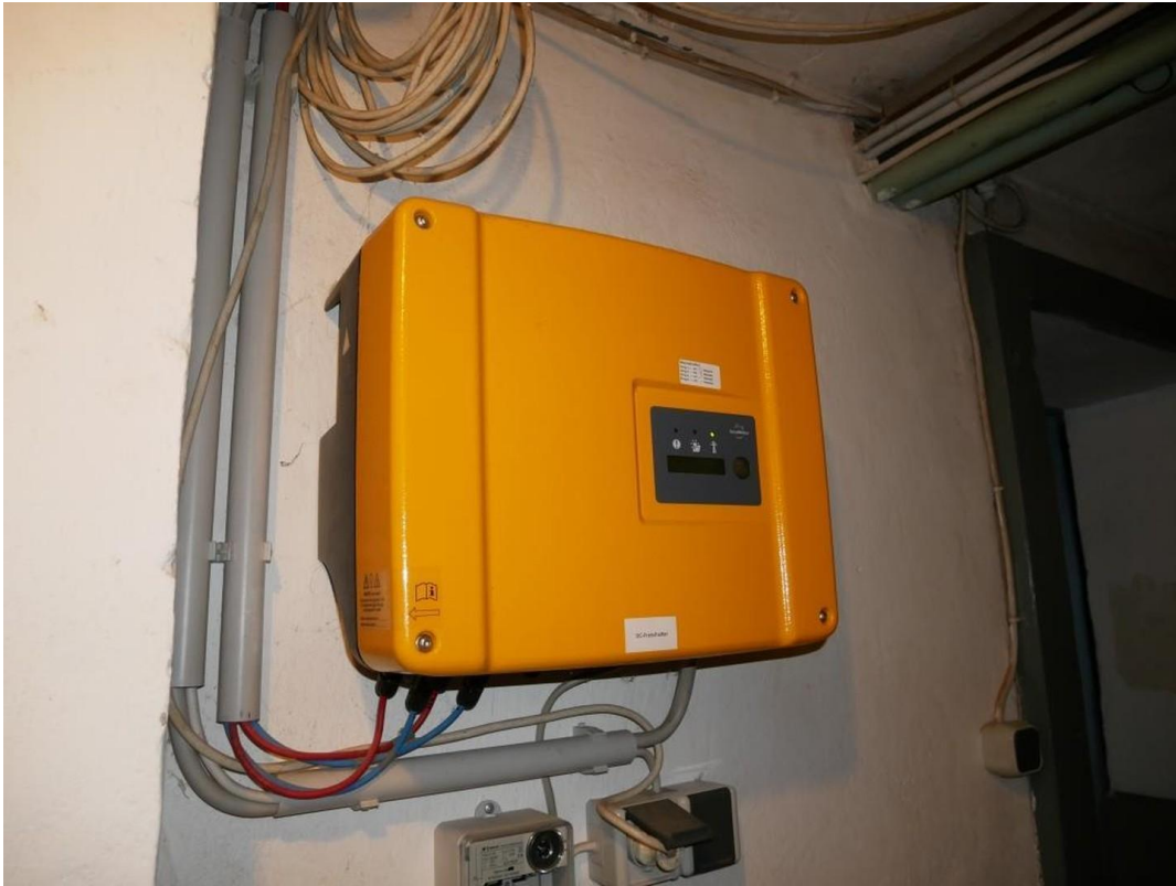
Wechselrichter für Solaranlage