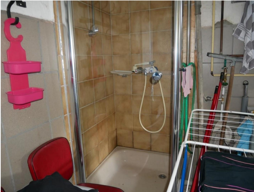
Dusche im Waschkeller