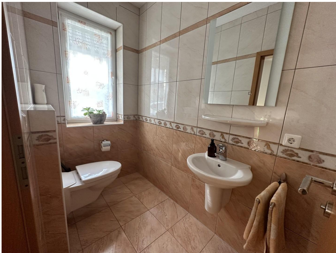
Gäste - WC