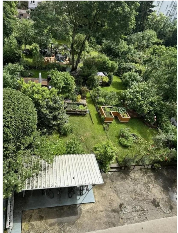
Garten mit Sondernutzungsrecht