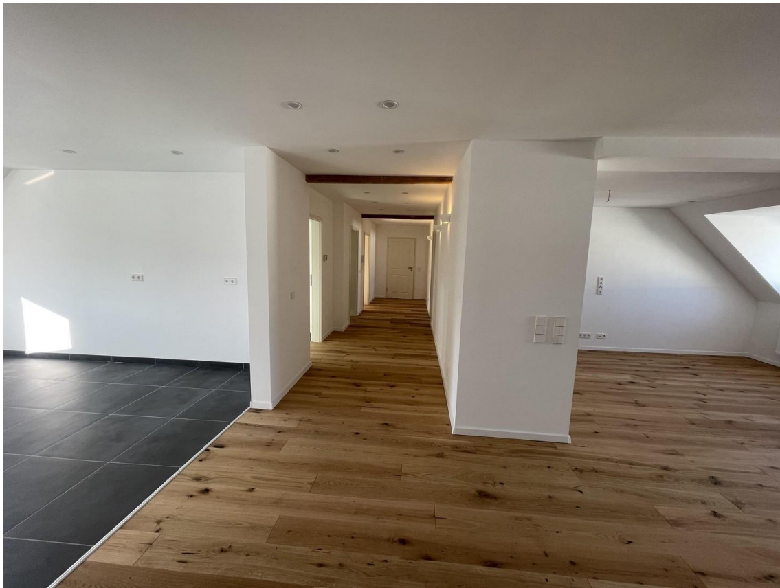
Blick in Flur/Wohnzimmer/Küche