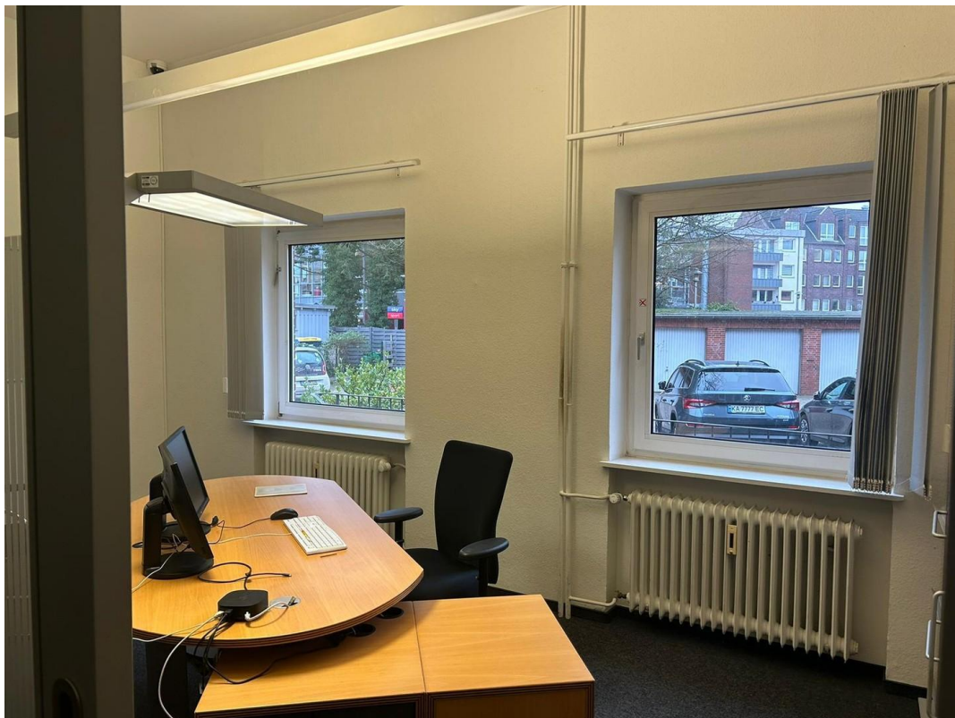
Geschäfts- oder Bürofläche