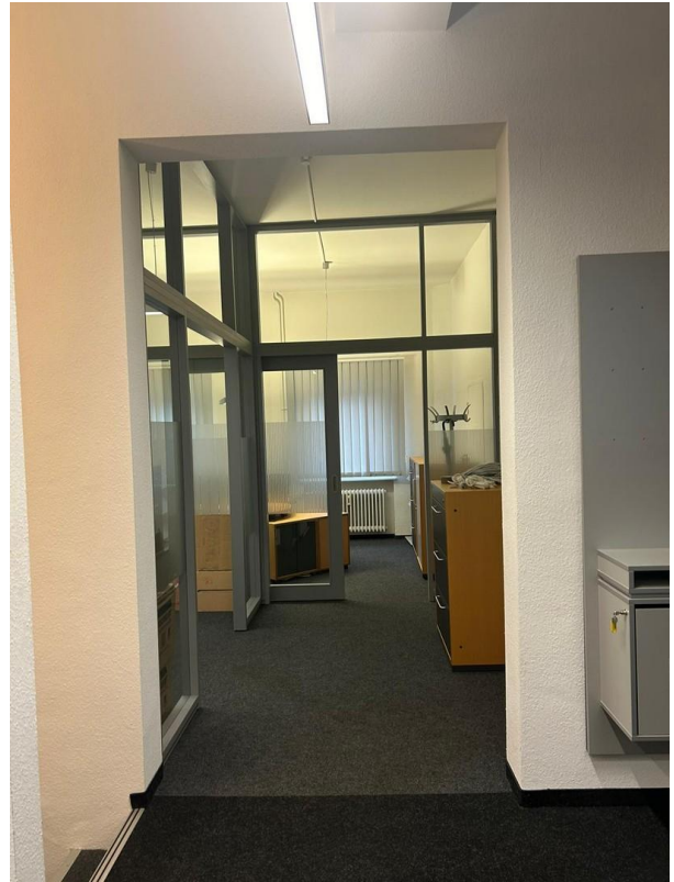
Geschäfts- oder Bürofläche