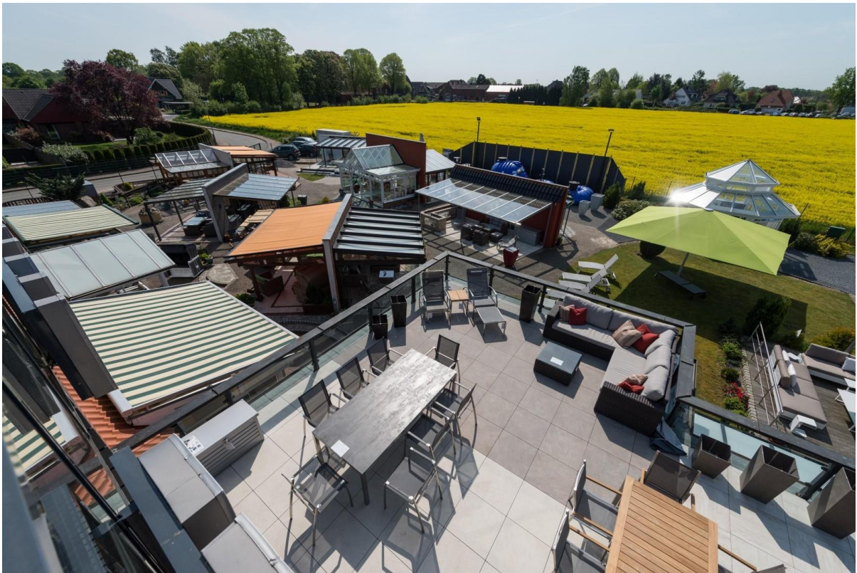
Blick auf die Dachterrasse