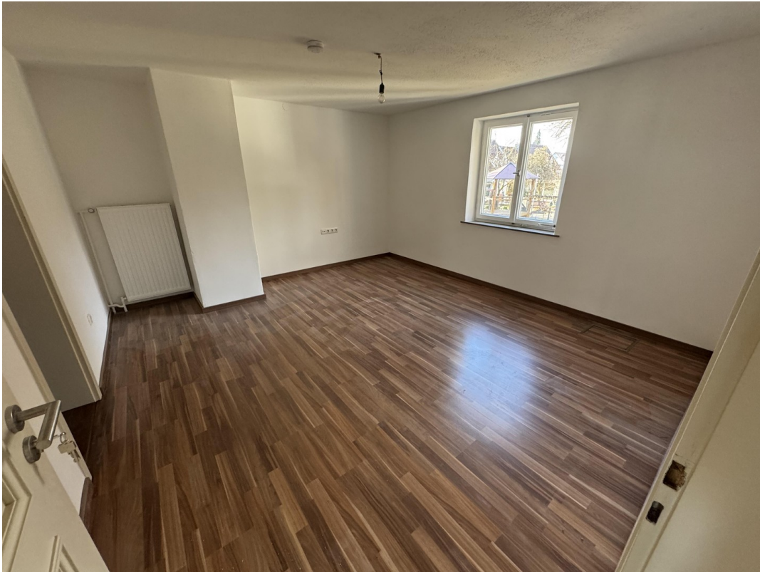
OG Zimmer 2