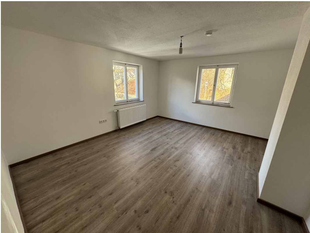
OG Zimmer 3