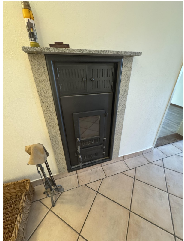
EG Diele - Kaminofen