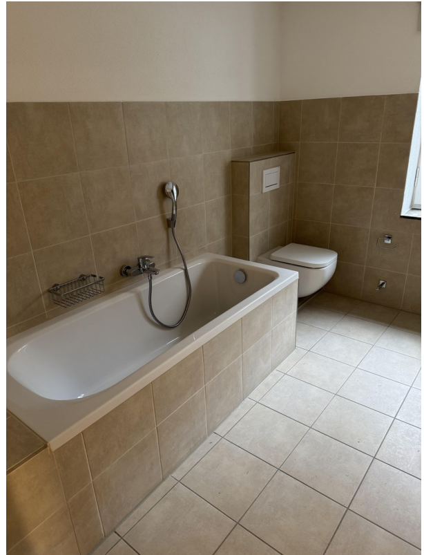
EG Bad Badewanne/WC