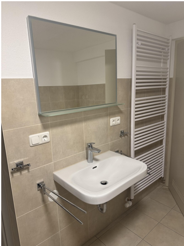
EG Bad Waschbecken