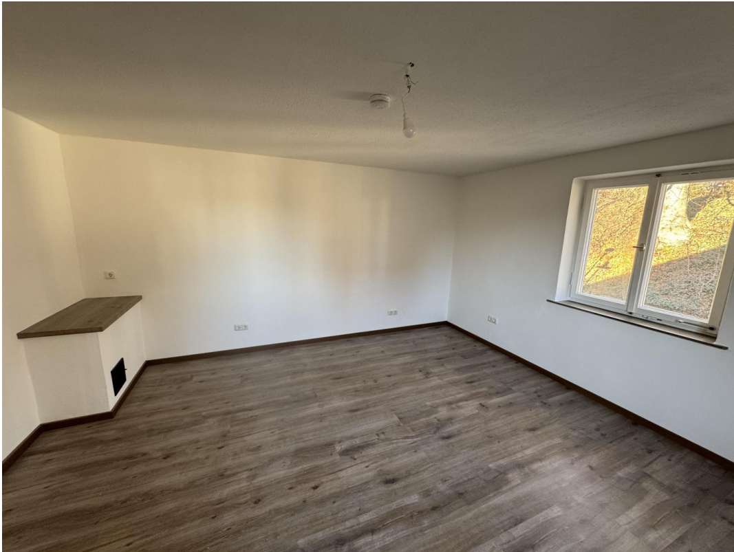
OG Zimmer 4