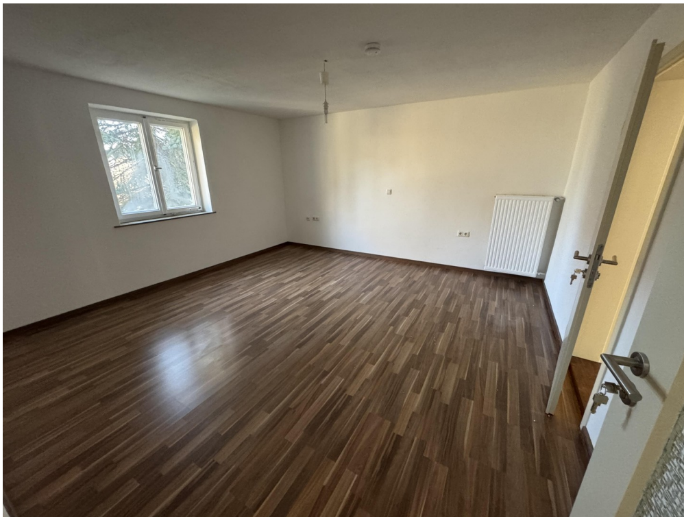
OG Zimmer 1