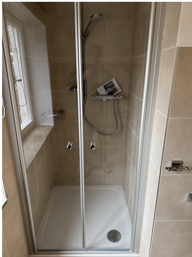
EG Bad Dusche