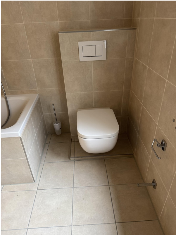
EG Bad WC