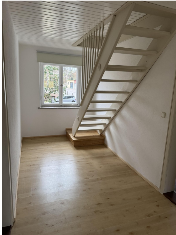
OG Treppe ins DG