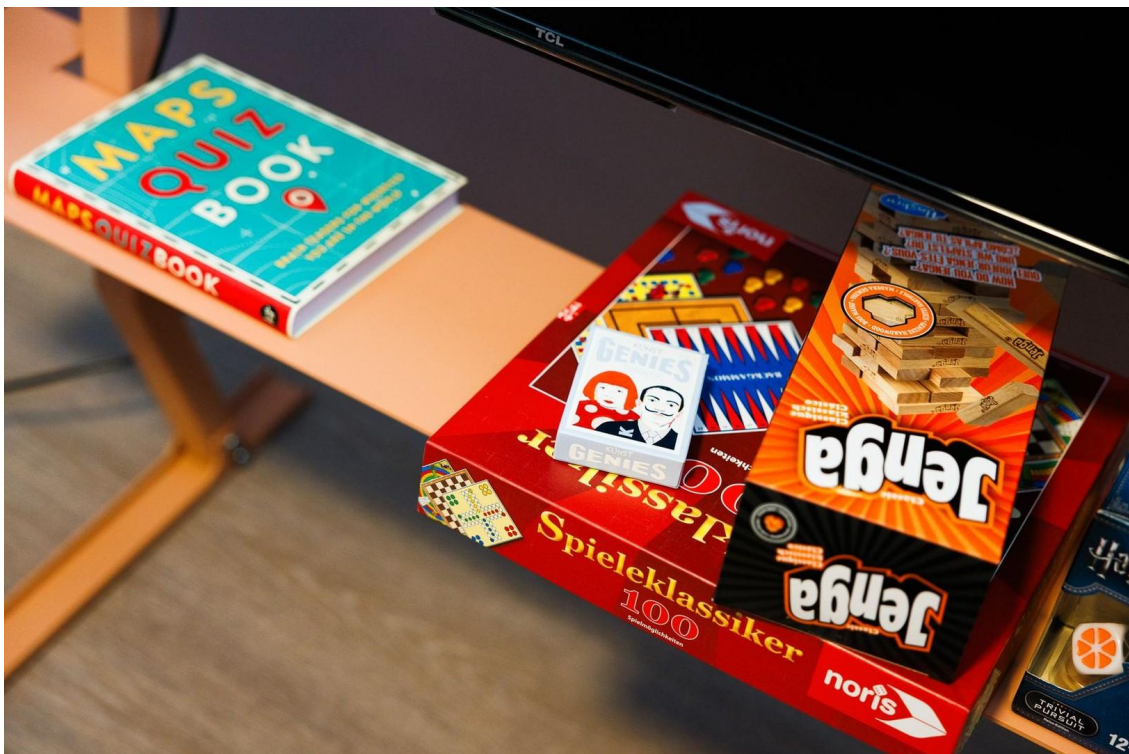
Games - Community Space