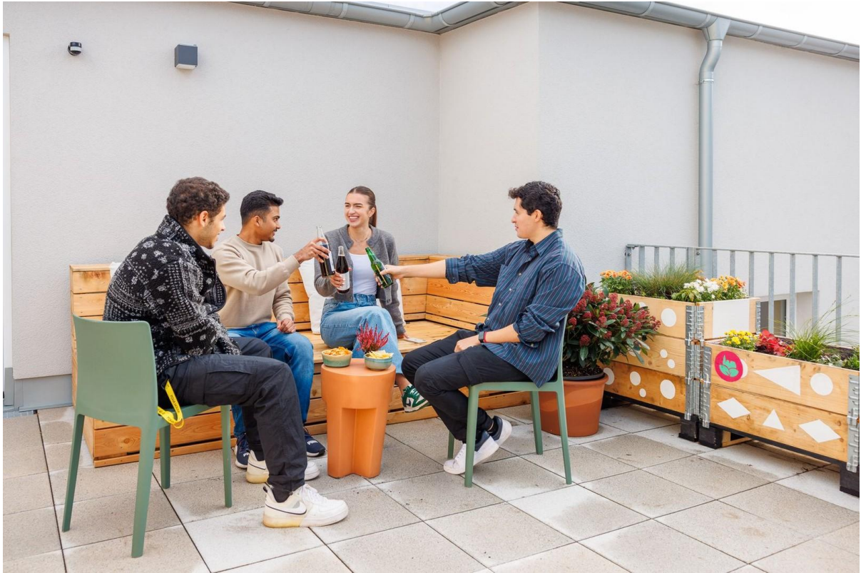
Rooftop - Community Space