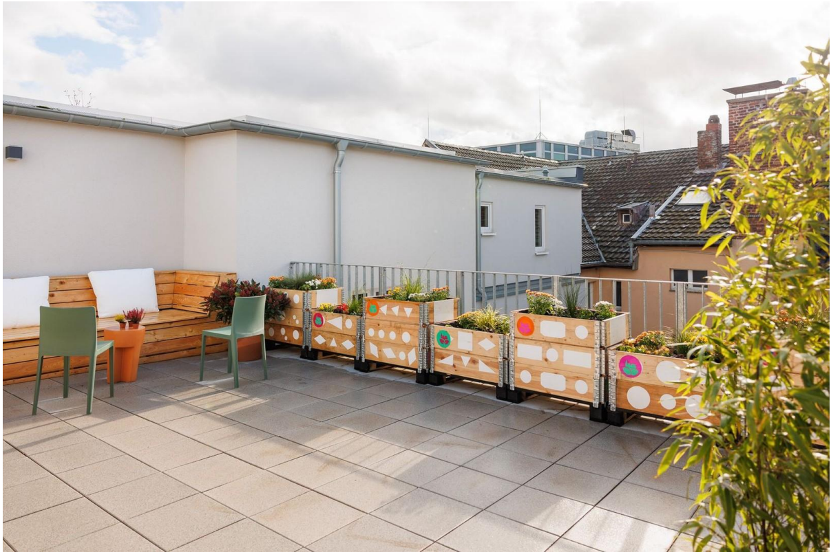
Rooftop - Community Space