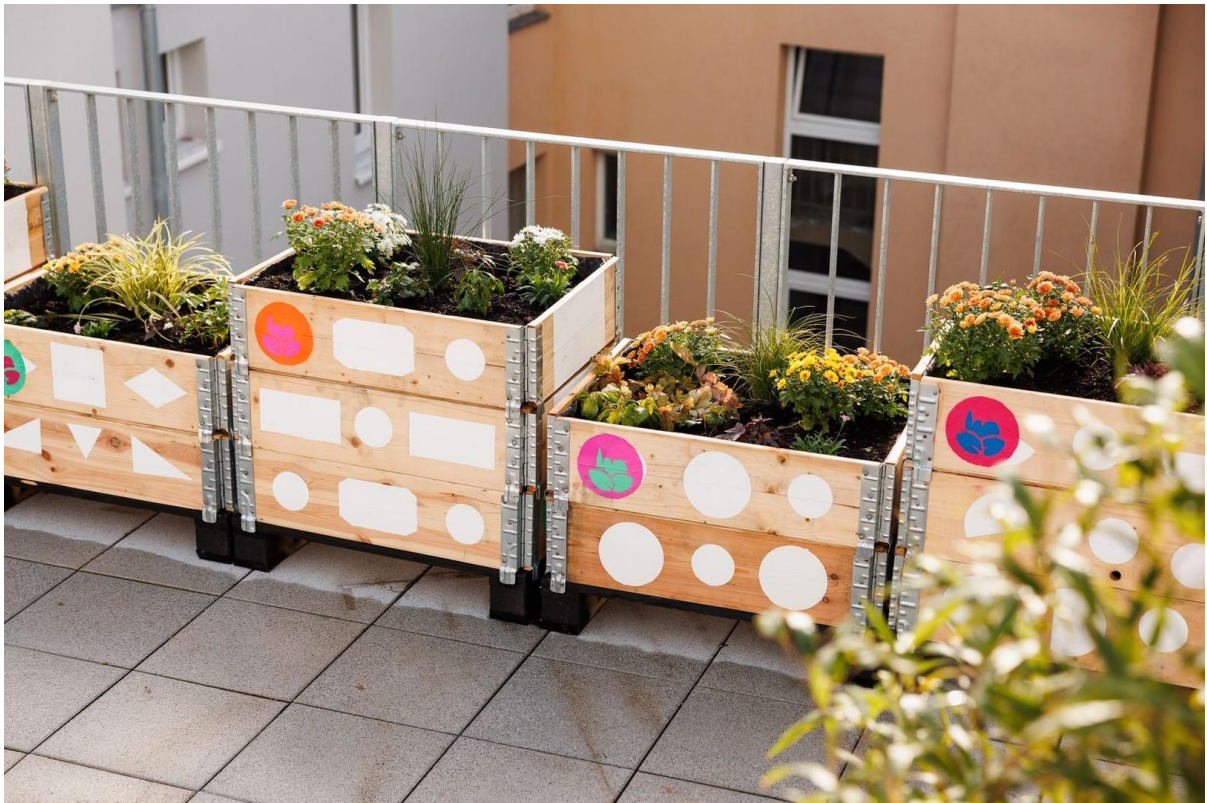
Rooftop - Community Space