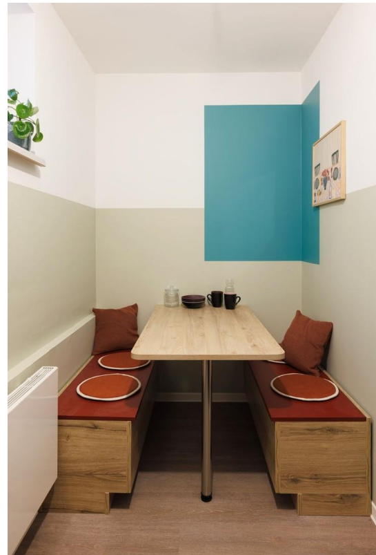
Tea Kitchen - Community Space