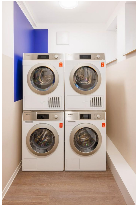
Laundry Room - Community Space