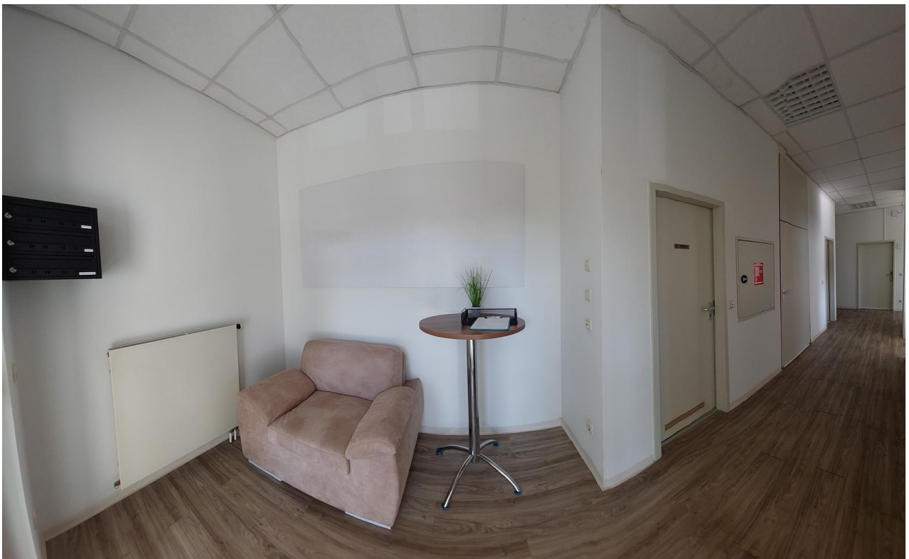
Eingangsbereich / Flur