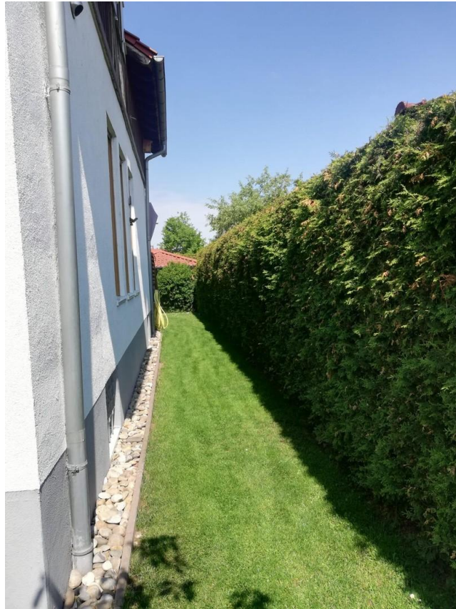
Zugang zum Garten