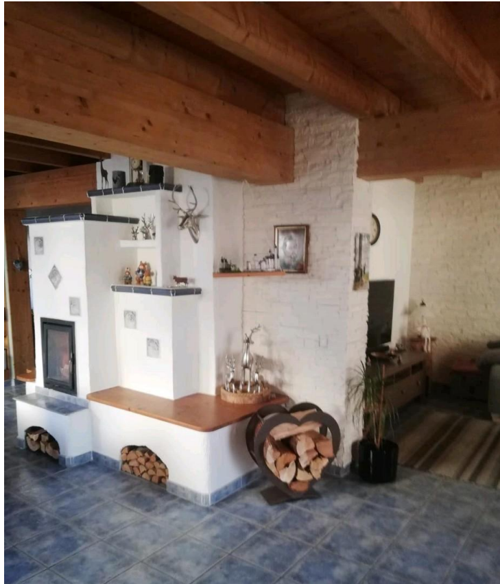
Wohn-/Esszimmer mit Kamin