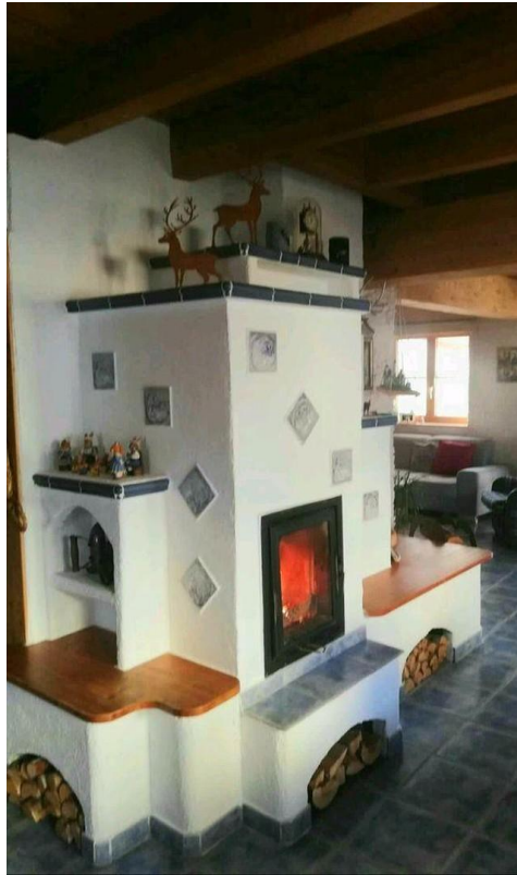
Wohn-/Esszimmer mit Kamin