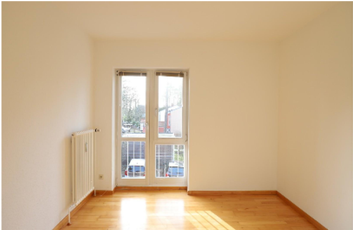
Schlafzimmer links vom Bad