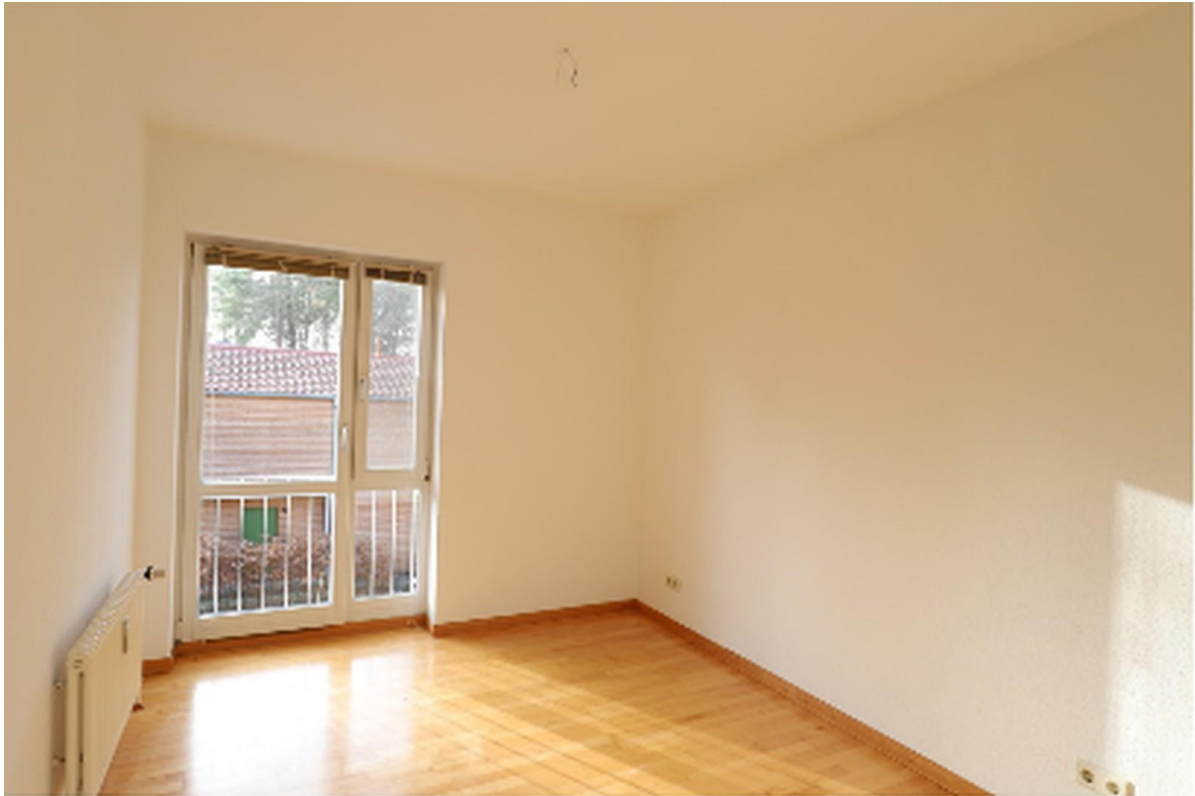
Schlafzimmer rechts vom Bad