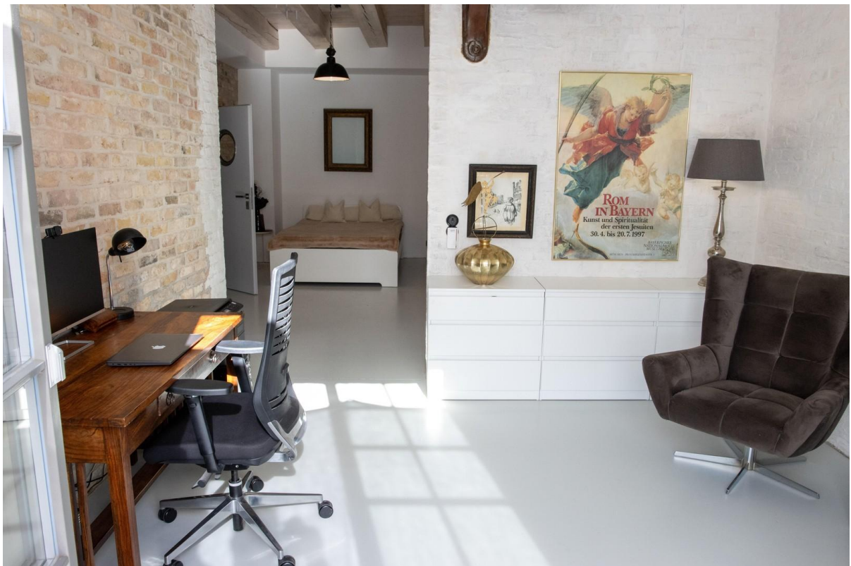
Wohnraum im EG