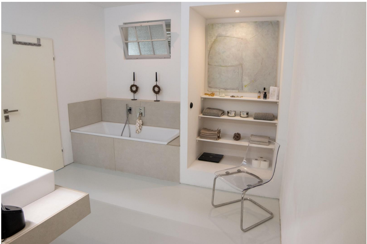
Masterbad im OG