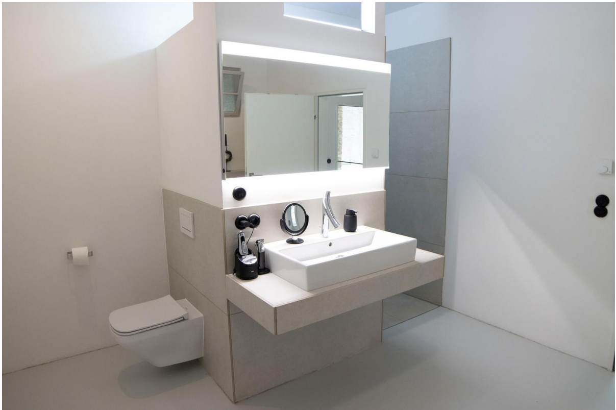
Masterbad im OG