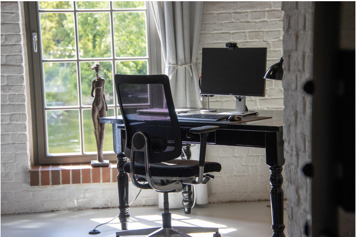
Büro im OG