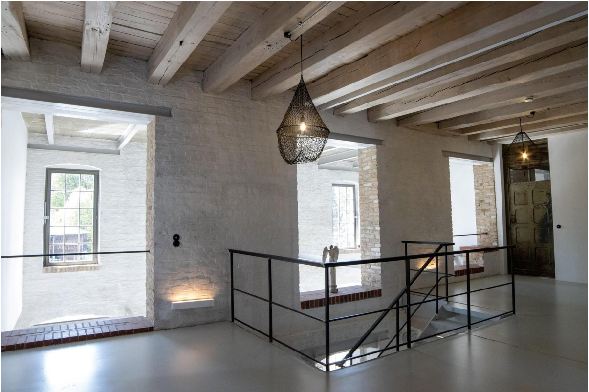
Galerie im OG