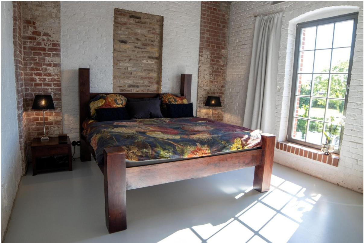
Schlafzimmer im OG