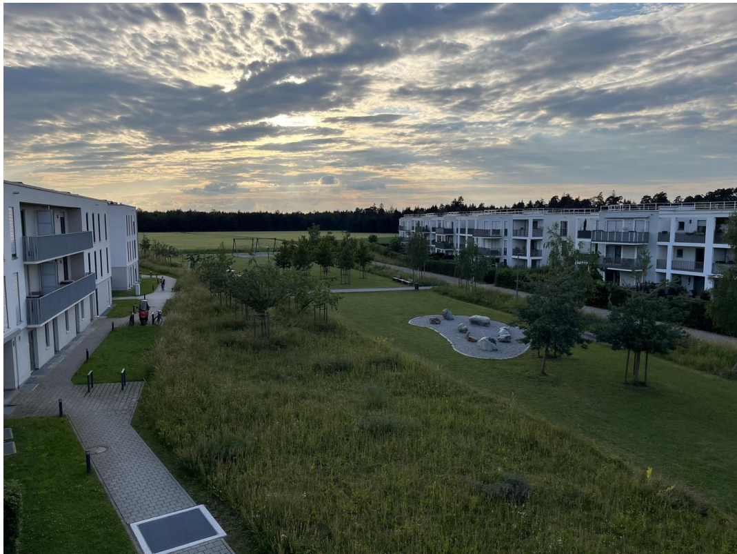
Blick aus dem Fenster