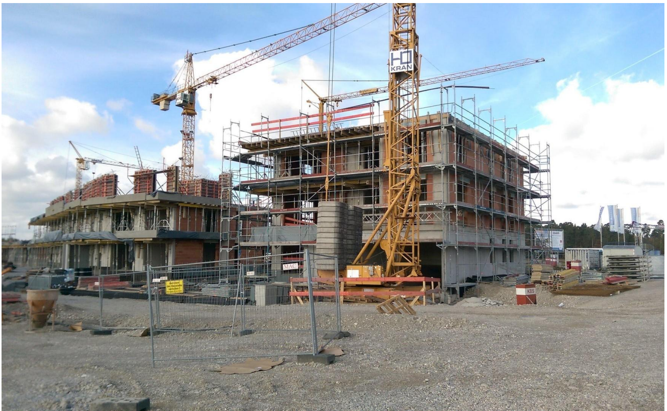
Rohbau 2017 - Ziegelbauweise