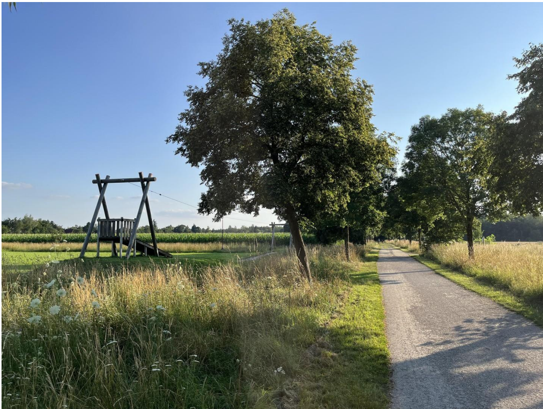
Weg ums Haus mit Seilbahn