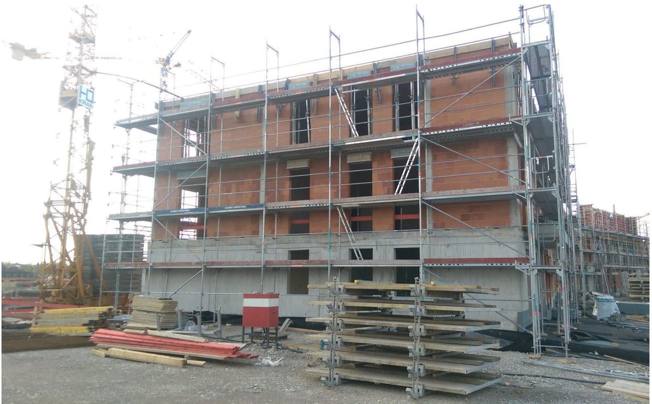
Rohbau 2017 - Ziegelbauweise