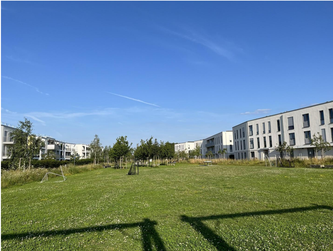
Wiese vor der Haustüre