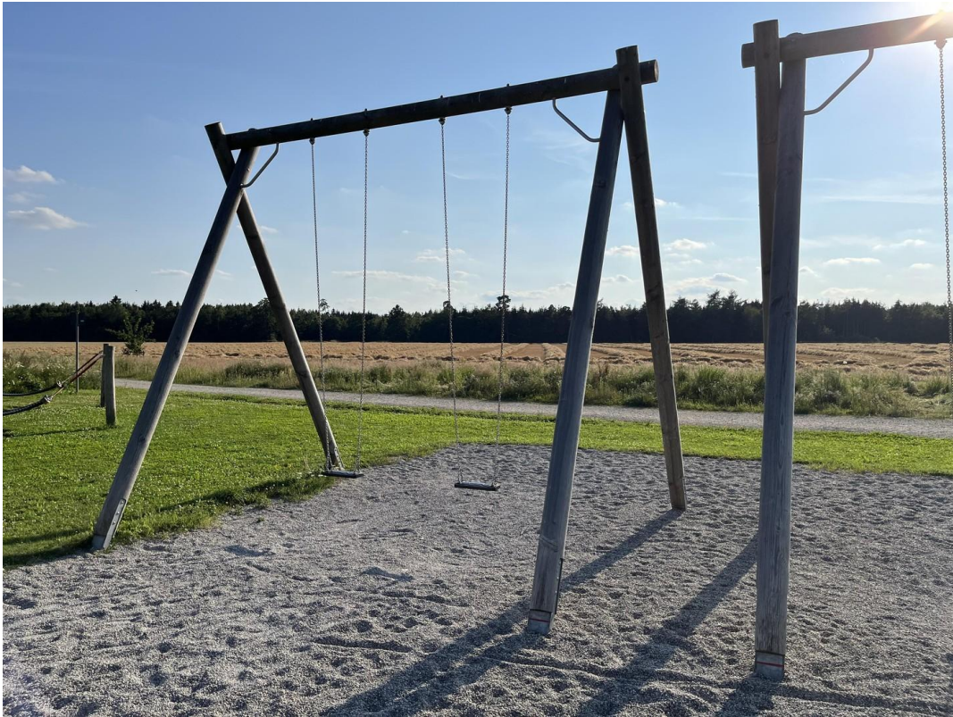
4 x Riesenschaukeln