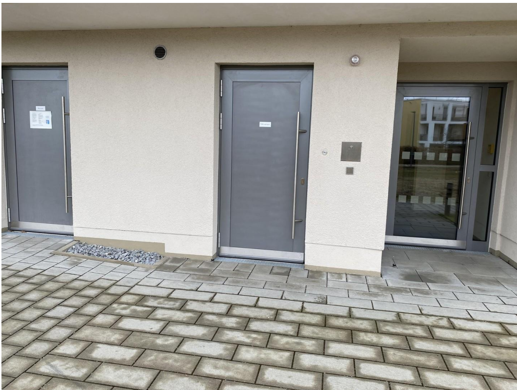
Müllraum und Fahrradkeller