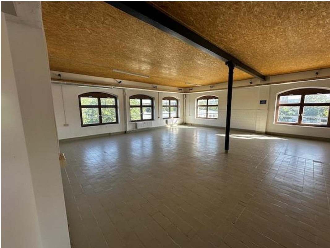
Büro oder Lager