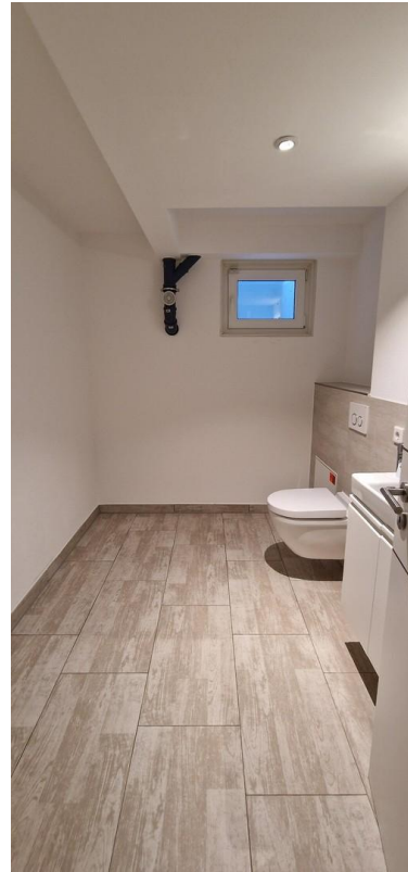
Gäste WC im UG