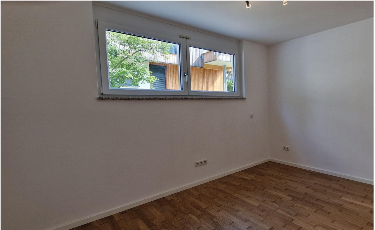
1. Schlafzimmer EG L