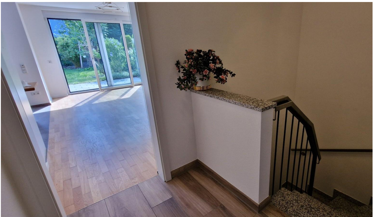
Flur Treppe EG