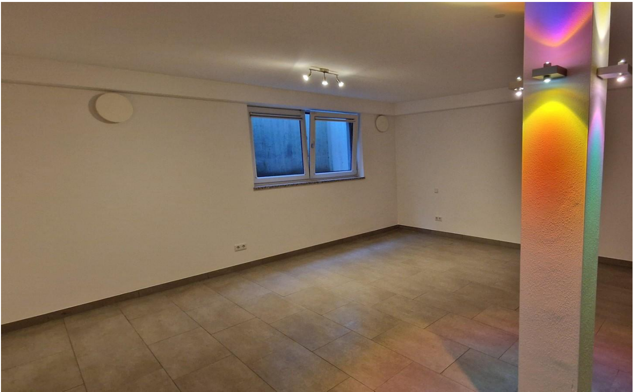
Wohnraum UG L