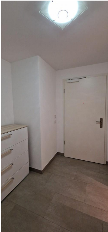
2. Wohnungseingang UG