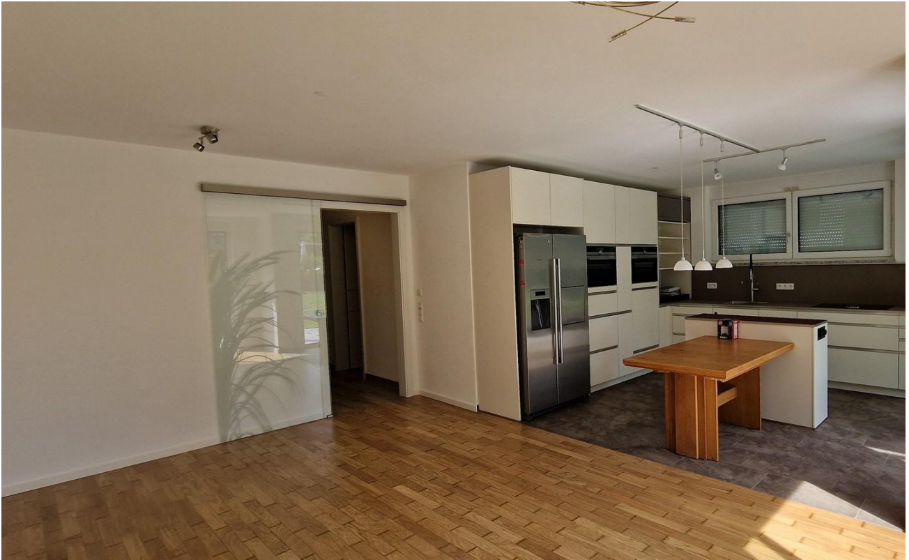
Wohnraum mit Küche