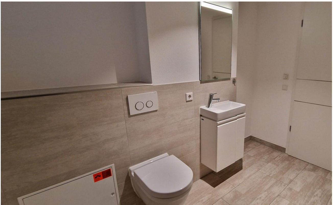
Gäste WC im UG