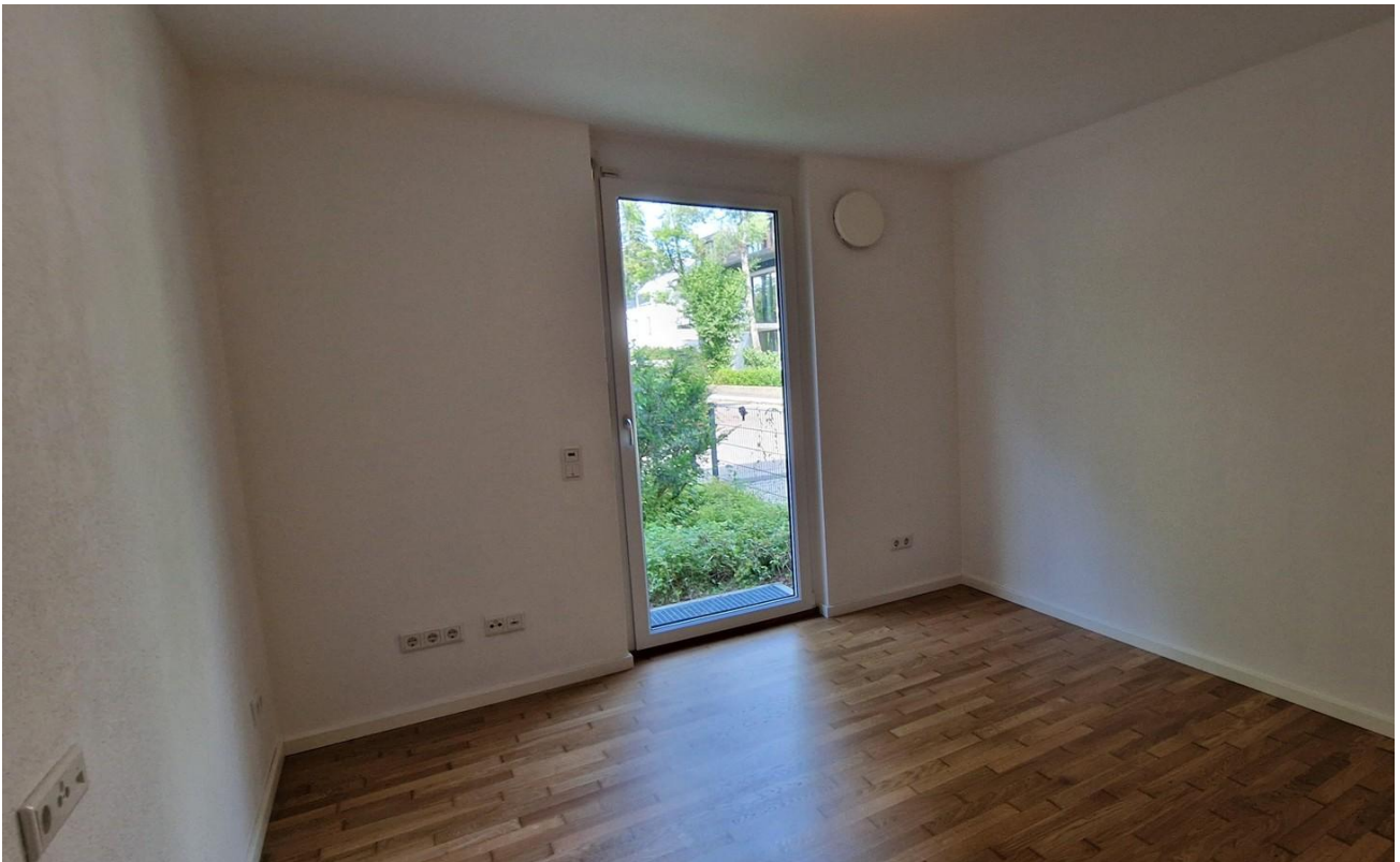
2. Schlafzimmer EG L