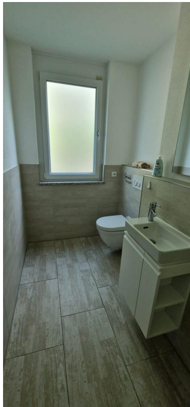
Gäste WC im EG