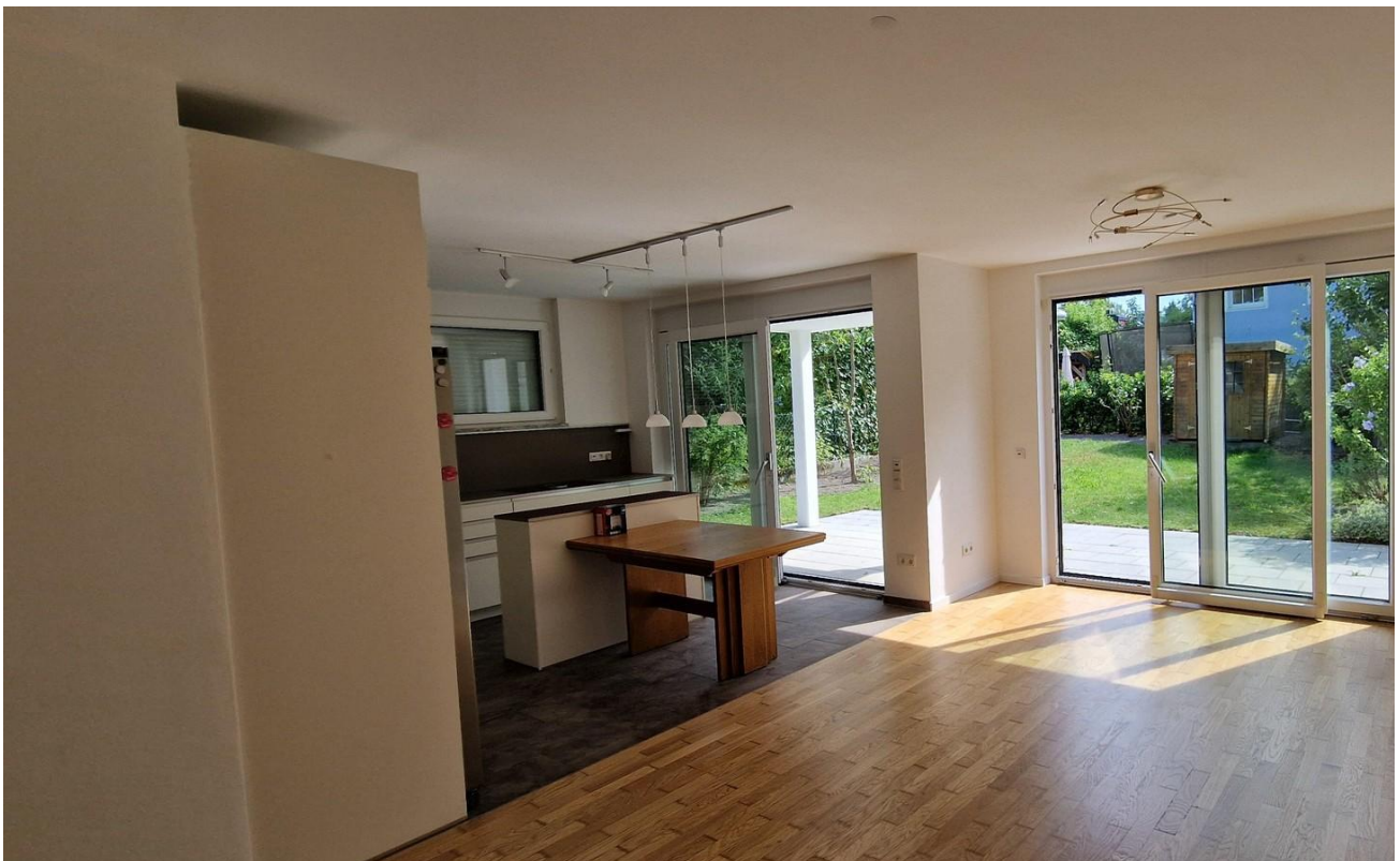
heller Wohnraum S