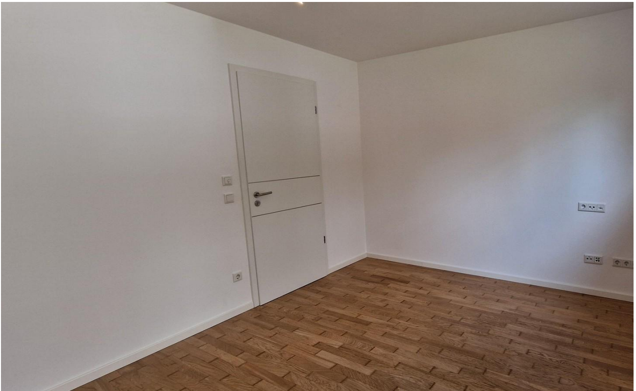
1. Schlafzimmer EG R