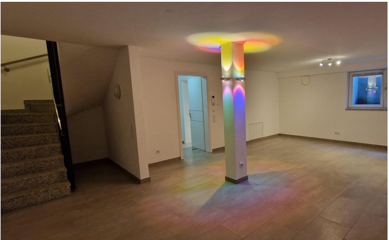
Wohnraum UG R