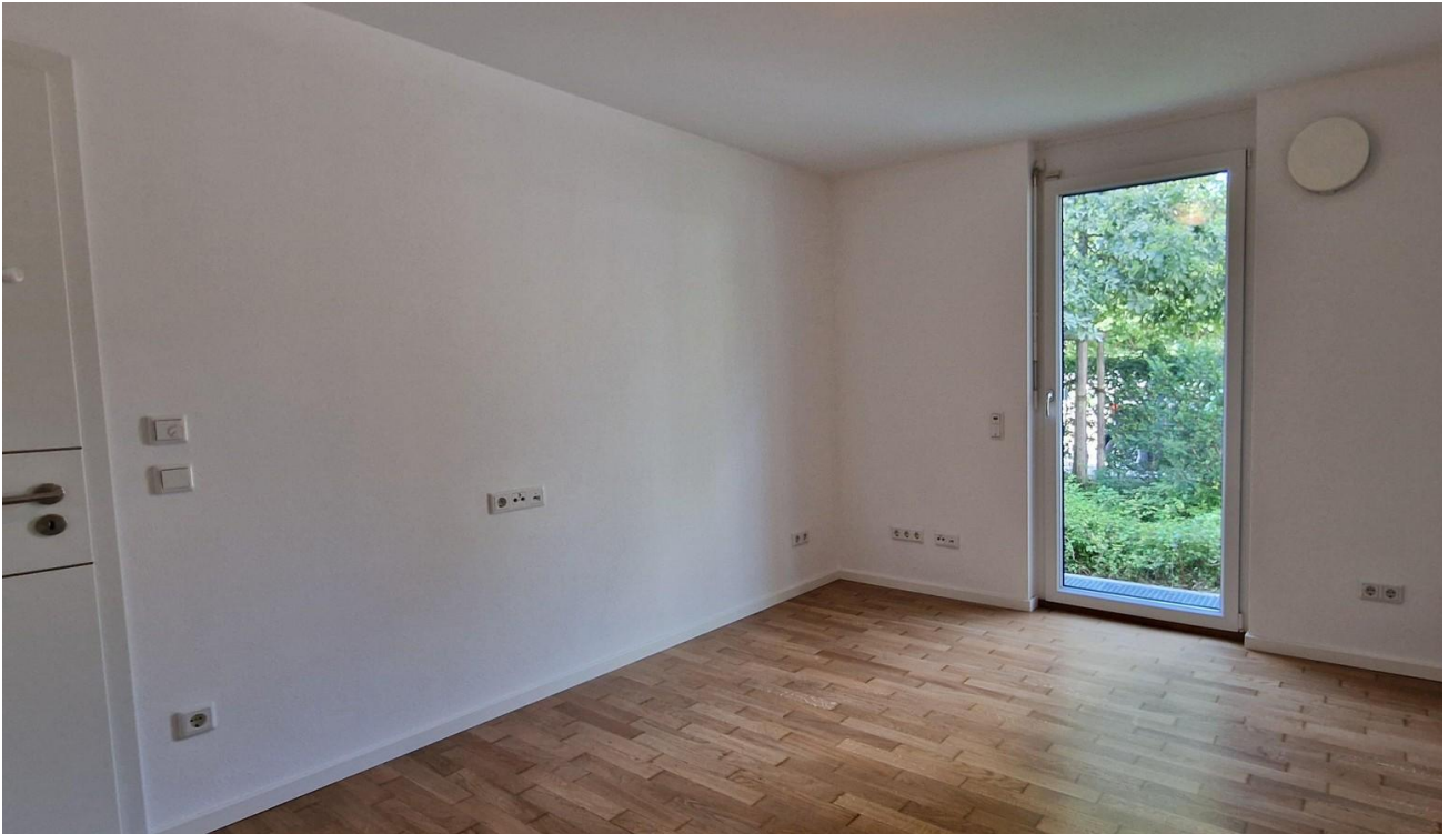
2. Schlafzimmer EG R