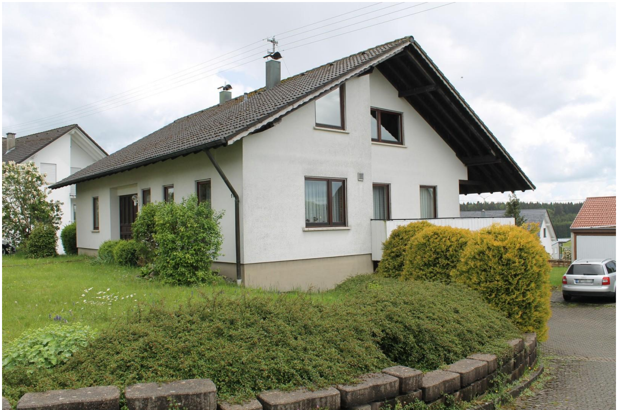
Hauseingang und Garageneinfahr