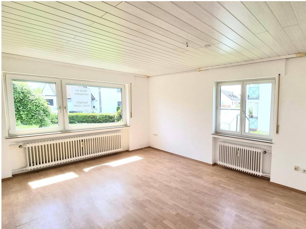
Freie EG Wohnung