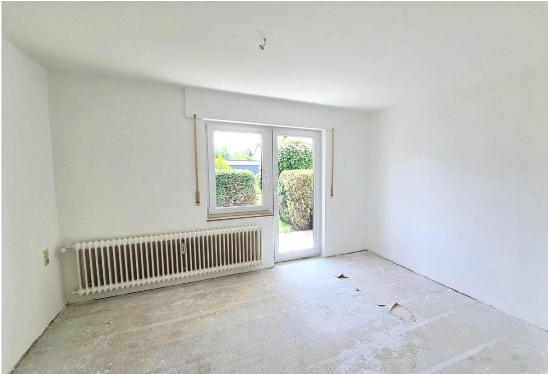
Freie EG Wohnung