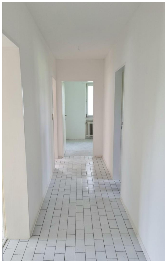
Freie EG Wohnung