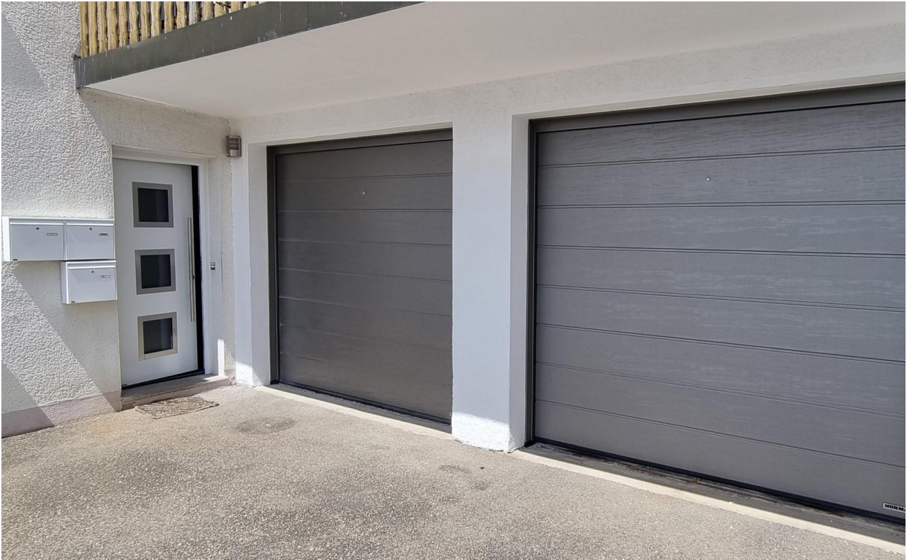
Haustüre und Garagentore