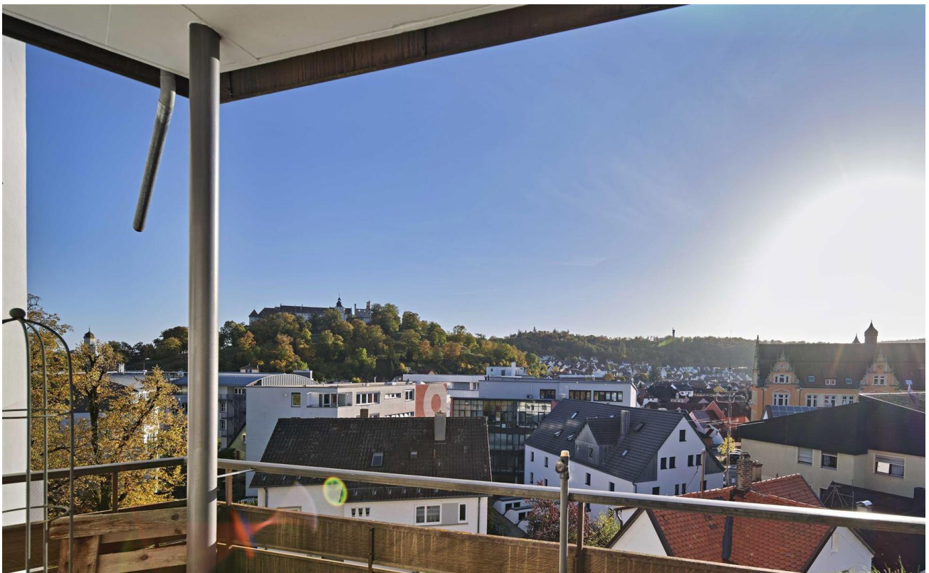
großer Balkon mit Schlossblick