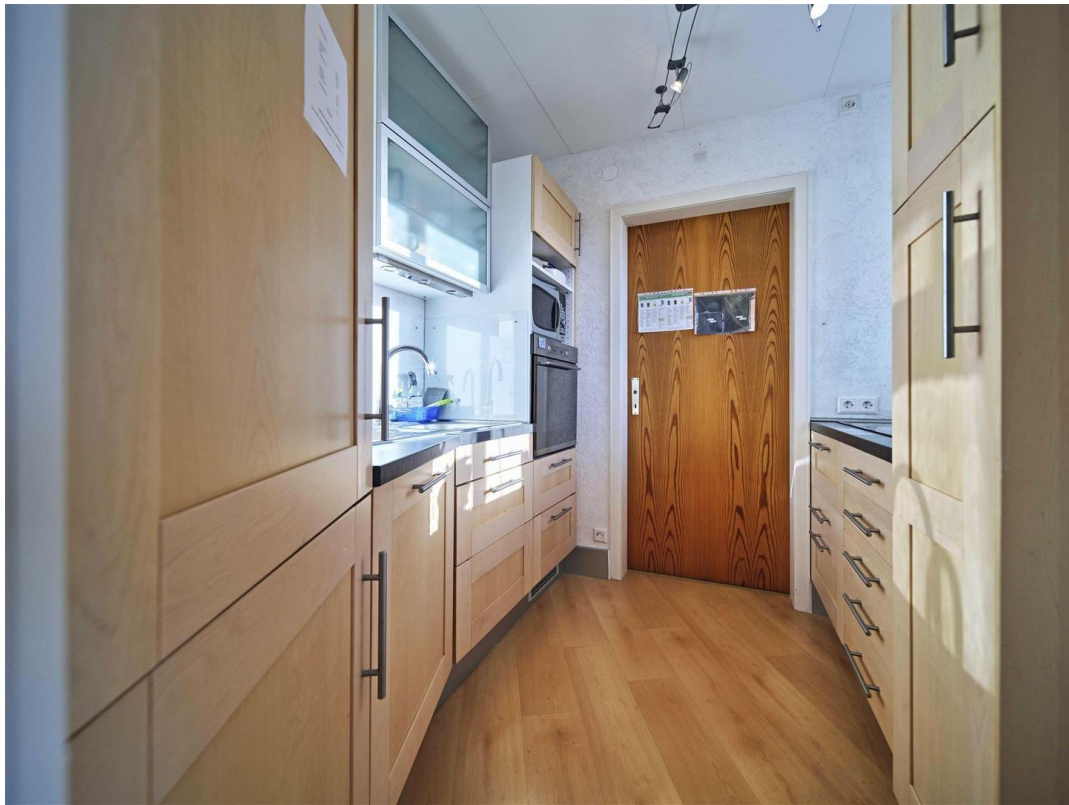
voll ausgestattete Einbauküche