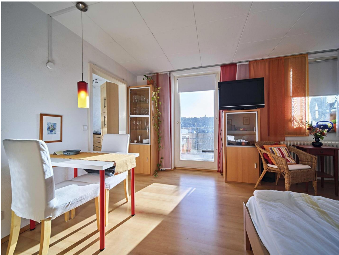
geräumiges Wohn- & Schlafzimmer