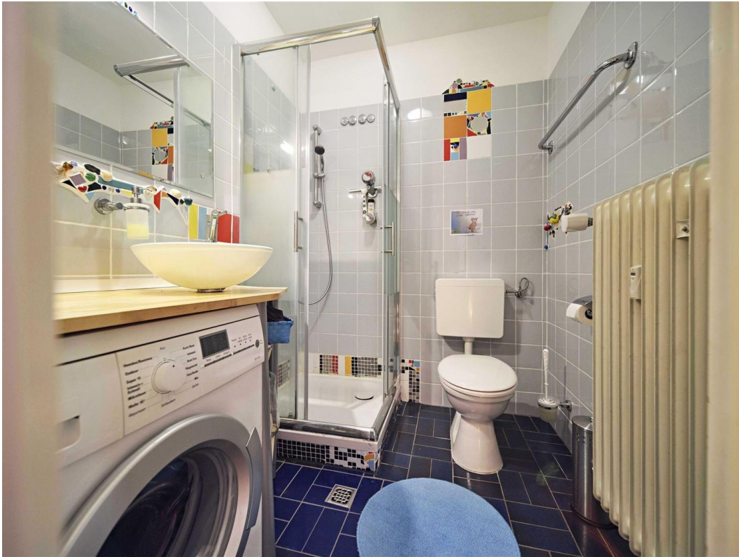
Bad inkl. Waschmaschine