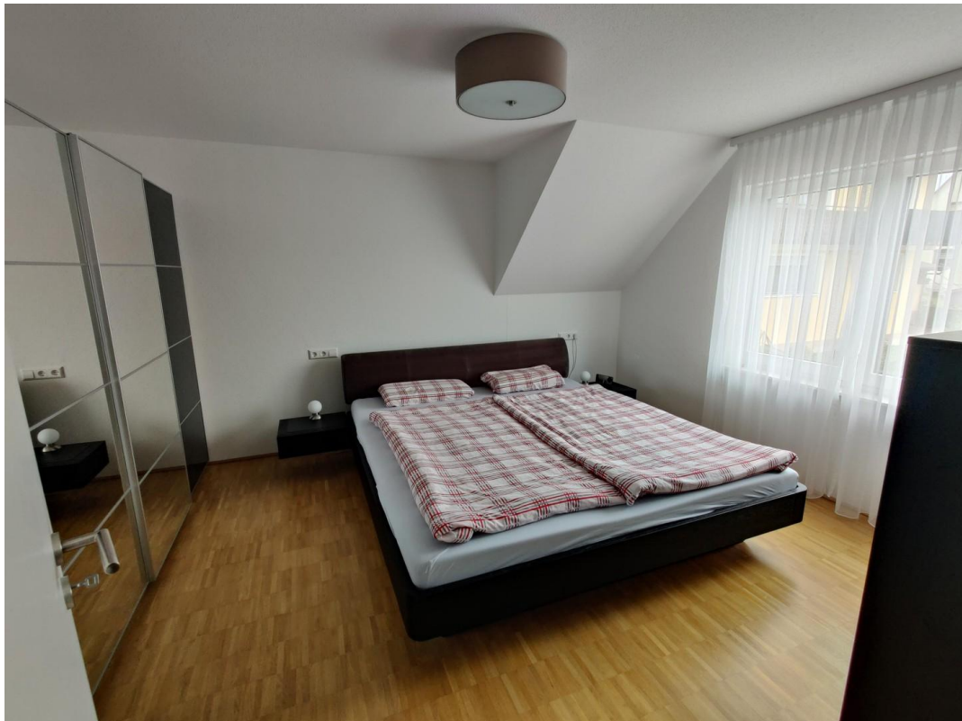
1. OG Schlafzimmer