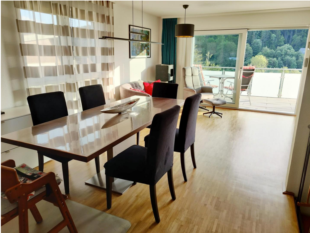
EG Esszimmer mit Balkon