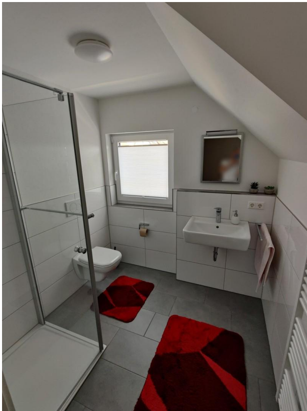
2. OG Bad