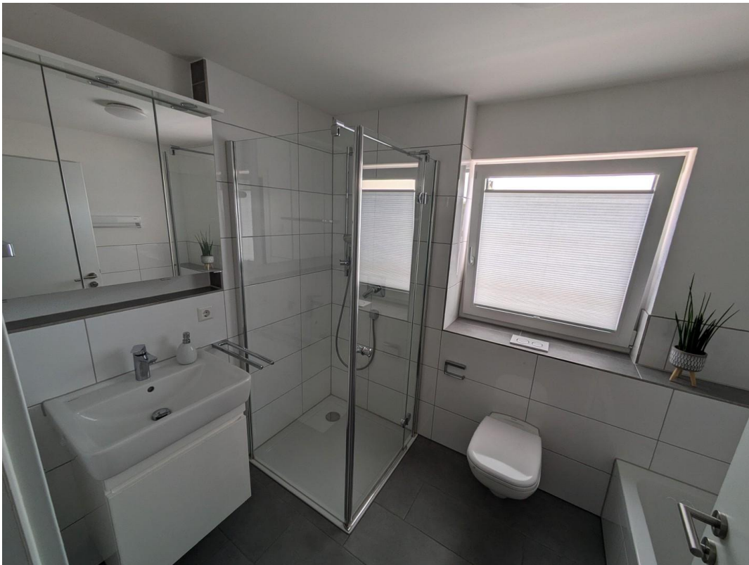
1. OG Bad mit Wanne und Dusche