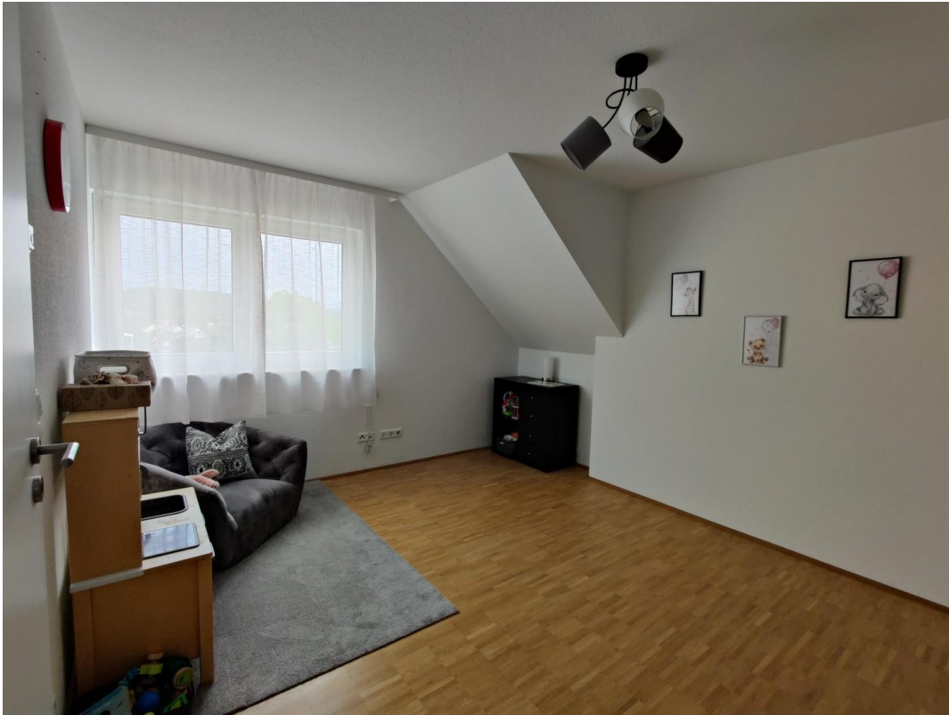
1. OG Raum "Kind 1"