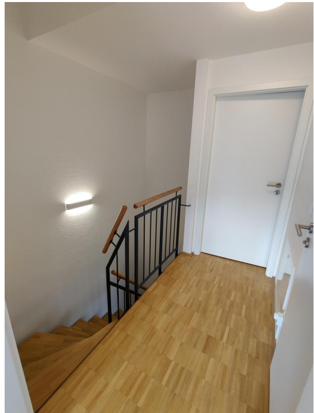
2. OG Flur