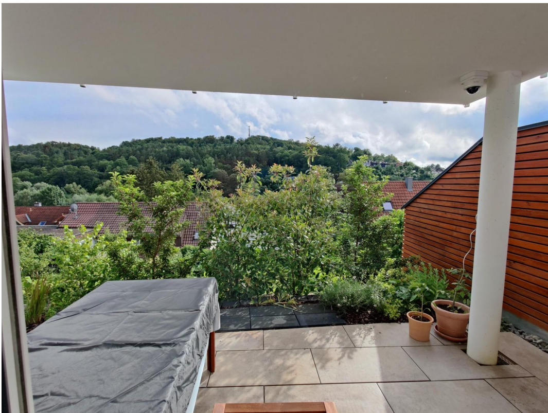
UG Terrasse mit Ausblick