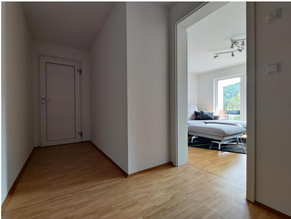
UG Flur Zugang Abstellraum