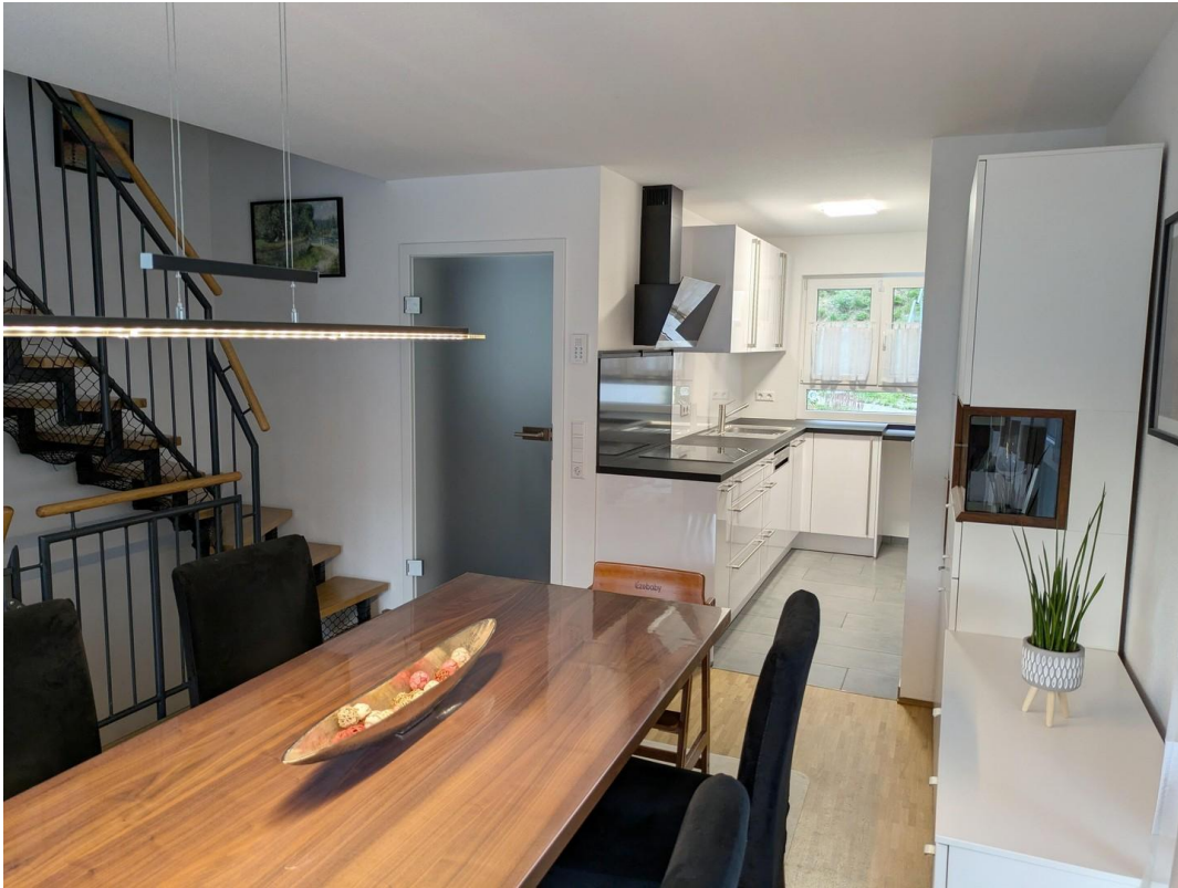
EG Esszimmer mit Küche