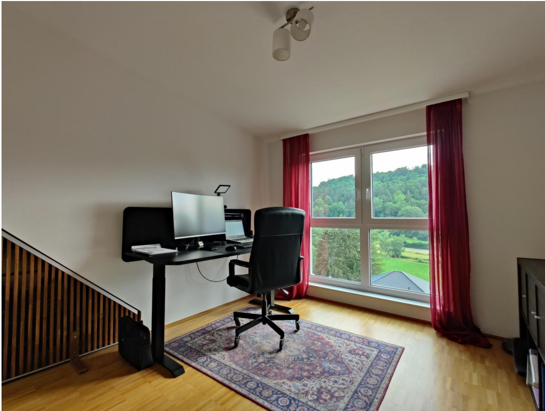
2. OG Raum "Kind 3"