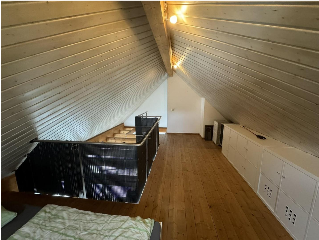
Die Galerie ...