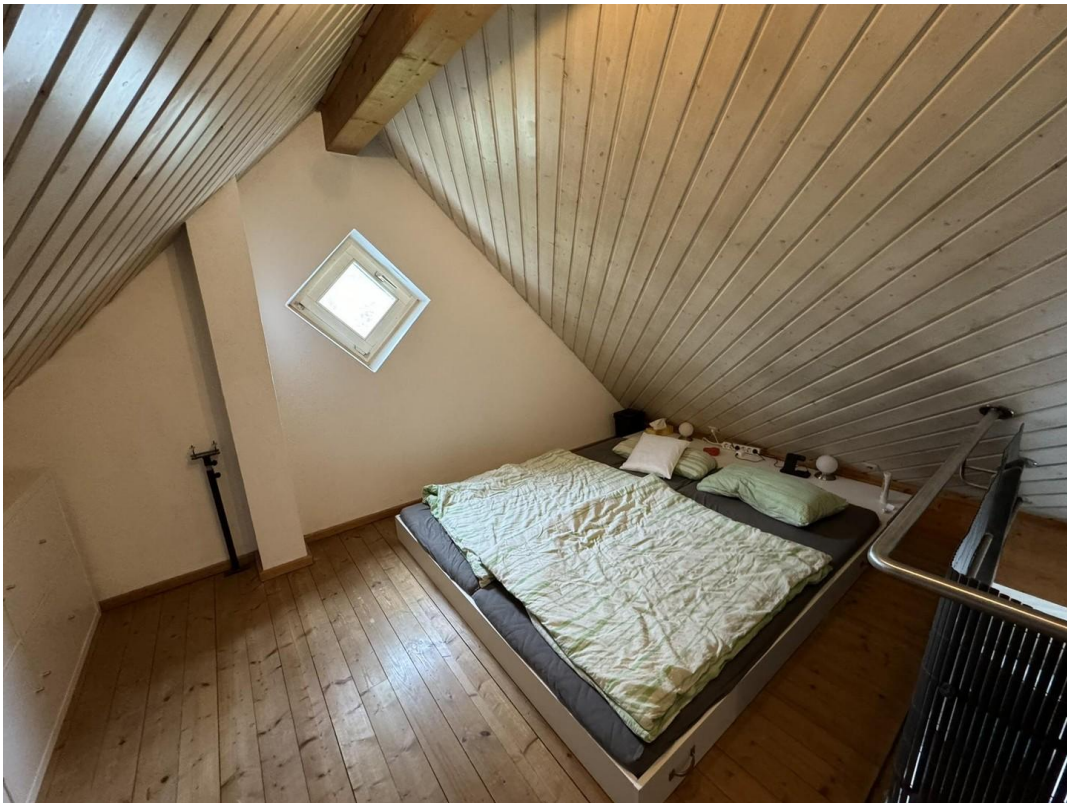
Die Galerie ...