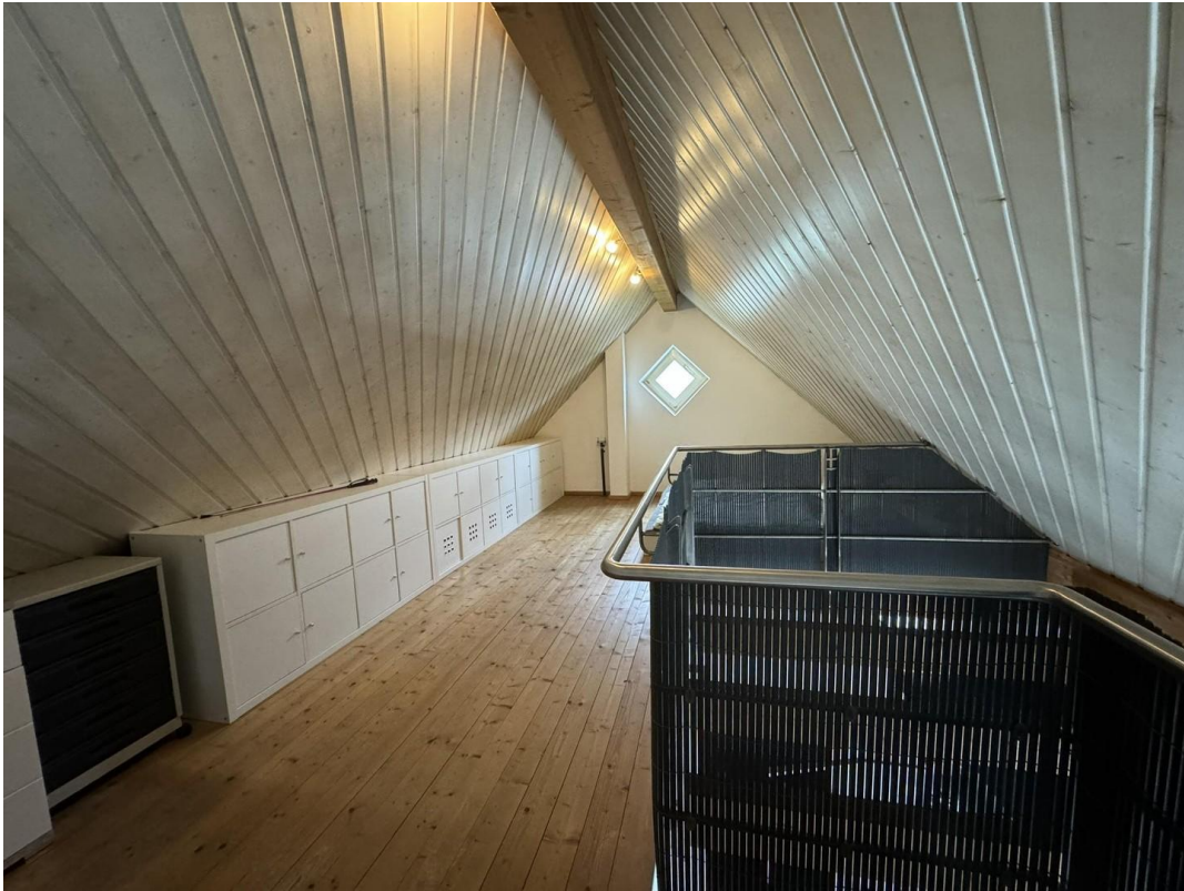
Die Galerie ...