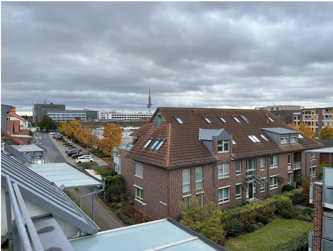
Blick von der Dachterrasse SW