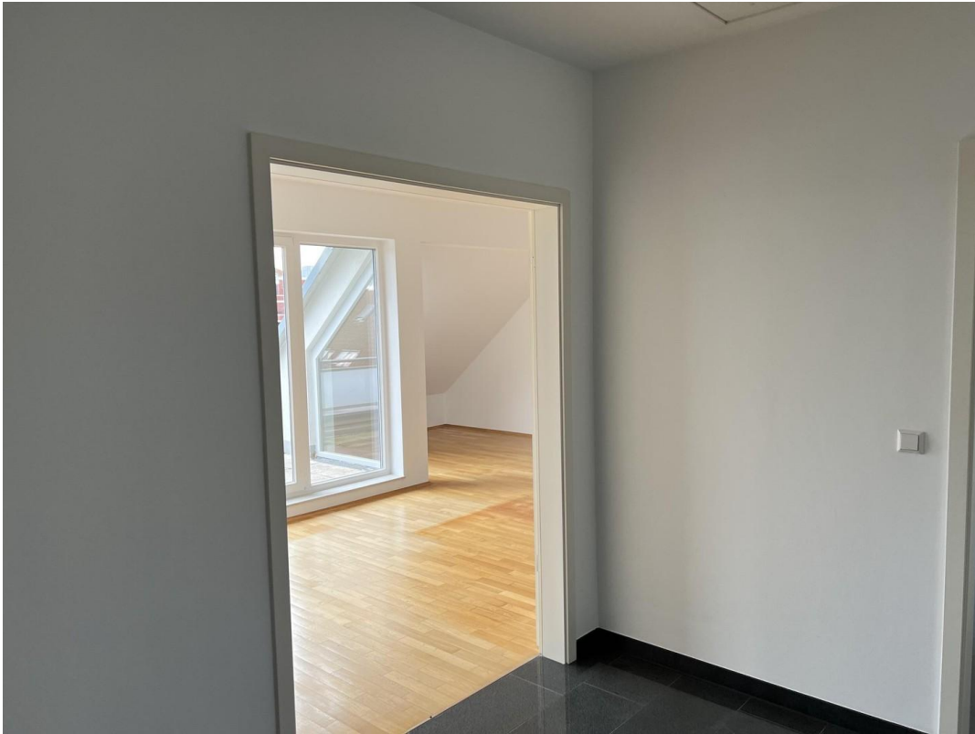
Blick ins Wohnzimmer