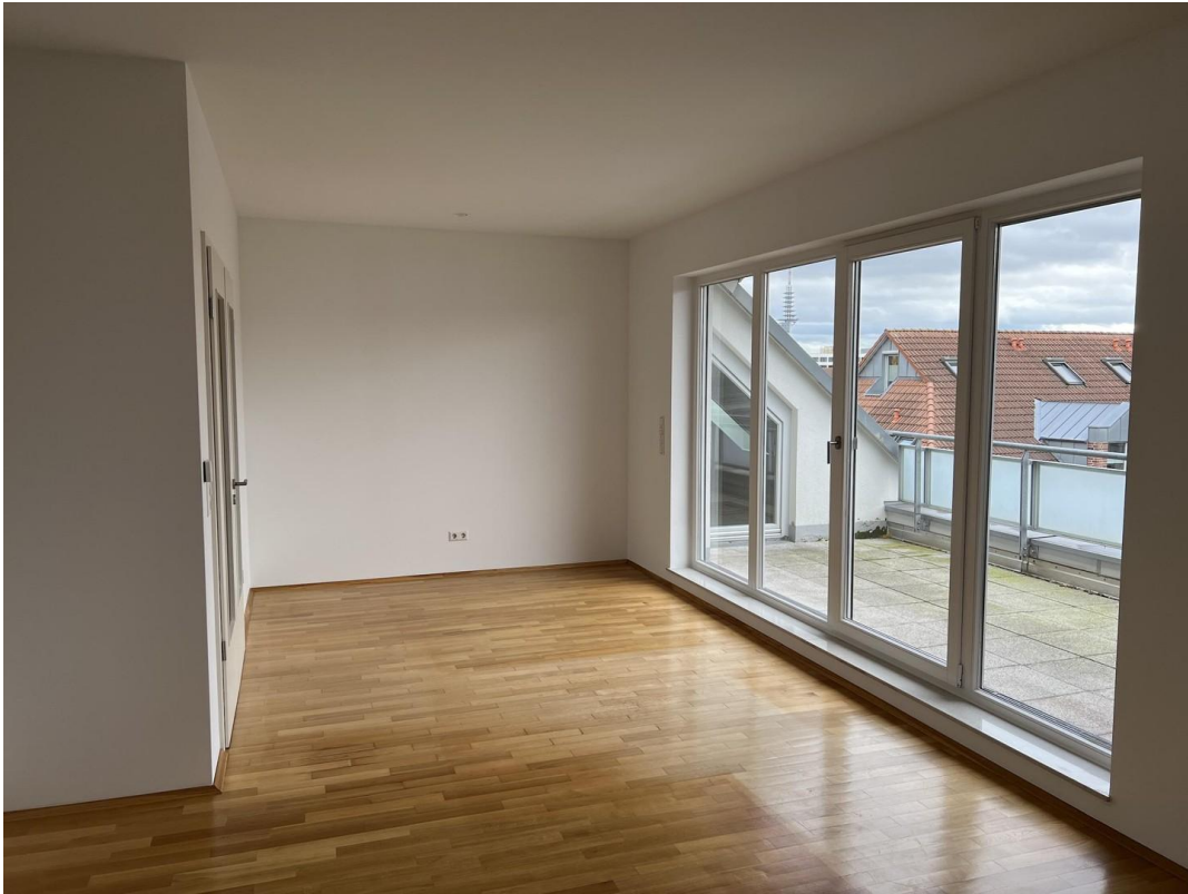
Wohnzimmer mit Dachterrasse