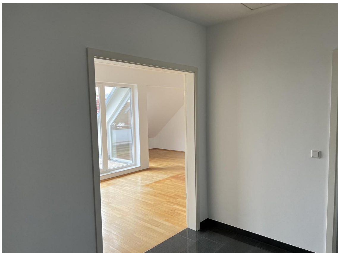
Blick ins Wohnzimmer