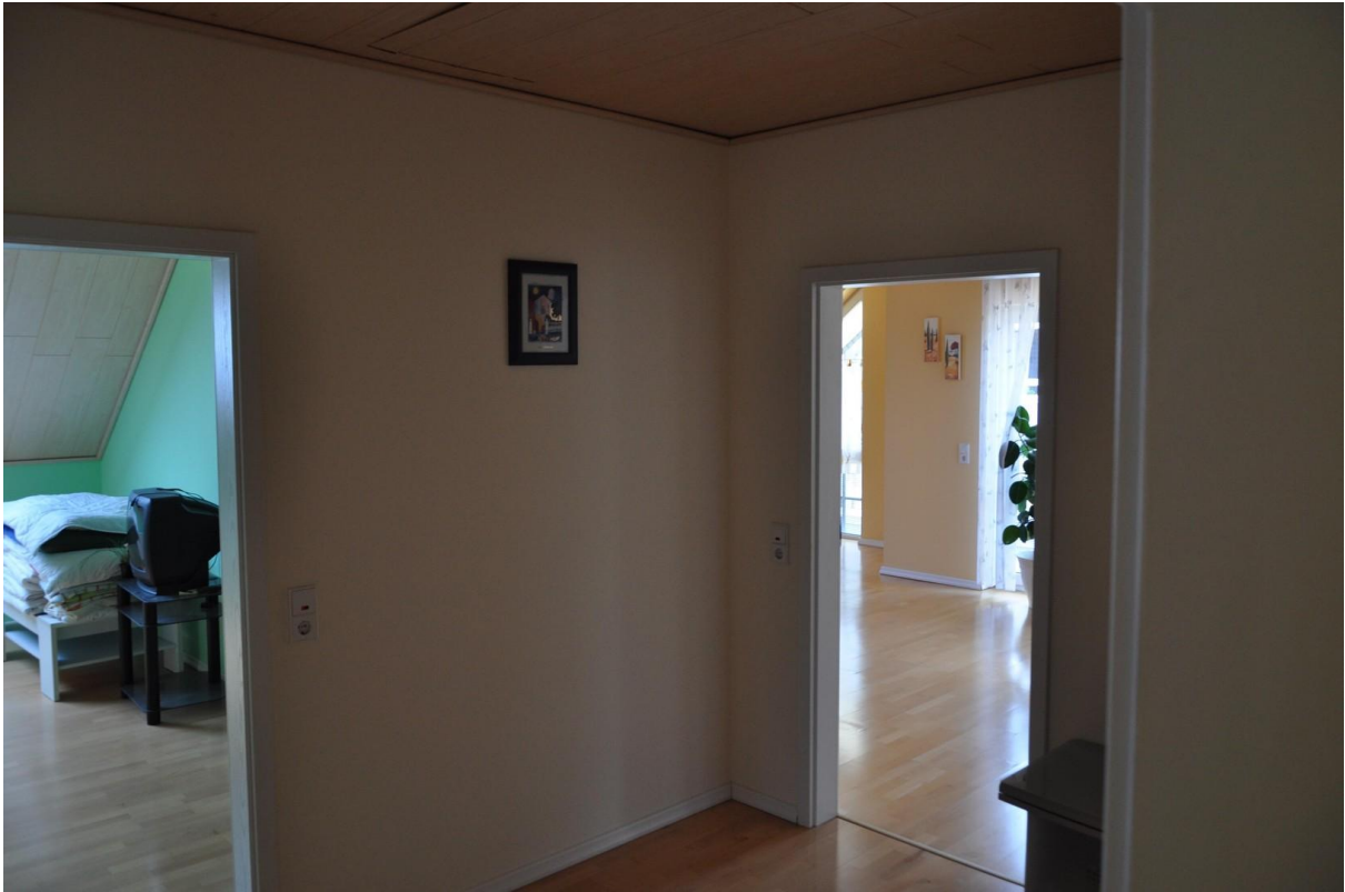
Flur OG Ansicht 1