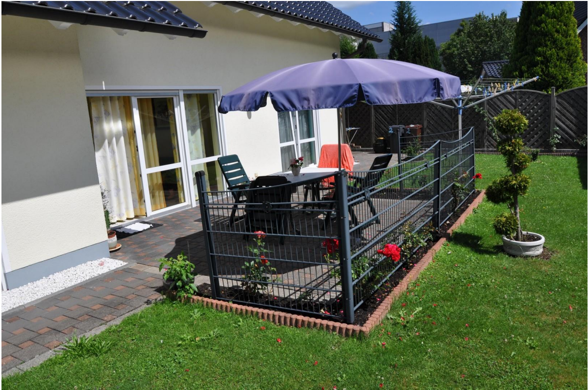
Terrasse Ansicht 1