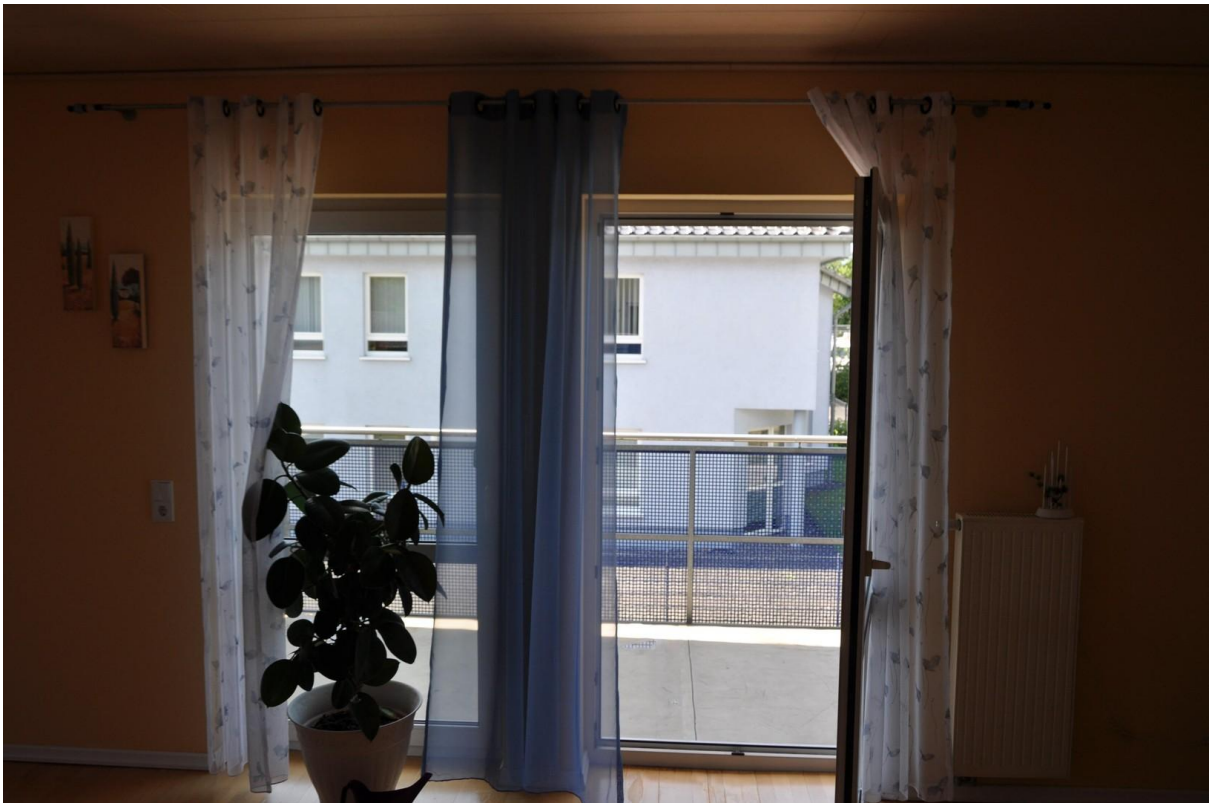
Wohnzimmer OG Ansicht 2