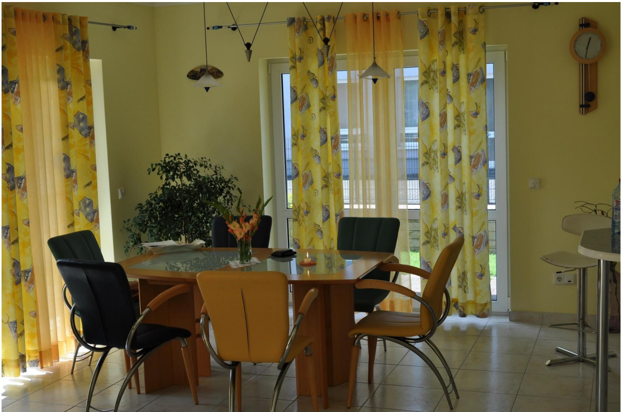
Esszimmer EG Ansicht 1