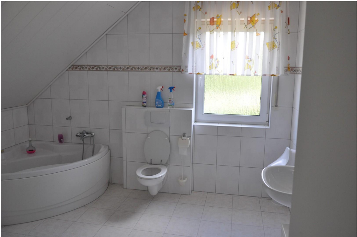
Bad OG Ansicht 1