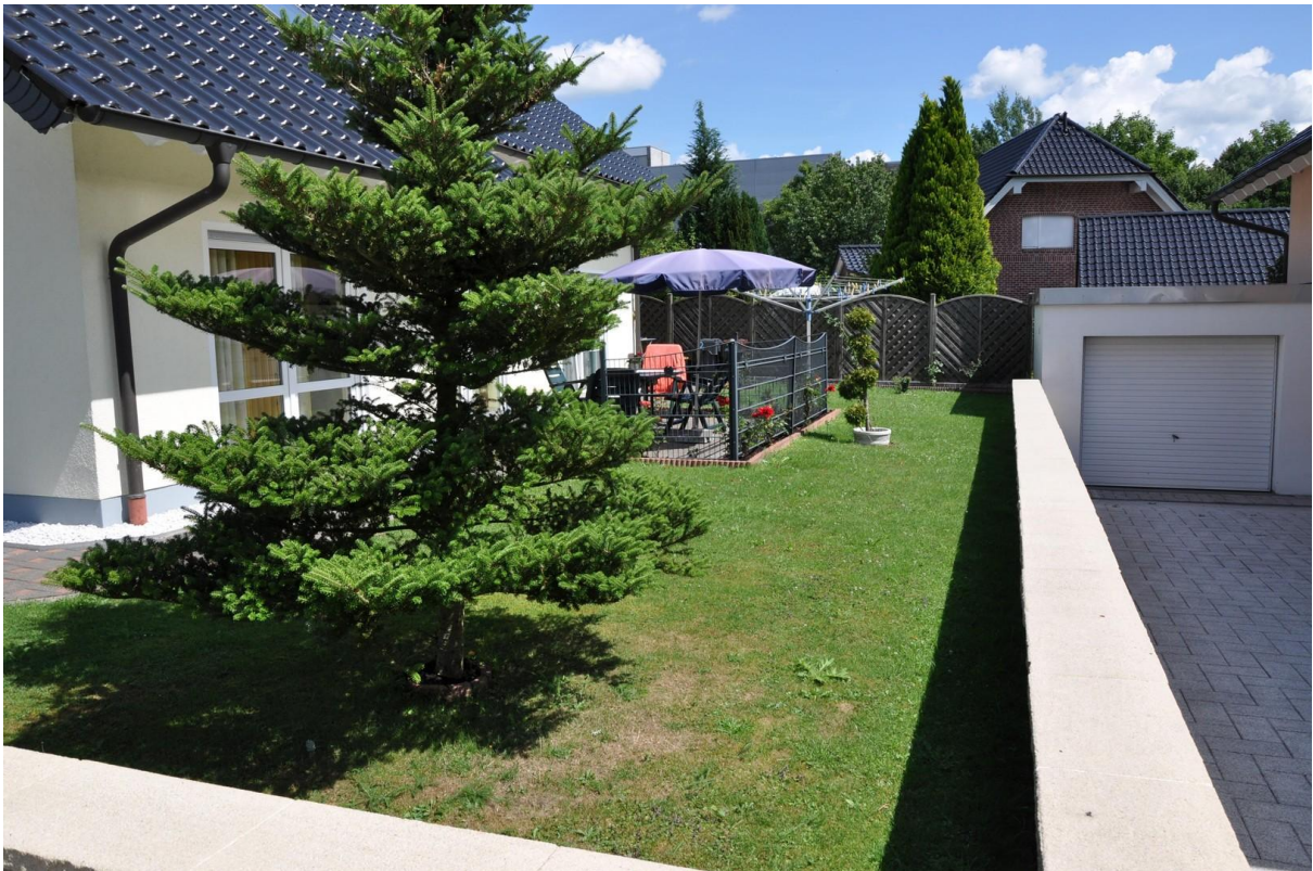
Terrasse Ansicht 2