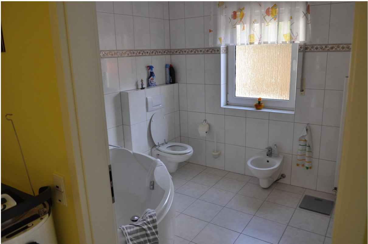
Bad EG Ansicht 1