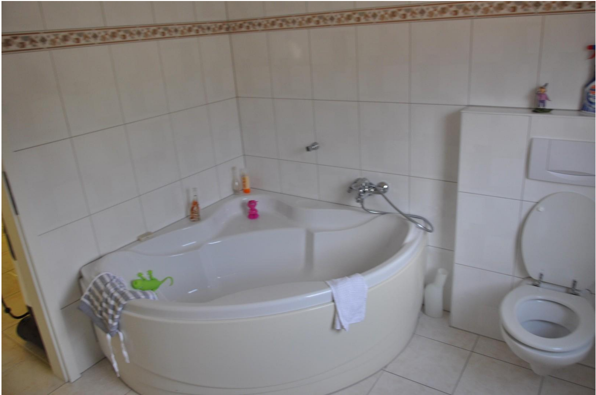
Bad EG Ansicht 2