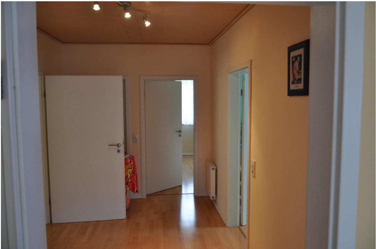
Flur OG Ansicht 2