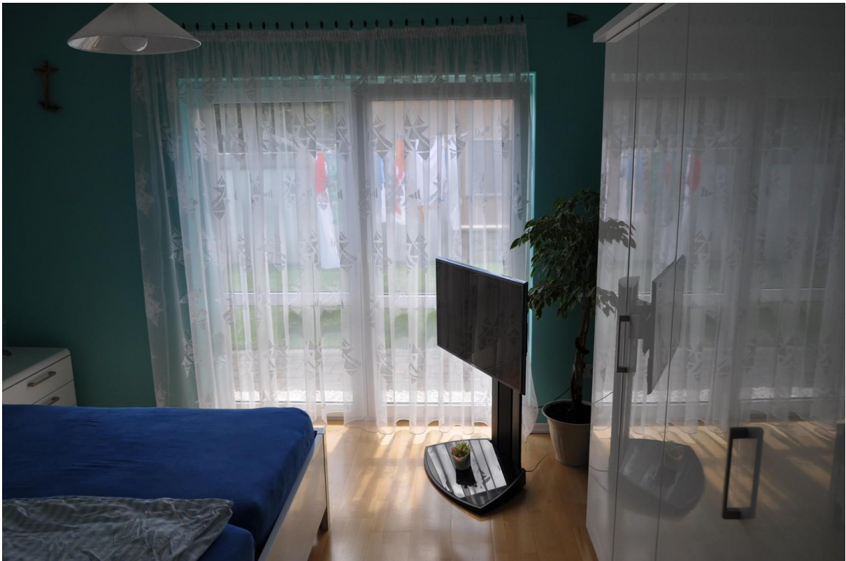
Schlafzimmer 2 EG