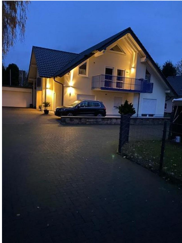
Hausansicht bei Dunkelheit