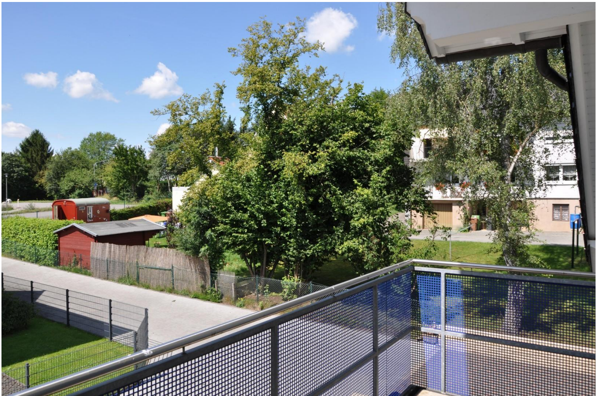
Wohnzimmer Balkon OG Ansicht 2