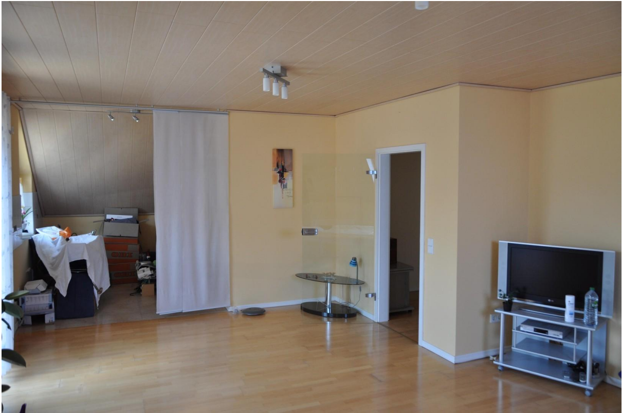
Wohnzimmer OG Ansicht 1