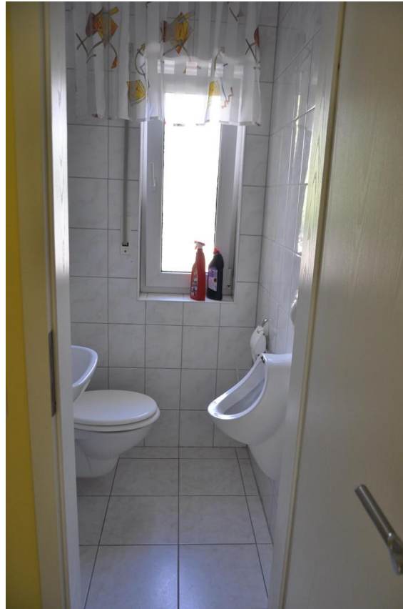
Gäste WC EG