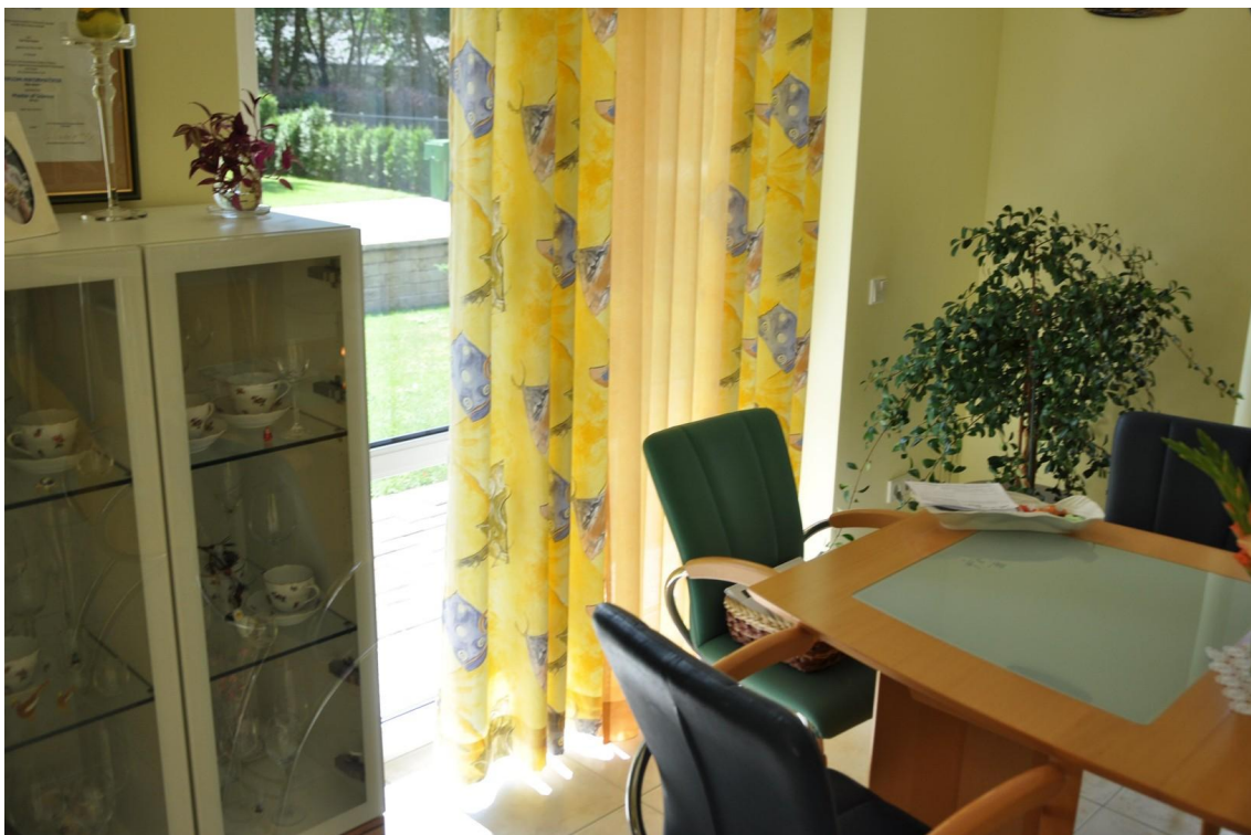
Esszimmer EG Ansicht 3