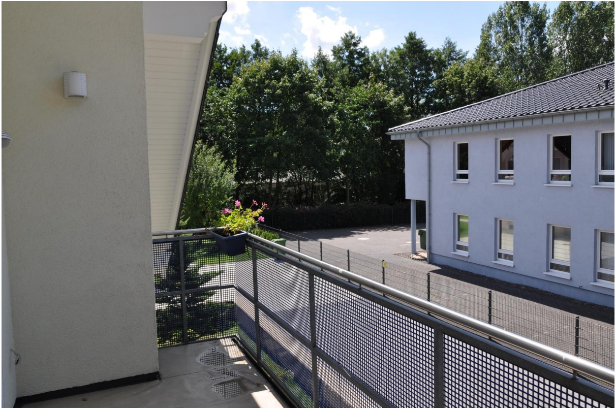
Wohnzimmer Balkon OG Ansicht 1