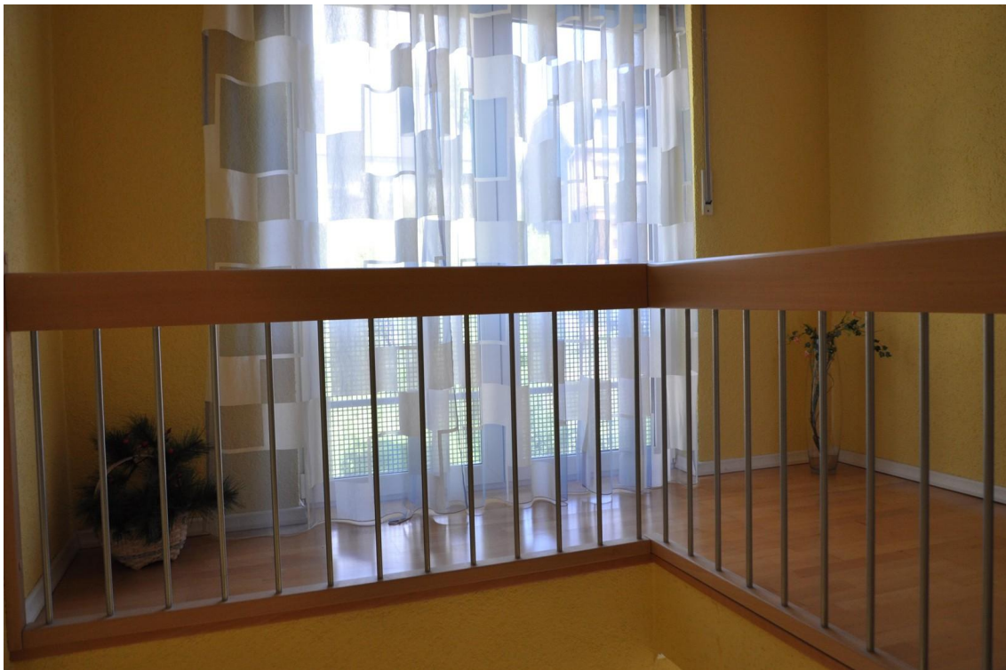
Treppenhaus Ansicht 2