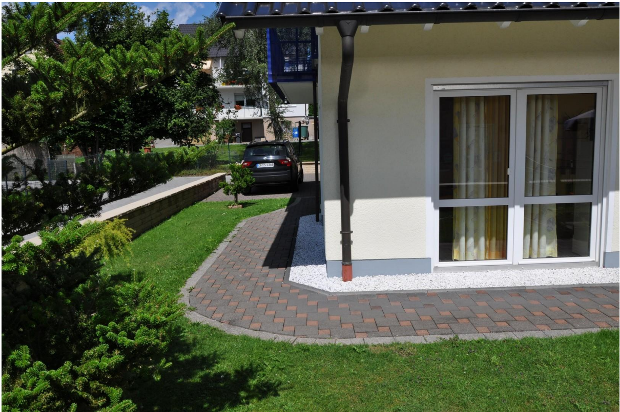
Terrasse Ansicht 3