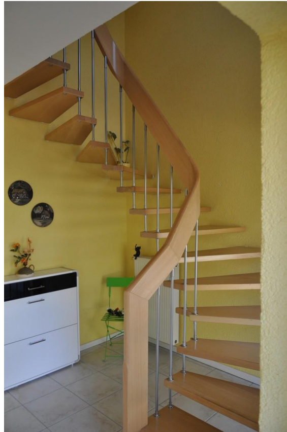
Treppenhaus Ansicht 1