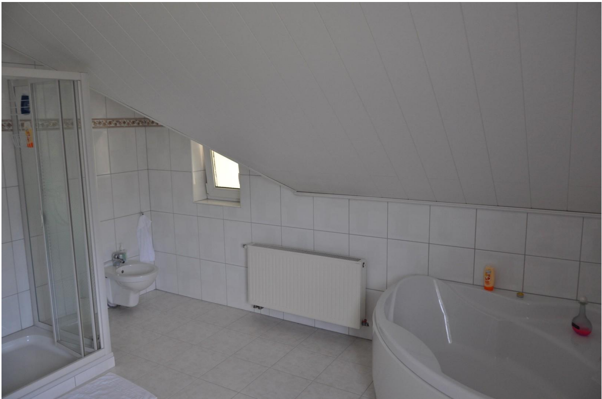
Bad OG Ansicht 2