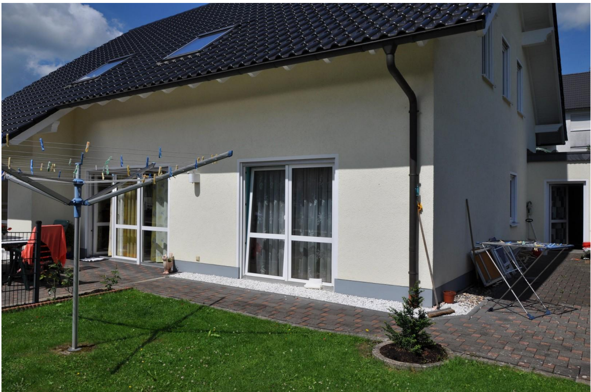
Terrasse Ansicht 4