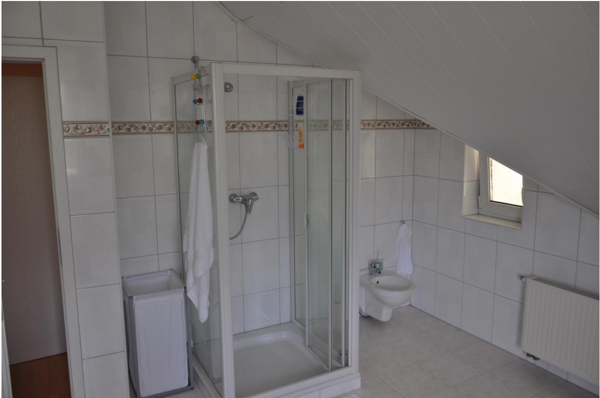
Bad OG Ansicht 3