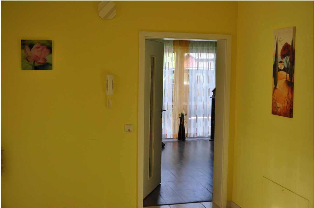
Schlafzimmer 1 EG