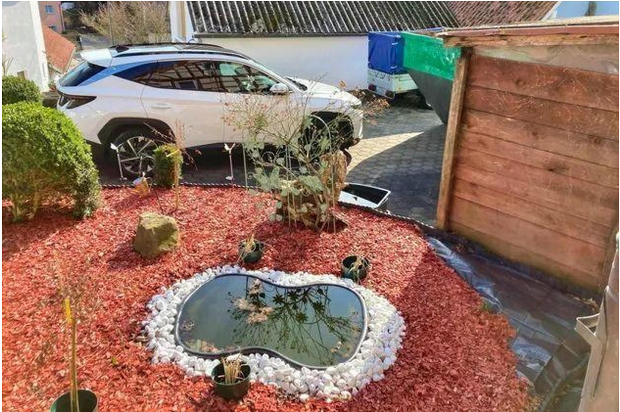
Vorgarten mit Hof