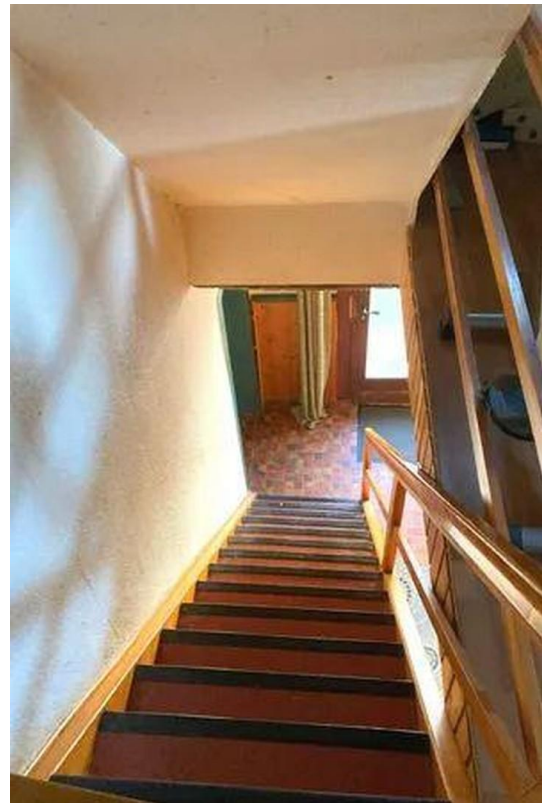
Treppe ins OG