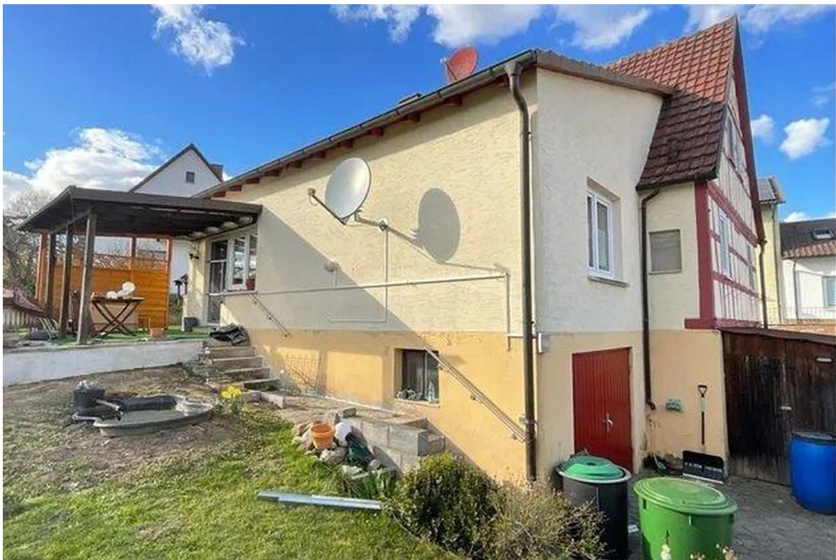
Rasen bei Hof