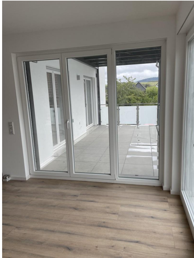
Wohnzimmer zum Balkon