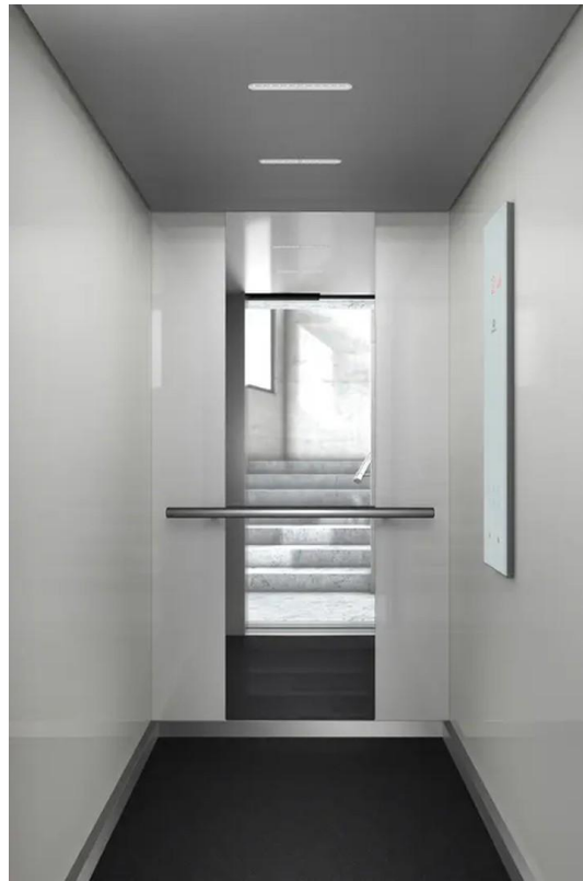
Aufzug - hell & repräsentativ