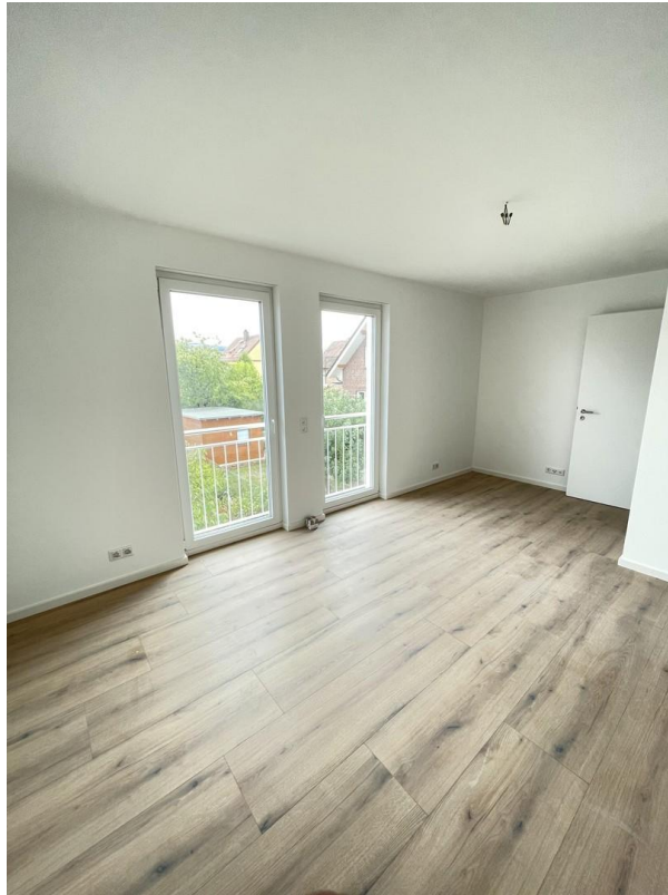
Kinderzimmer / Homeoffice