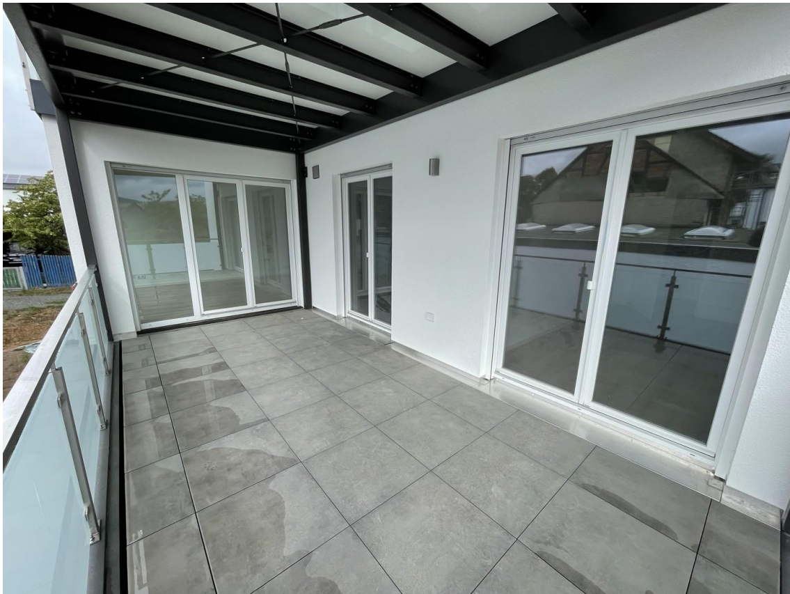
Loggia / überdachter Balkon