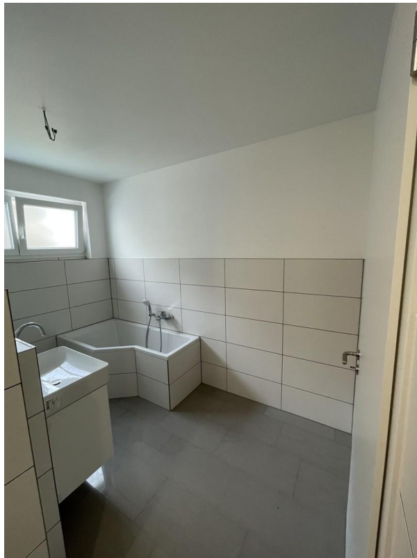
Tageslichtbad mit viel Platz