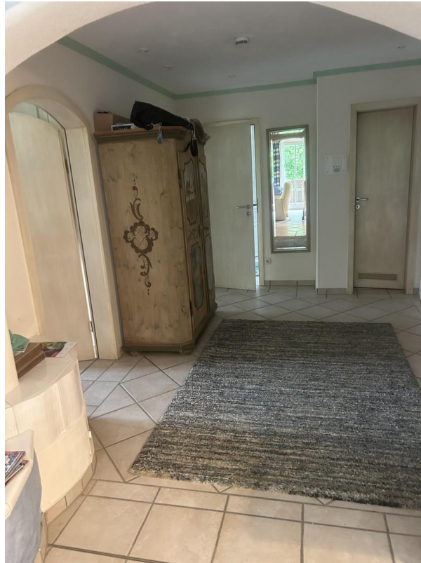
Diele zum Badezimmer