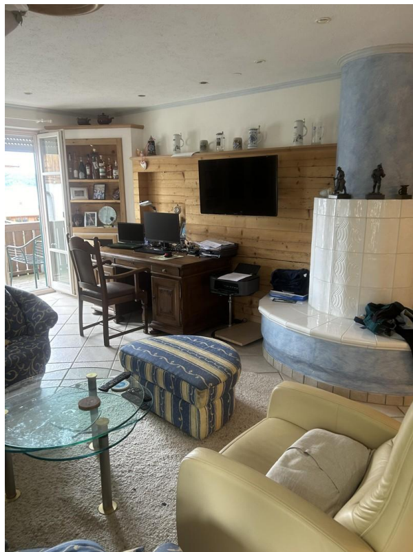
Kachelofen, Tür zum Balkon