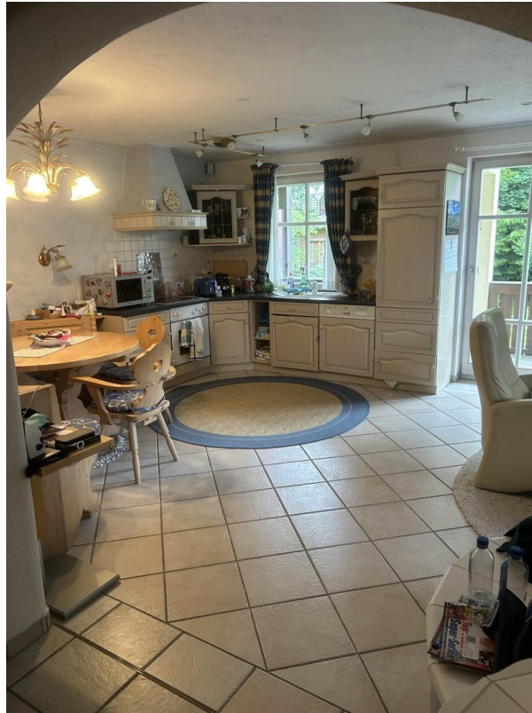
Ansicht von der Diele