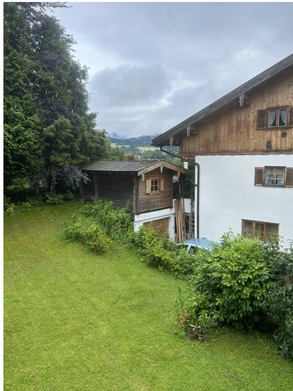
Blick vom 2. Balkon