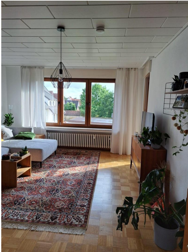
Wohnung 1. Etage