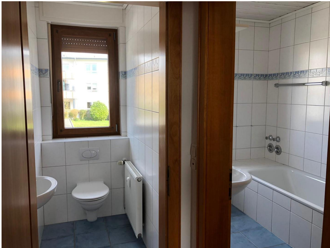
Bad 1. Etage/ EG/ DG