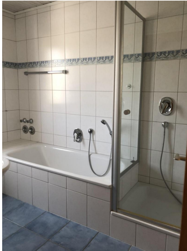
Bad 1. Etage/EG/DG