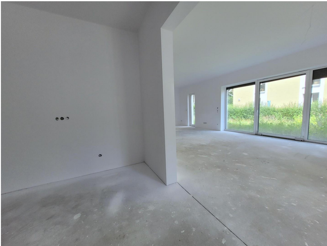
Ess-, Koch- und Wohnbereich