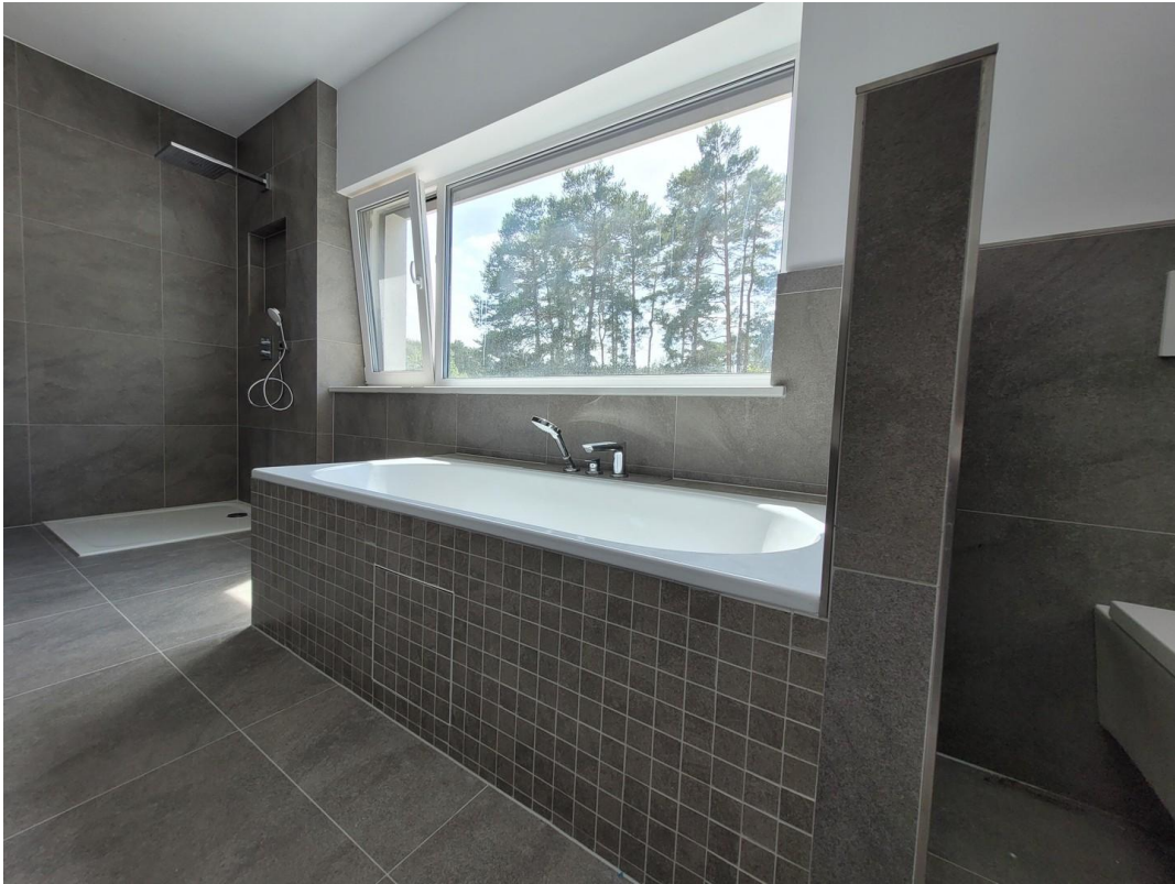
Bad mit großem Fenster