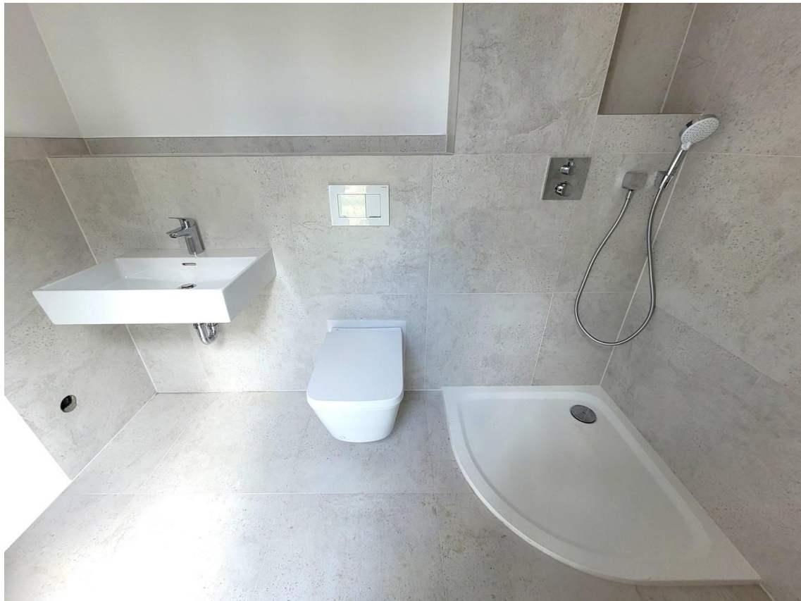
Duschbad im Erdgeschoß