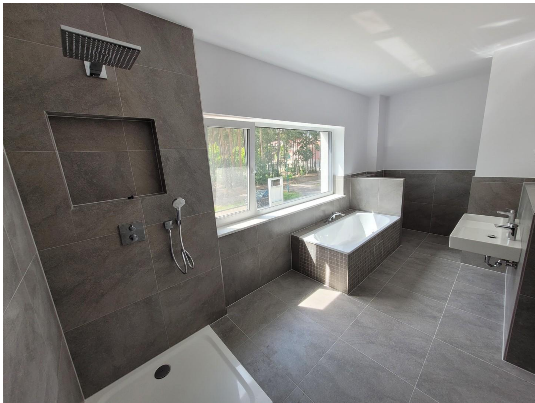
Großzügiges Badezimmer im OG