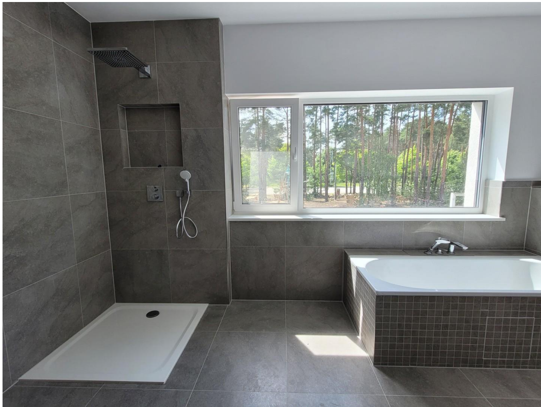
Badezimmer im Obergeschoß