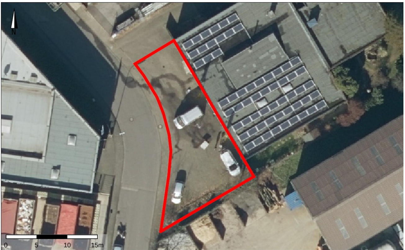
Außenfläche vor dem Gebäude