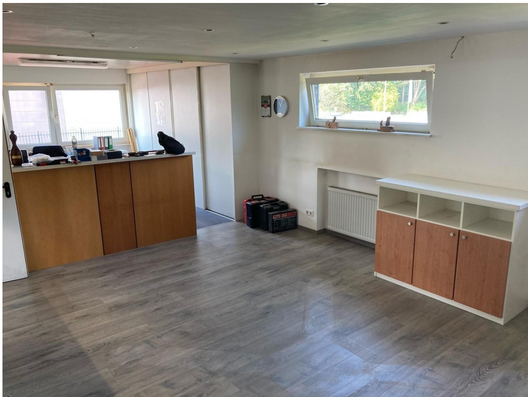
Büro vorne & Ausstellungsraum