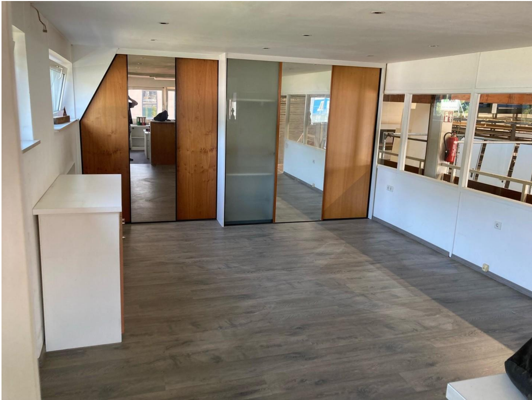
Büro vorne & Ausstellungsraum