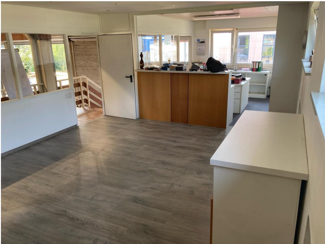
Büro vorne & Ausstellungsraum