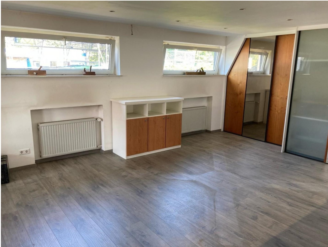
Büro vorne & Ausstellungsraum