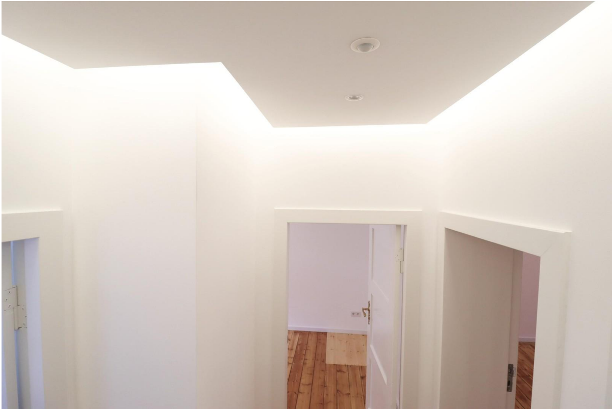
Flur mit indirektem Licht