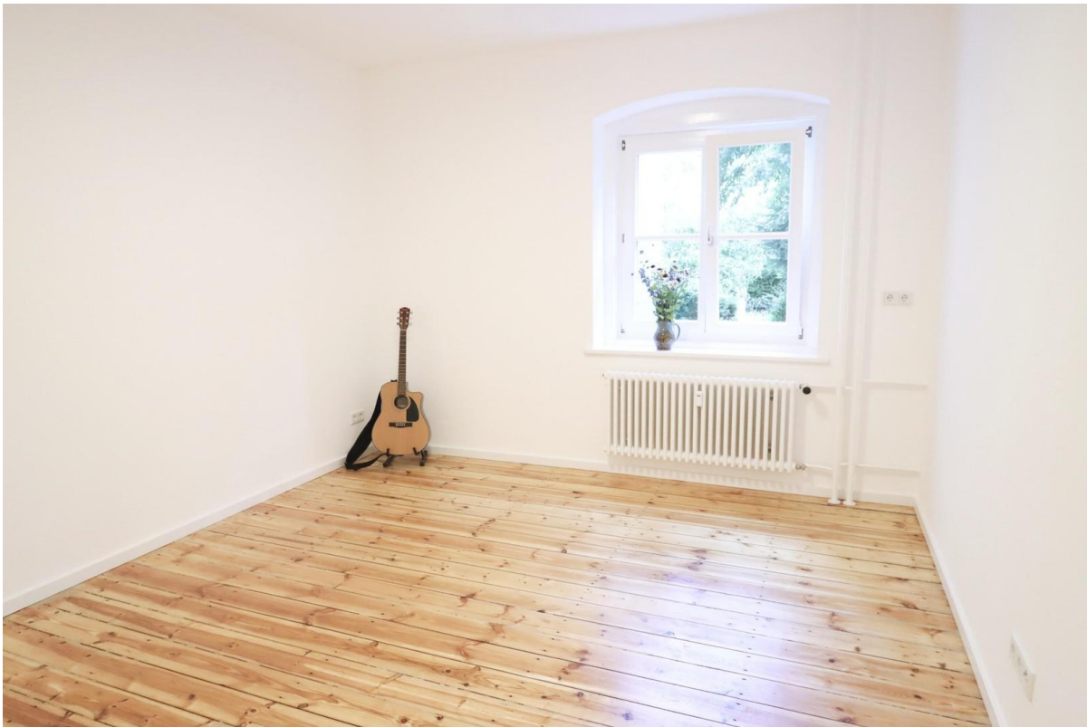
Zimmer zum Garten-Innenhof 1