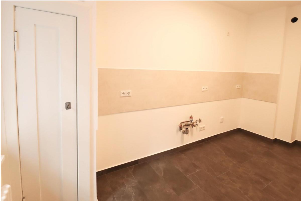
Küchenzeile und Speisekammer