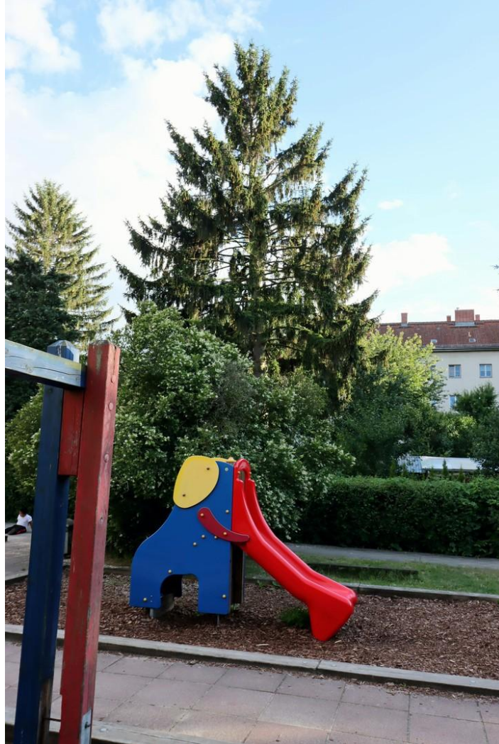
Spielplatz im Innenhof