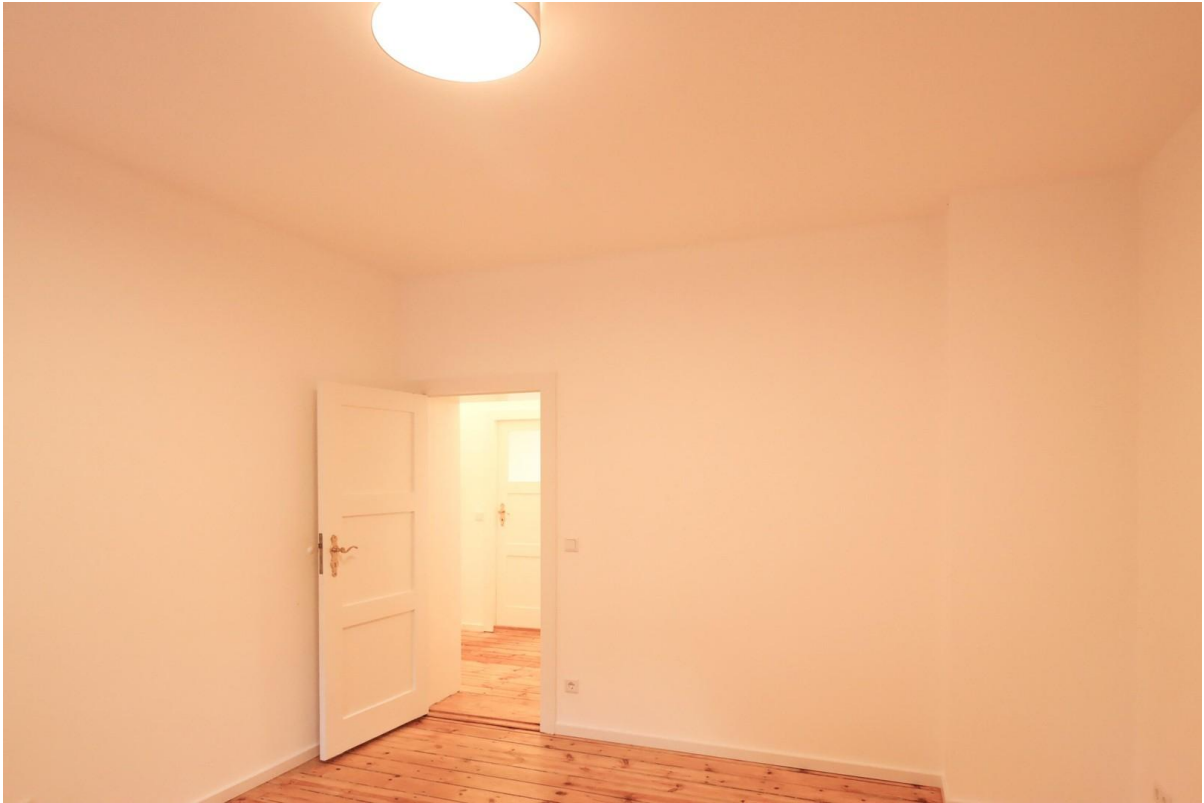
Zimmer zum Garten-Innenhof 2