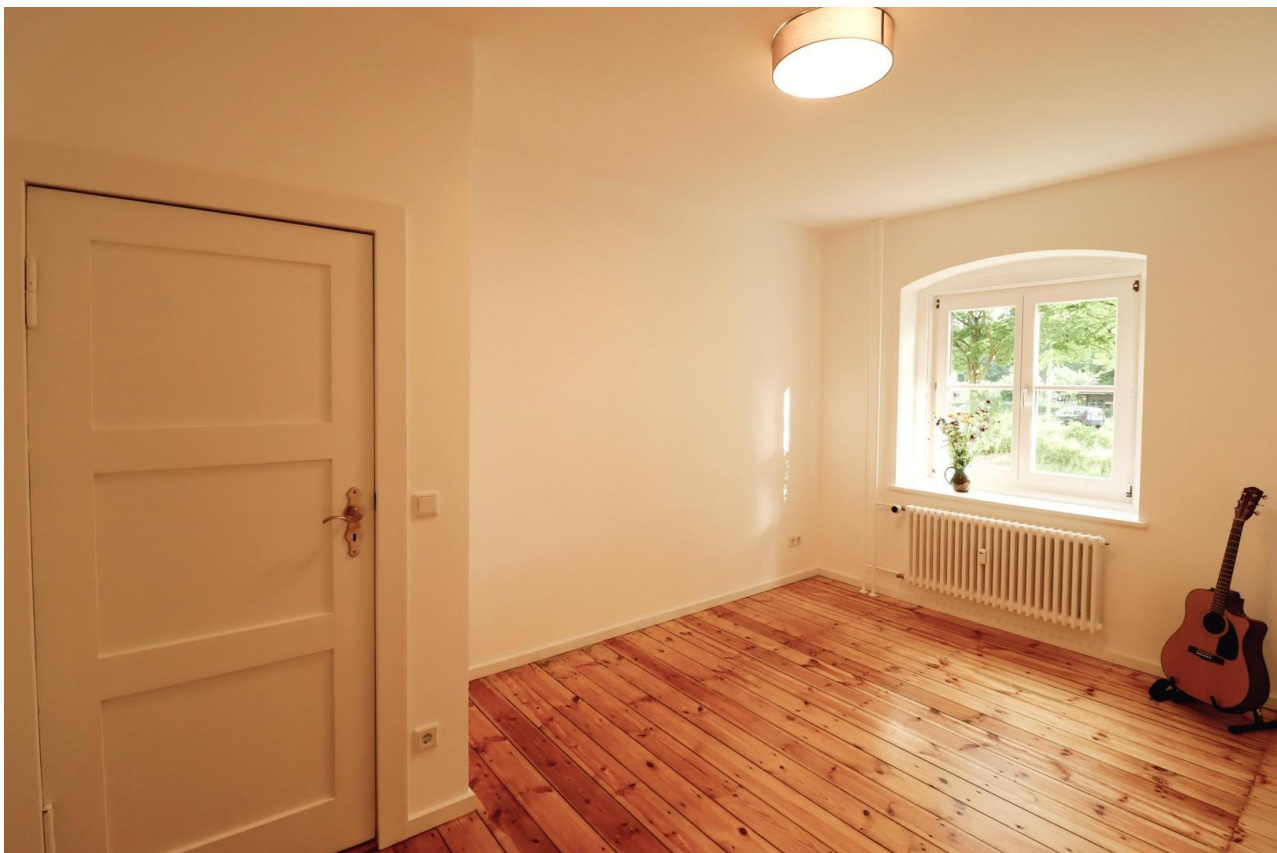
Zimmer zum Vorgarten