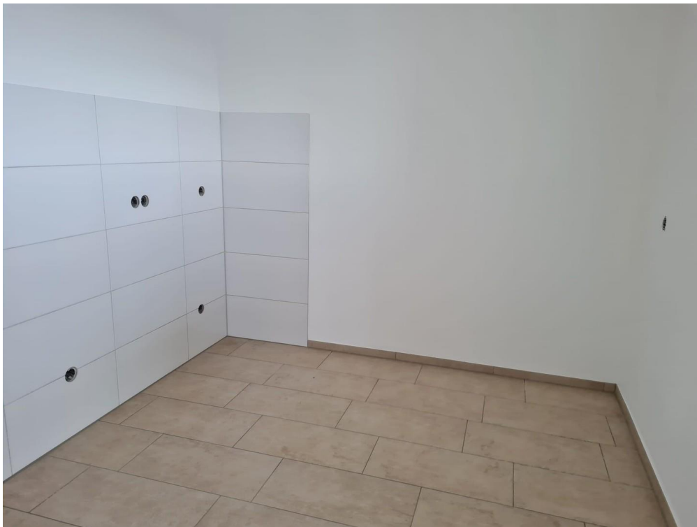
Küche (Einbauküche folgt)