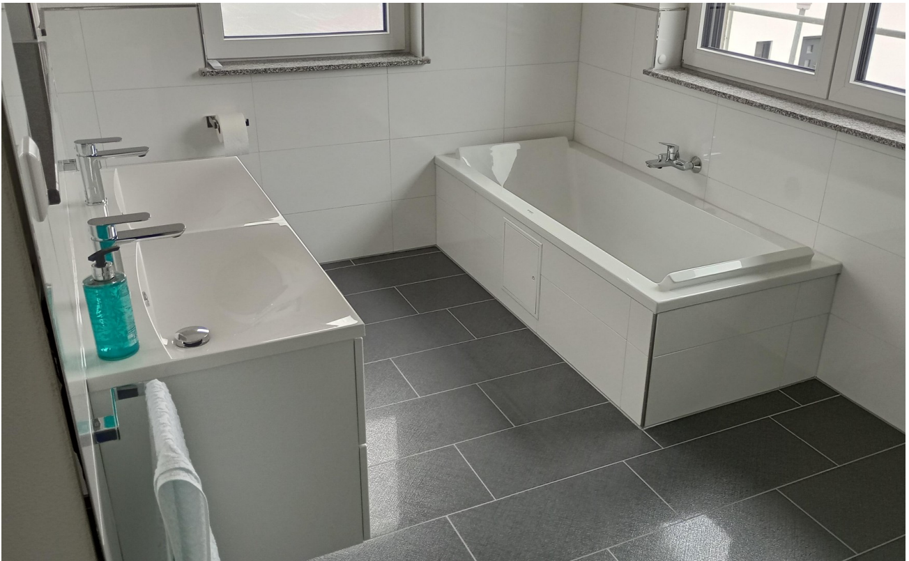
Bad Bild 2