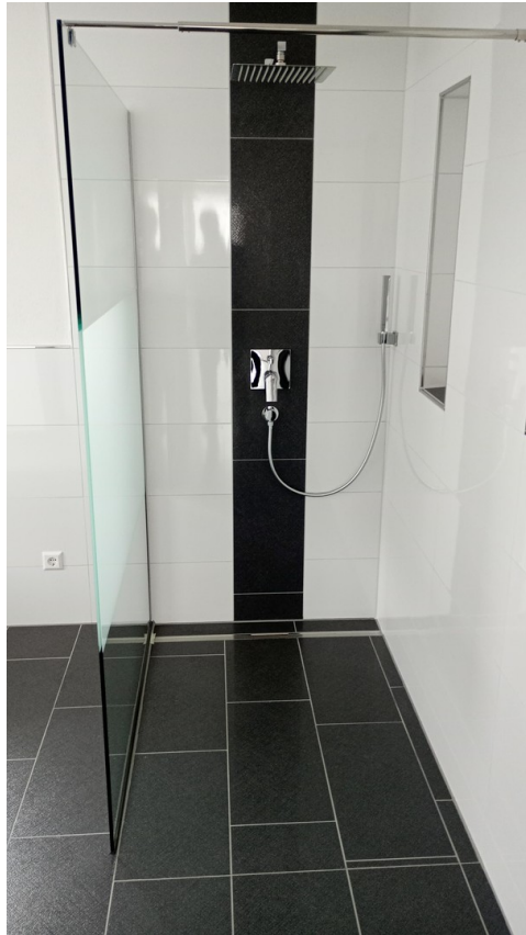
Begehbare Dusche Bad