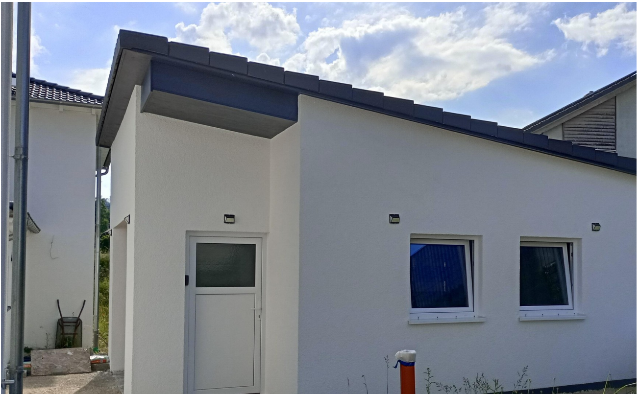
Garage Außenansicht 2