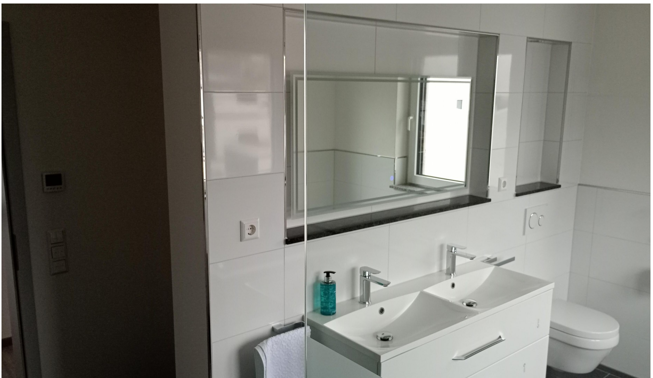
Bad Bild 1