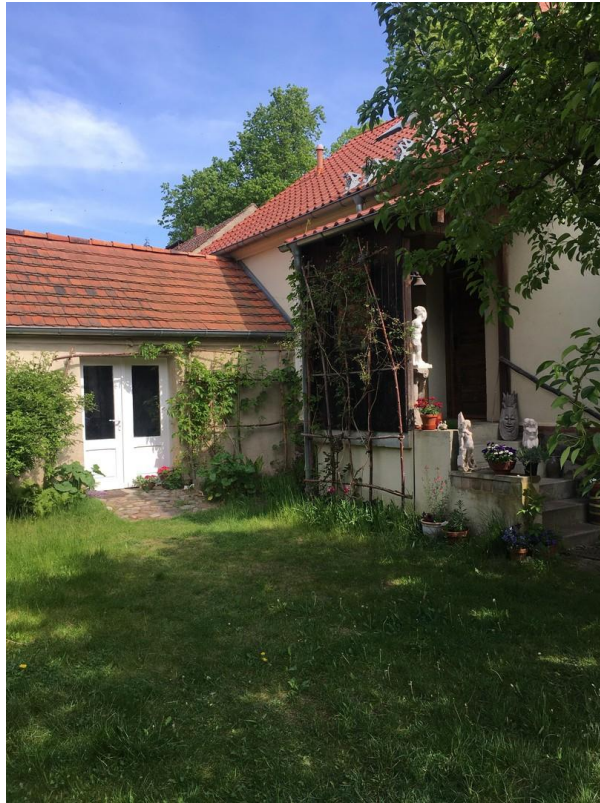
Wohnhaus mit Backhaus