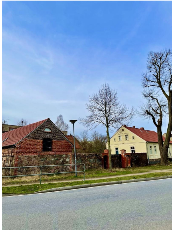
Straßenansicht mit Atelier