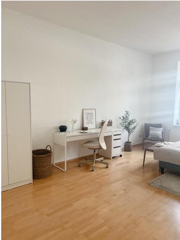
Zimmer 1 (großes Zimmer)