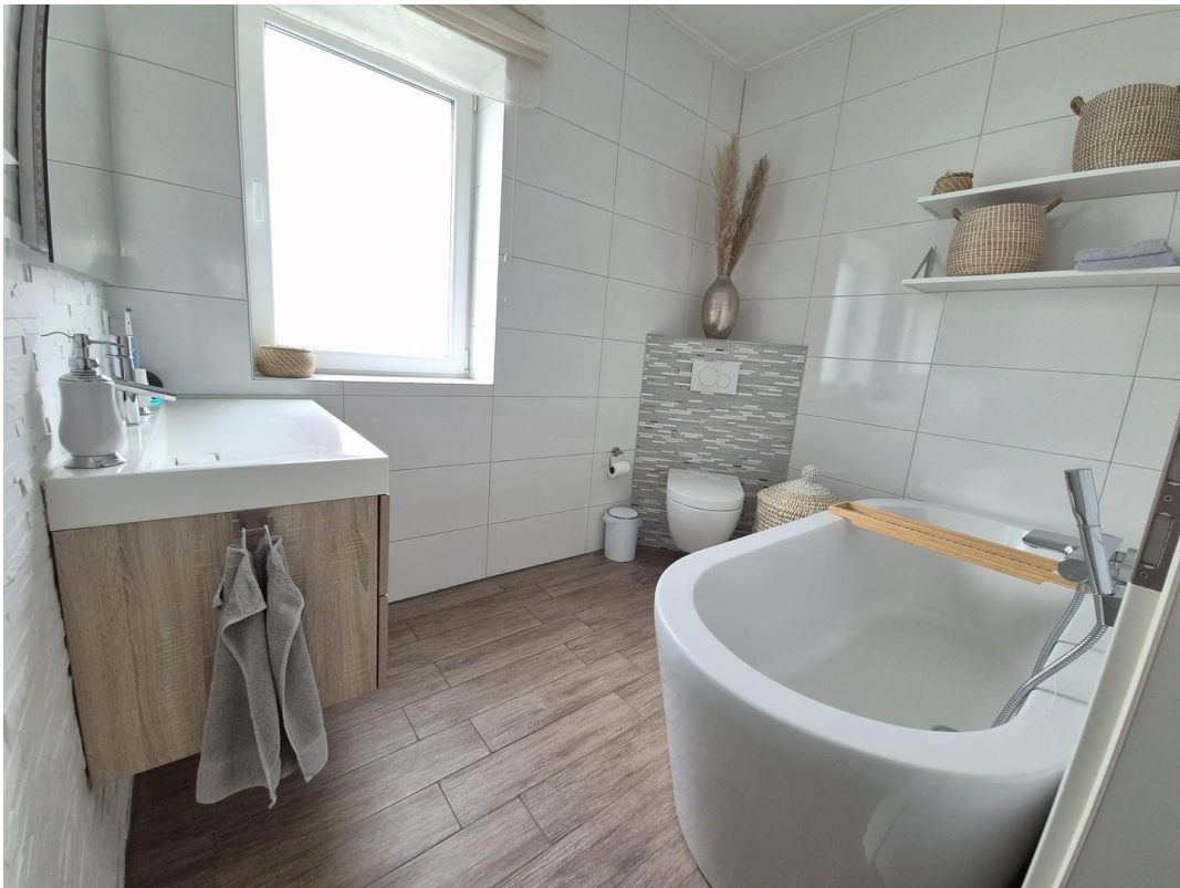
Bad en Suite