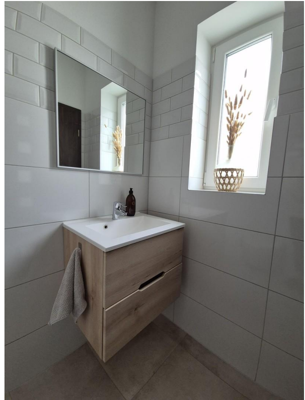
Gäste WC 1. OG