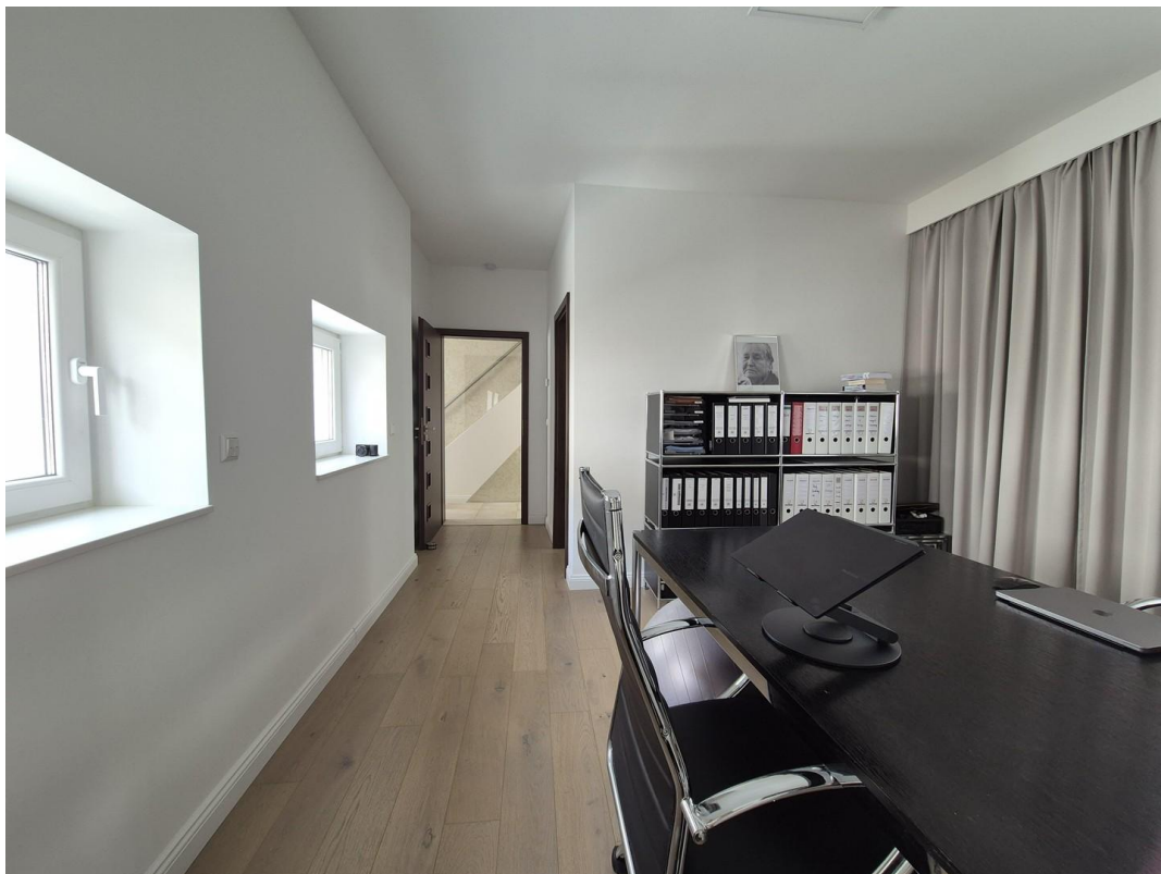
Büro/Kinderzimmer mit Ankleide