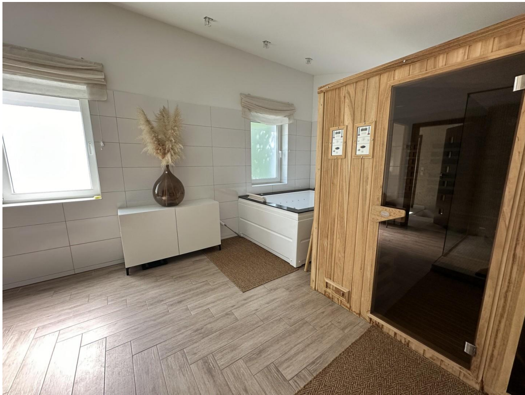
Whirlpool und Sauna