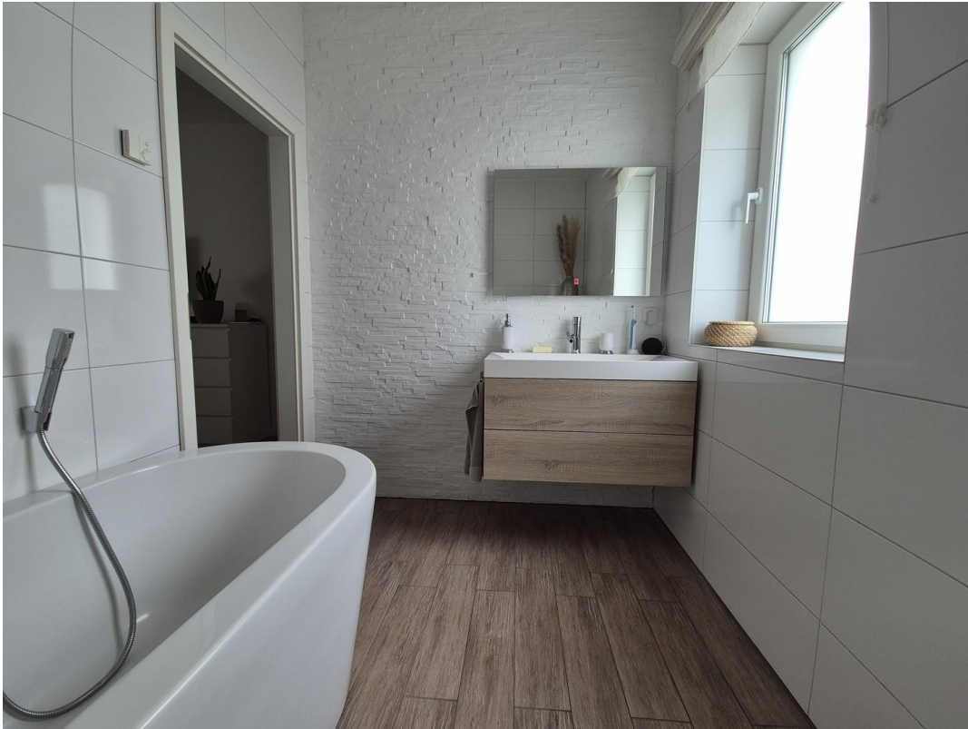
Bad en Suite