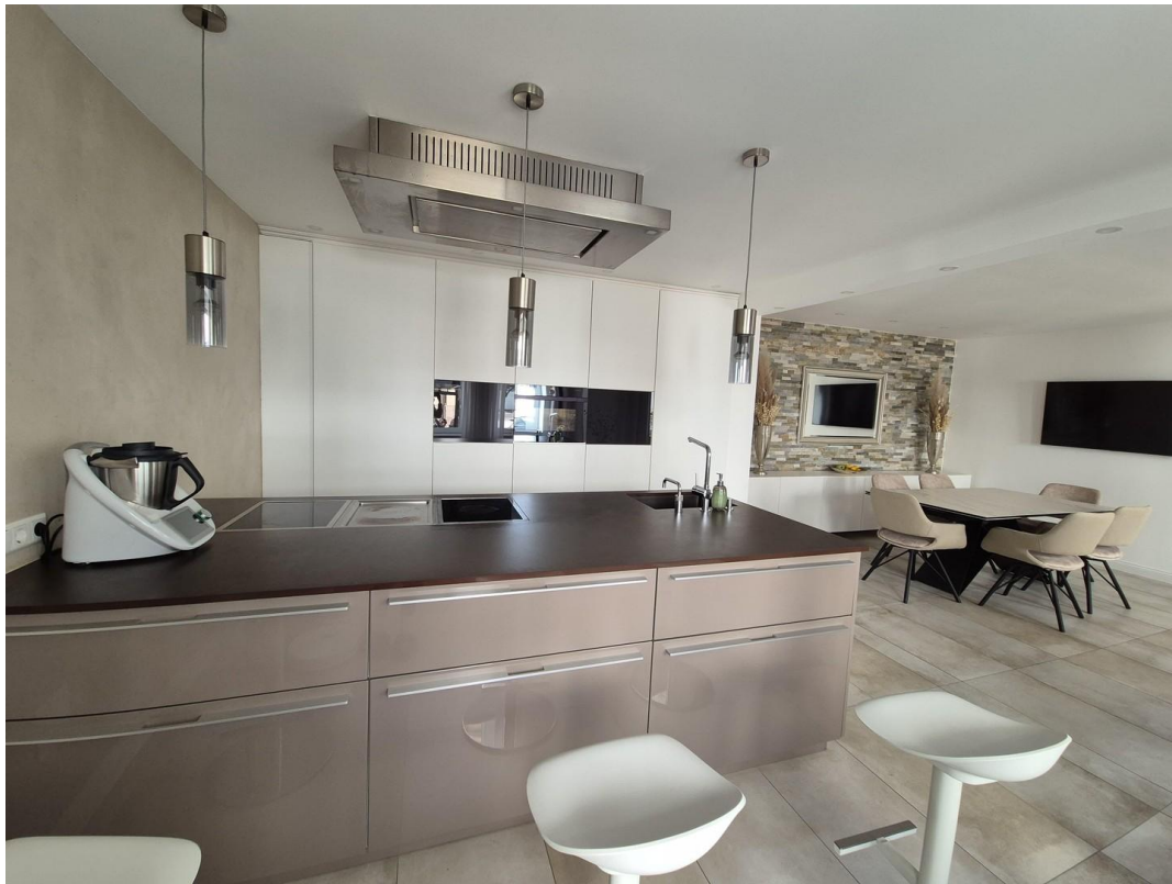
Küche mit Gaggenau Geräten