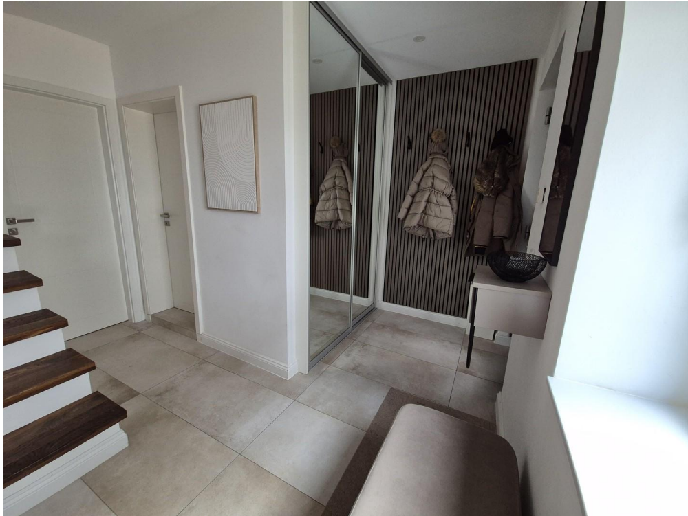
Eingangsbereich mit Garderobe