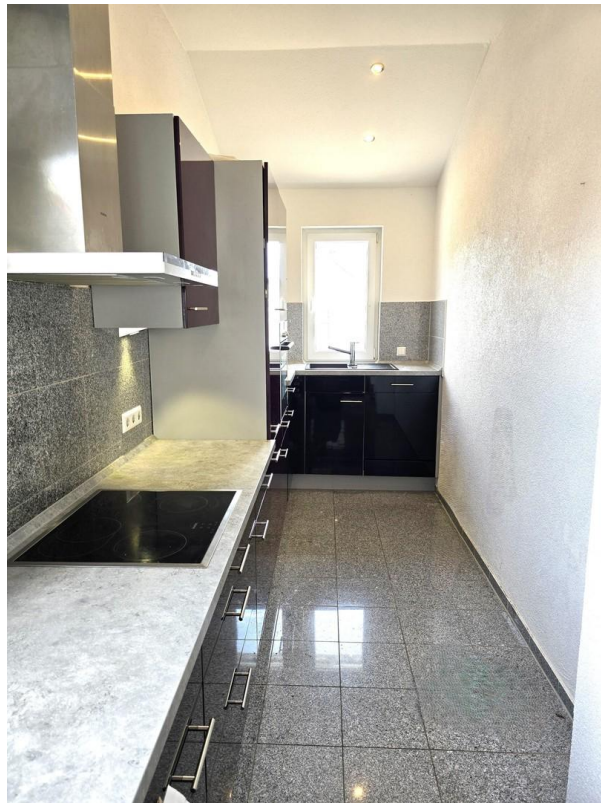
Küche mit EBK.