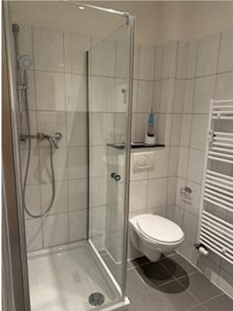
Glas - Dusche