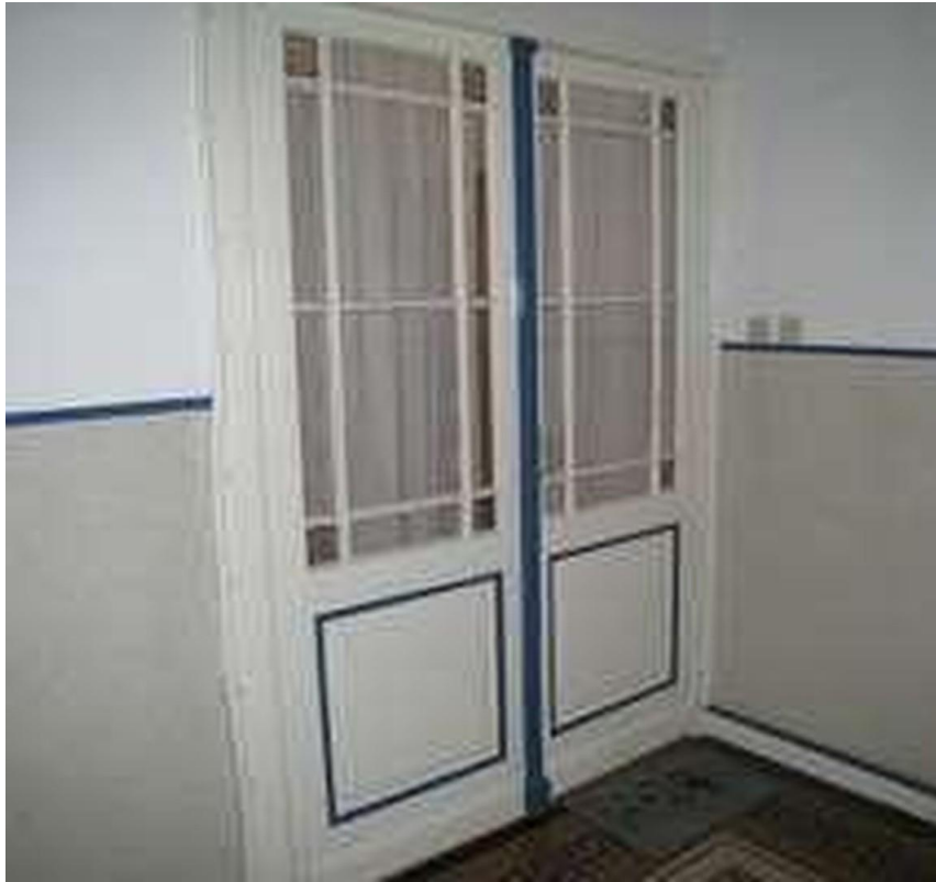
Eingangsbereich zur Wohnung