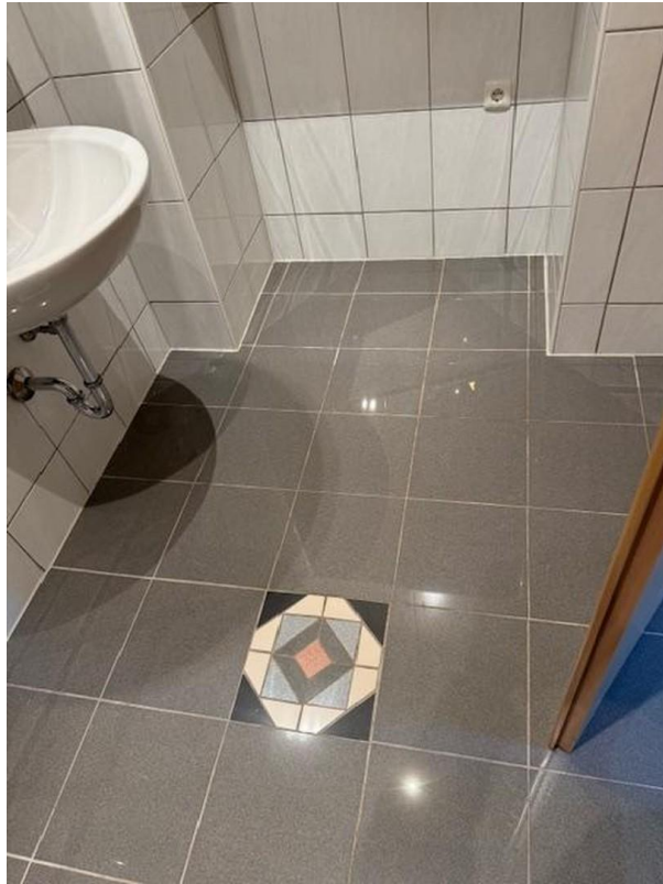
Bad - Fußboden