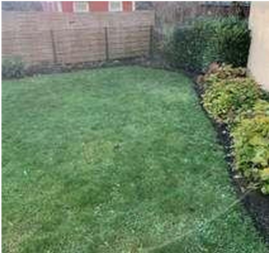
Garten - Ansicht