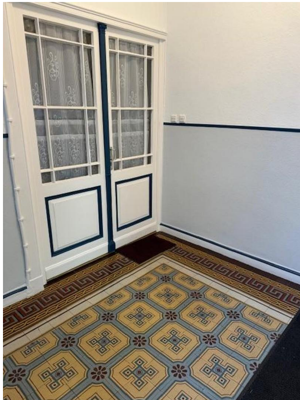
Eingangsbereich zur Wohnung