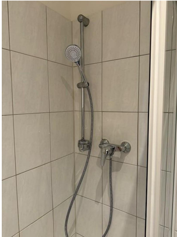
Dusch - Garnitur