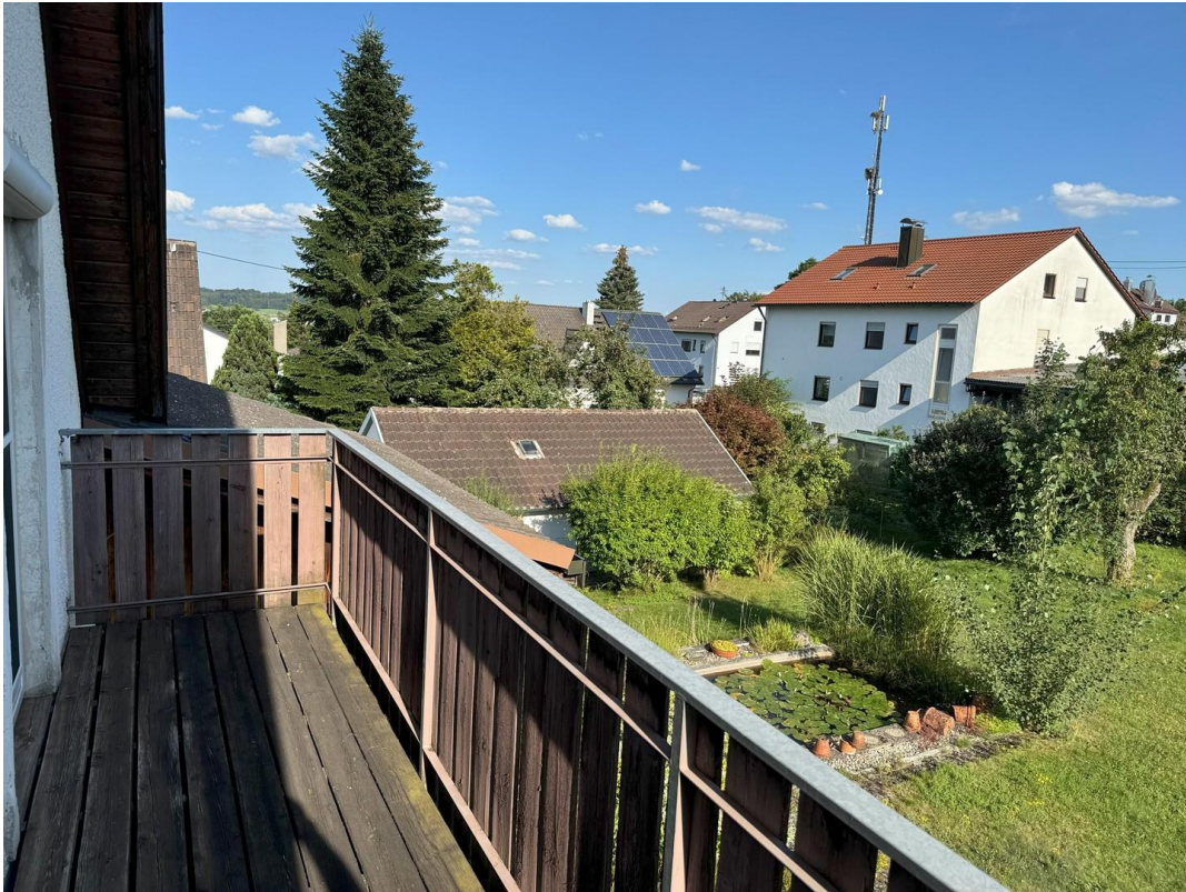
Balkon Richtung Südost