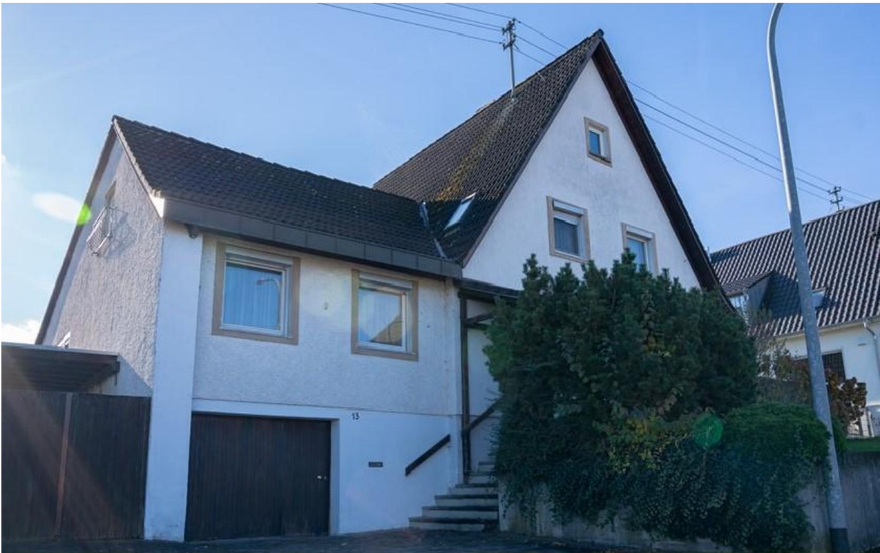
Ansicht von Norden