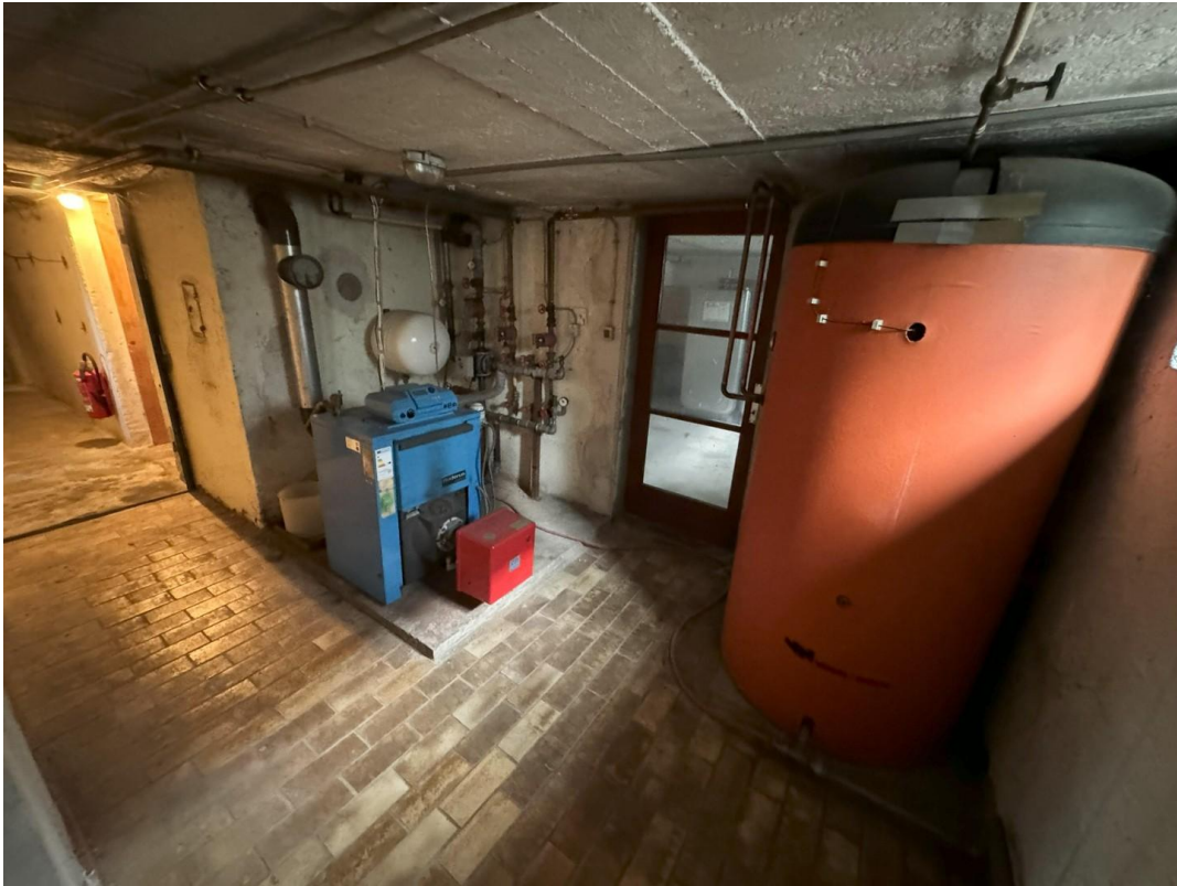
Heizkeller mit Ölheizung