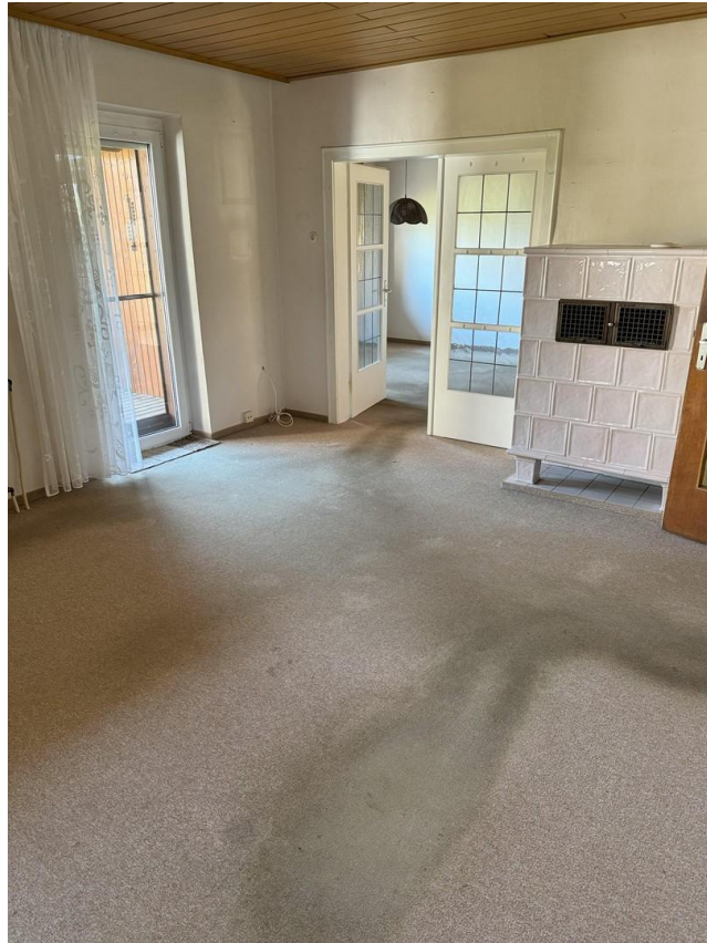
Wohnzimmer I mit Kachelofen