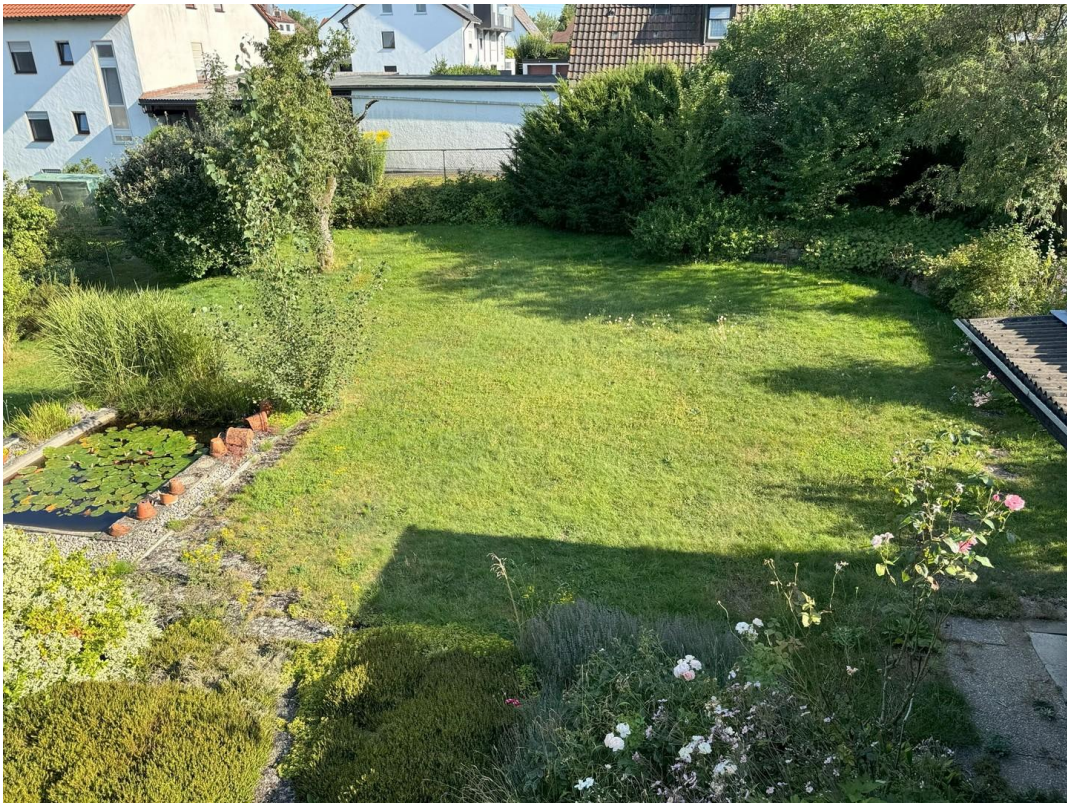
Garten mit Fischteich