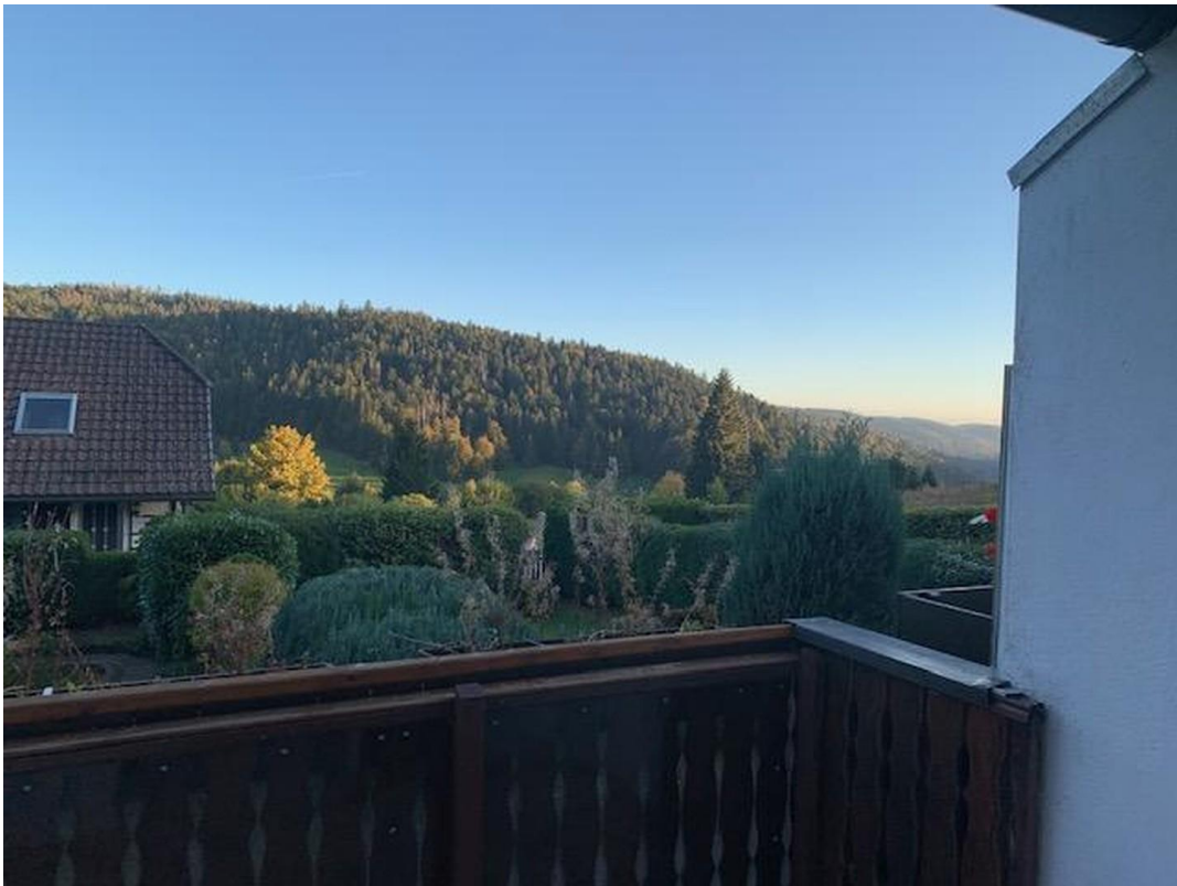
Balkon mit schönem Ausblick