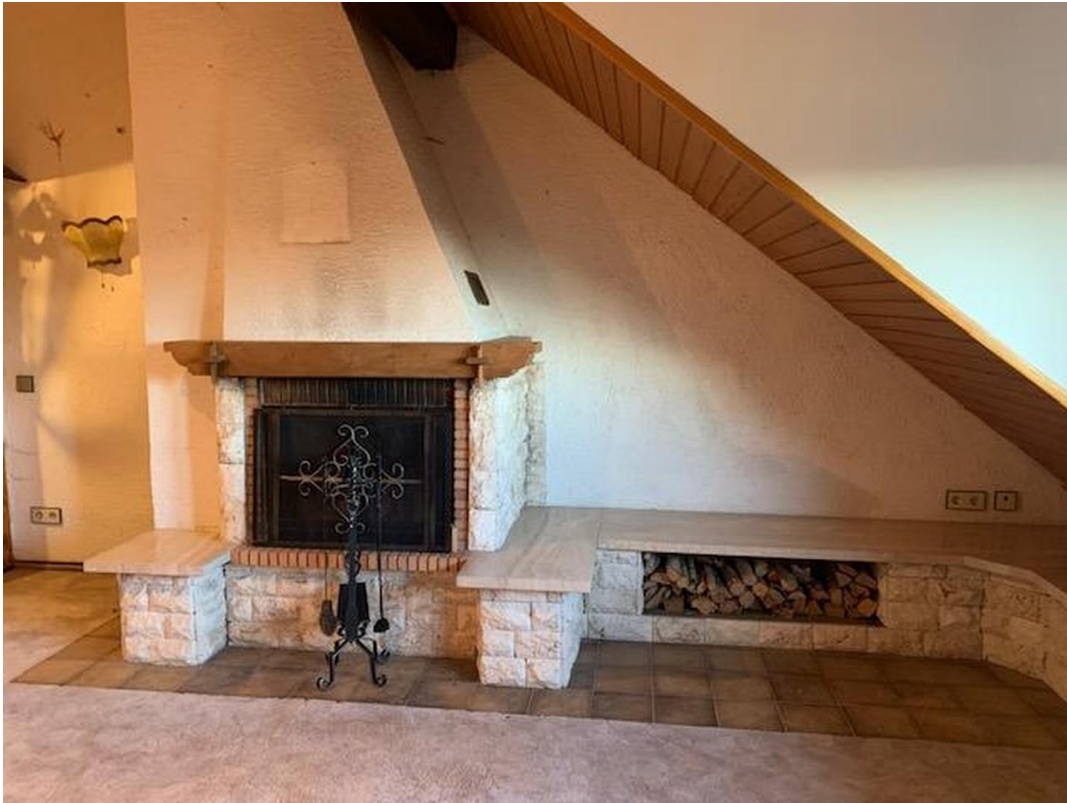
Kamin im OG