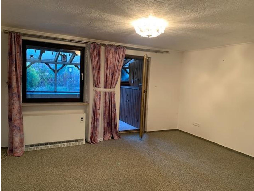
Zimmer im UG mit Gartenzugang