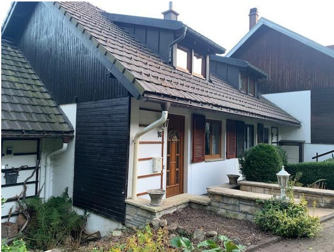
Zugang andere Seite