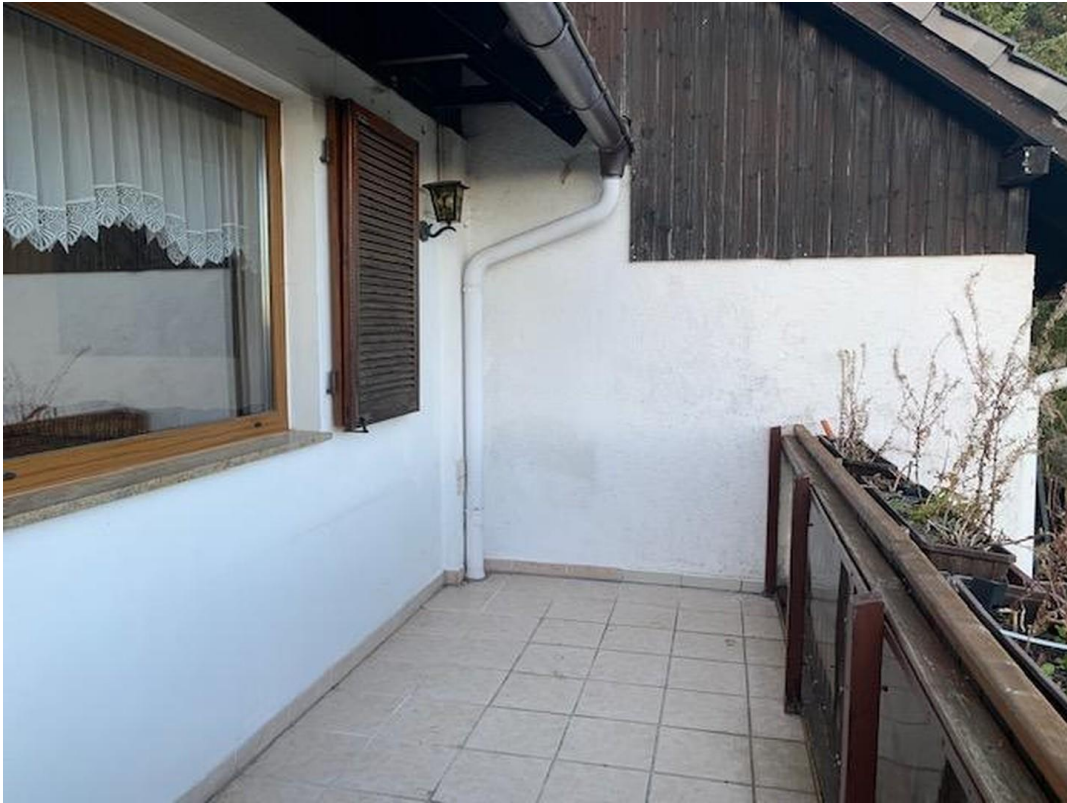
Balkon wird bald saniert