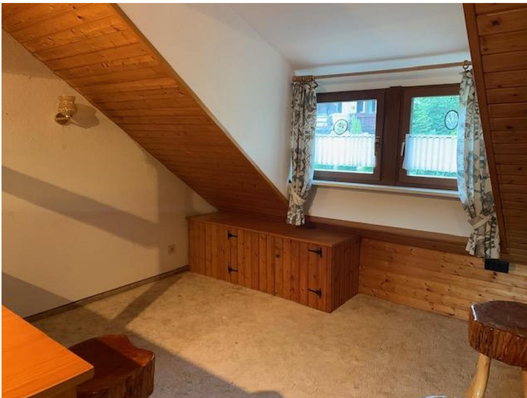
Arbeitsecke oder Schlafbereich