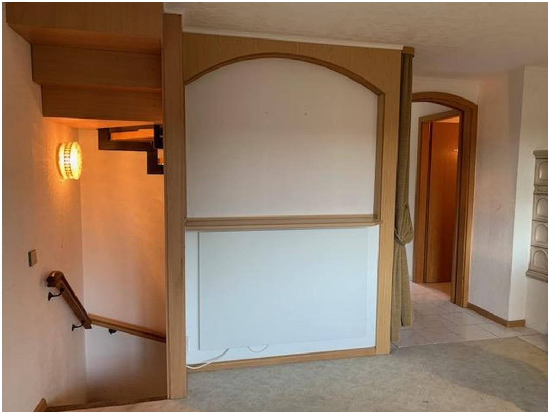
Wohnzimmer mit Zugang UG