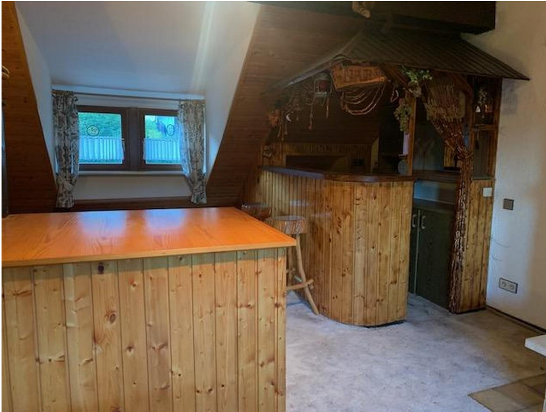
Bar im OG nach Abstimmung