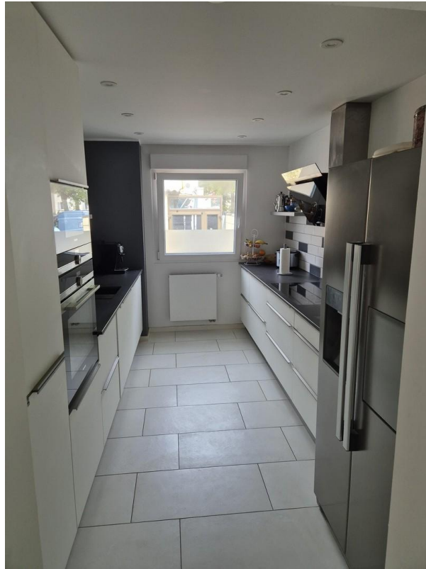
Küche mit Deckenbeleuchtung