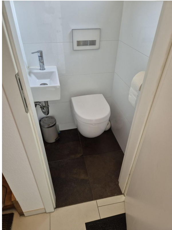
Neues Gäste - WC