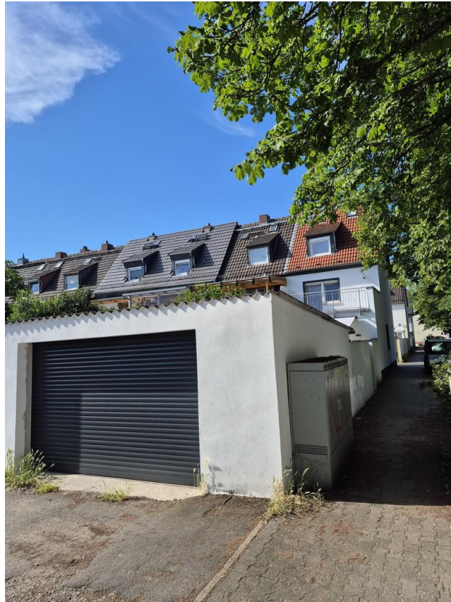
Neue Garage mit elek. Tor