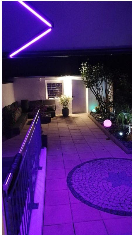
Gartenansicht mit Markise