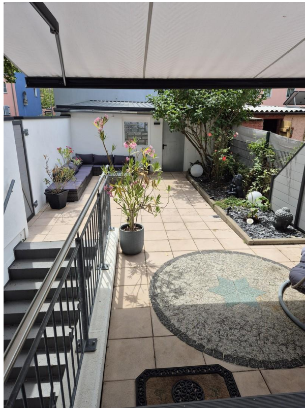
Blick in den Garten