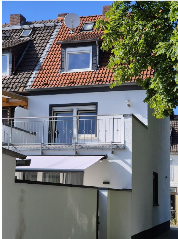
Seitenansicht mit Gartentür