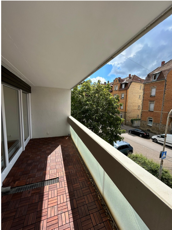
Balkon 2 Süden