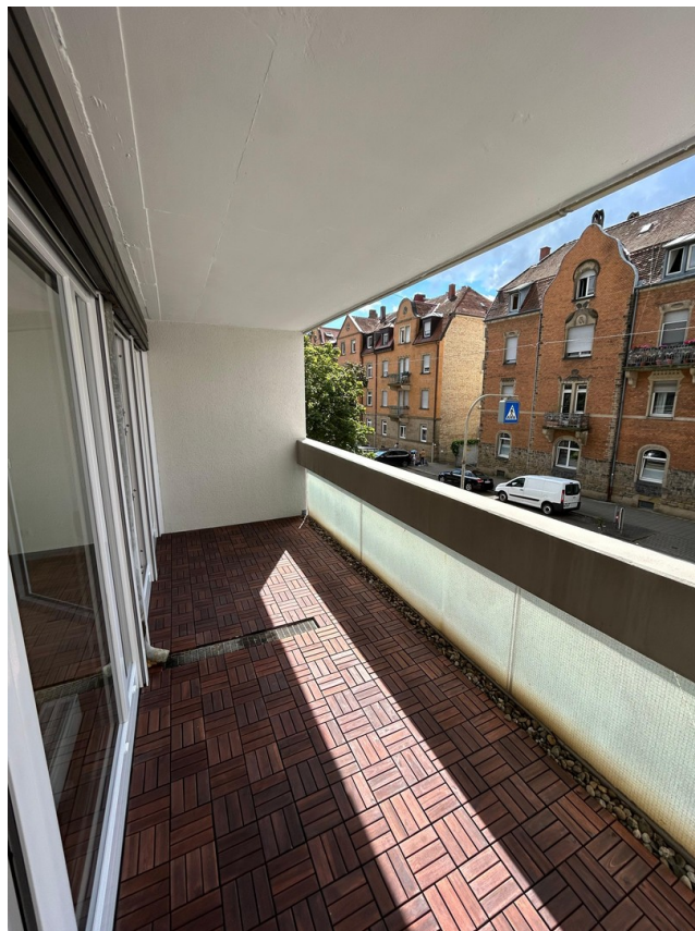
Balkon 1 Süden