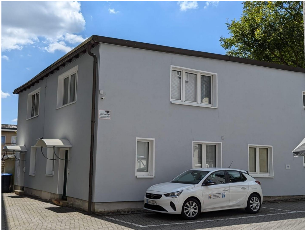
Haus mit 4 Appartements