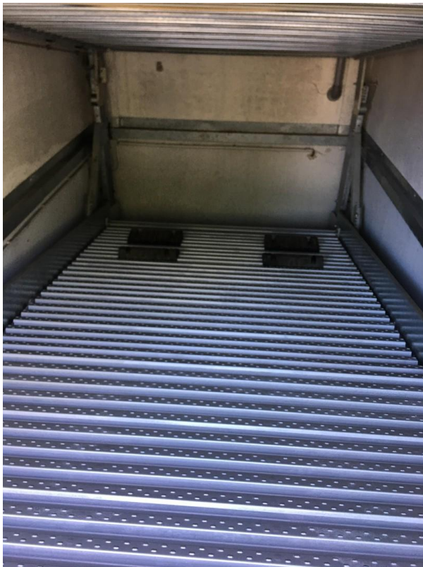
1. Garagenstellplatz detail