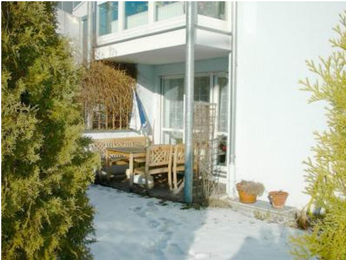
Terrasse mit Garten