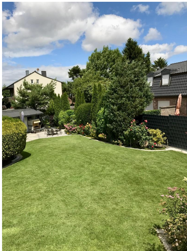
Blick vom Schwimmbad