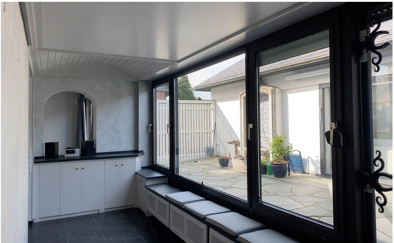
Blick ins Atrium