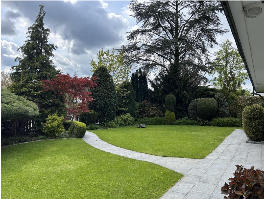
Vor dem Haus