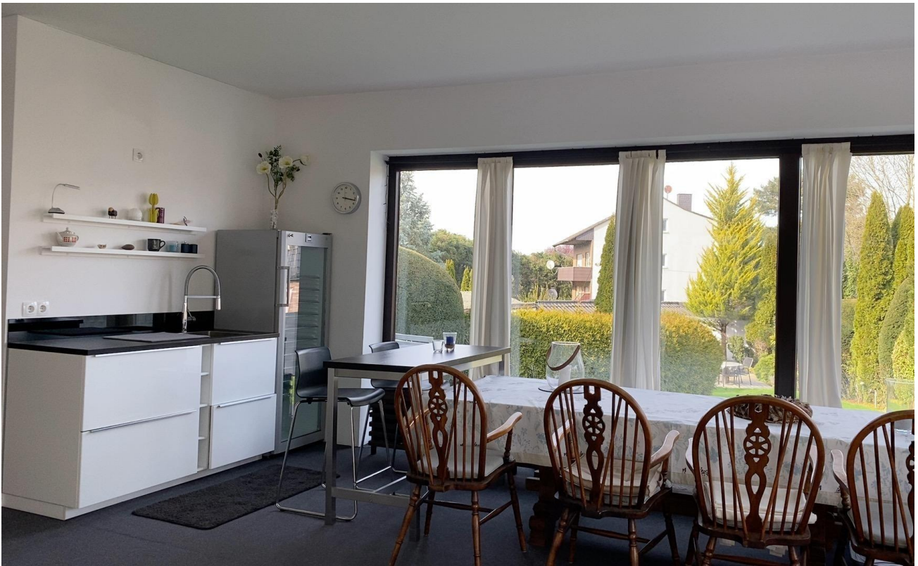
Schwimmhalle mit Kochecke