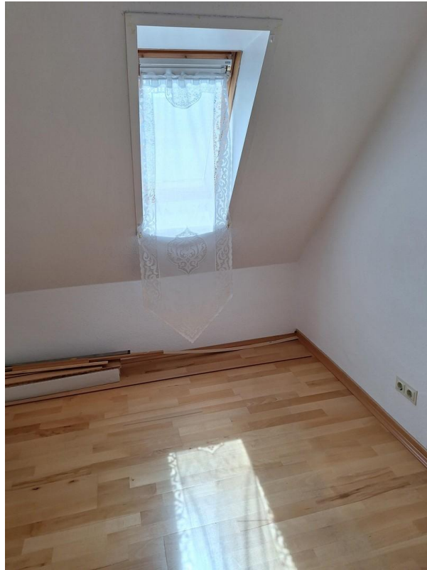
OG Zimmer 1