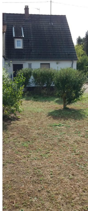
Ansicht hinten Eingang/Garten