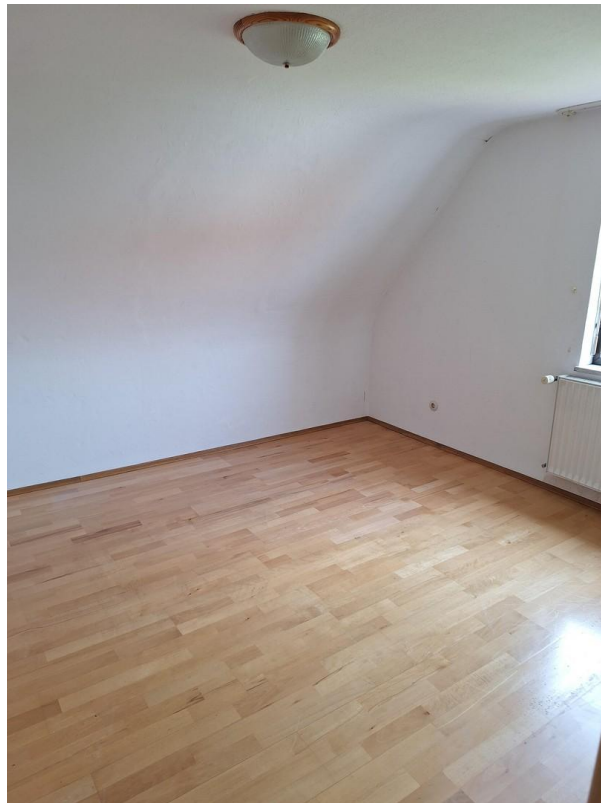
OG Zimmer 2