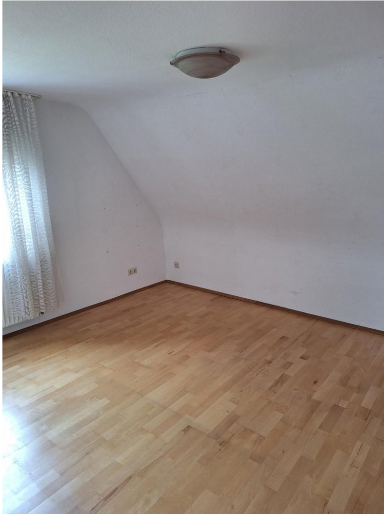
OG Zimmer 3