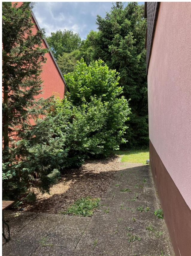
Seite und Durchgang zum Garten