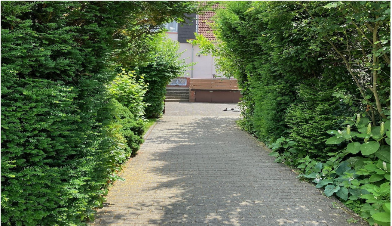
Einfahrt / Vorgarten