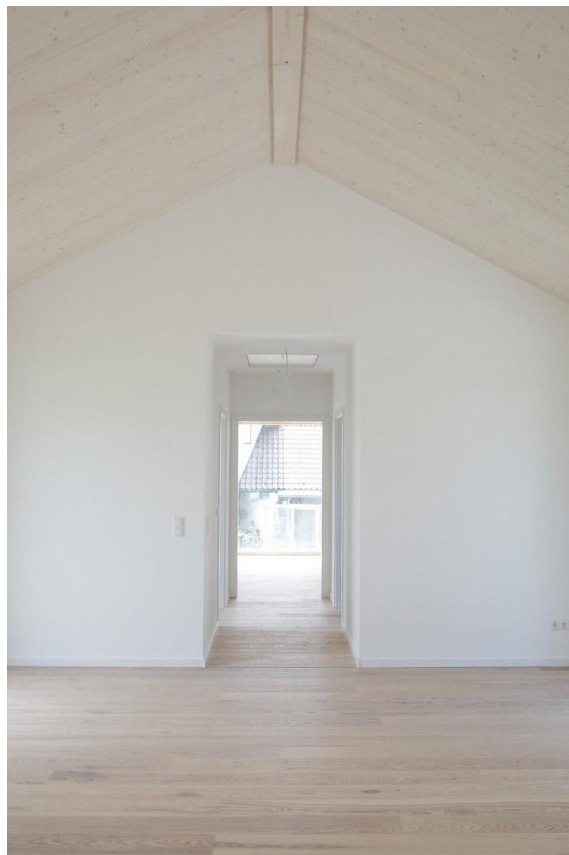
Wohnzimmer und Flur