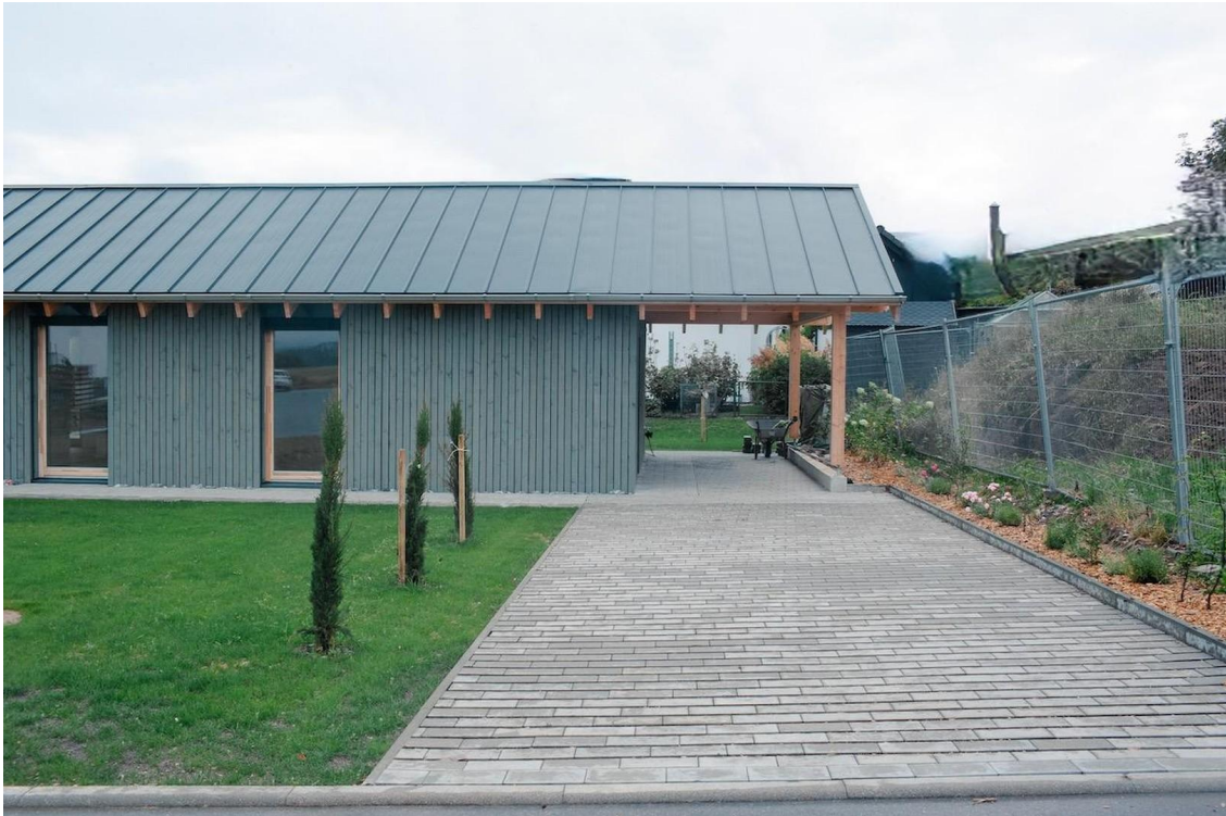
Hof und Carport