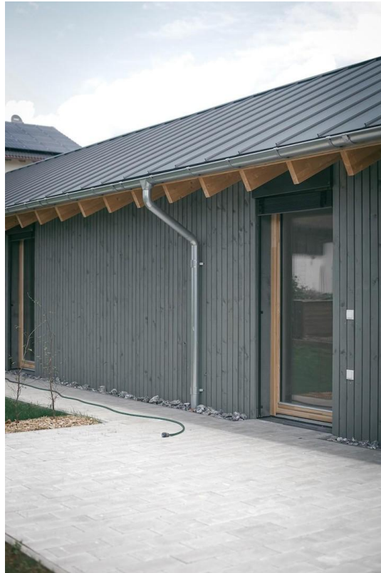
Blick von der Terrasse